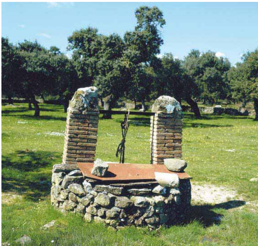
En muchas zonas la disponibilidad de agua subterránea solo es posible ya mediante extracción en pozos cada vez más profundos, lo que en bastantes casos hace inaccesible el agua por motivos económicos.

de nuestro país. El trabajo se ha realizado en el marco del proyecto de la Fundación Biodiversidad Evaluación de los Ecosistemas del Milenio en España , y ha consistido en identificar, de forma sistemática, los servicios que ofrecen las aguas subterráneas al ser humano en nuestro país y en realizar una primera evaluación del estado de dichos servicios.