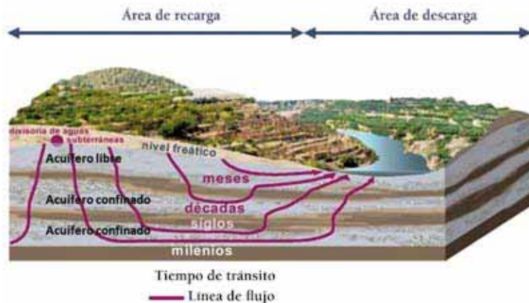
Figura 2. Tipos de acuíferos en función de la presión hidrostática del agua contenida en ellos y tiempos tránsito del agua subterránea (orientativo) (IGME, 2001).