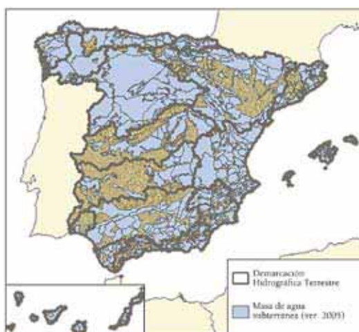
Figura 1. Masas de agua subterránea definidas en España (MMA, 2007).

En 2007, el entonces Ministerio de Medio Ambiente identificó un total de 740 masas de agua subterránea, si bien en textos posteriores aparecen cifras algo distintas (Figura 1). Las masas de agua subterránea son la unidad de aplicación de las Directivas Europeas Marco de Aguas y Para la Protección de la Aguas Subterráneas; aunque su definición no coincide estrictamente con la de acuífero , a efectos de este texto, los matices no son relevantes. Esas 740 masas de agua cubren unos 350 000 km 2 , alrededor del 70% del territorio nacional. Para definir las se usaron los límites físicos significativos tales como bordes impermeables o cauces de ríos efuentes y, en algunos casos, se consideraron los límites de influencia de la actividad humana. El tamaño de las masas de agua subterránea en España varía entre menos de 2,5 km 2 y más de 20 000 km 2 .