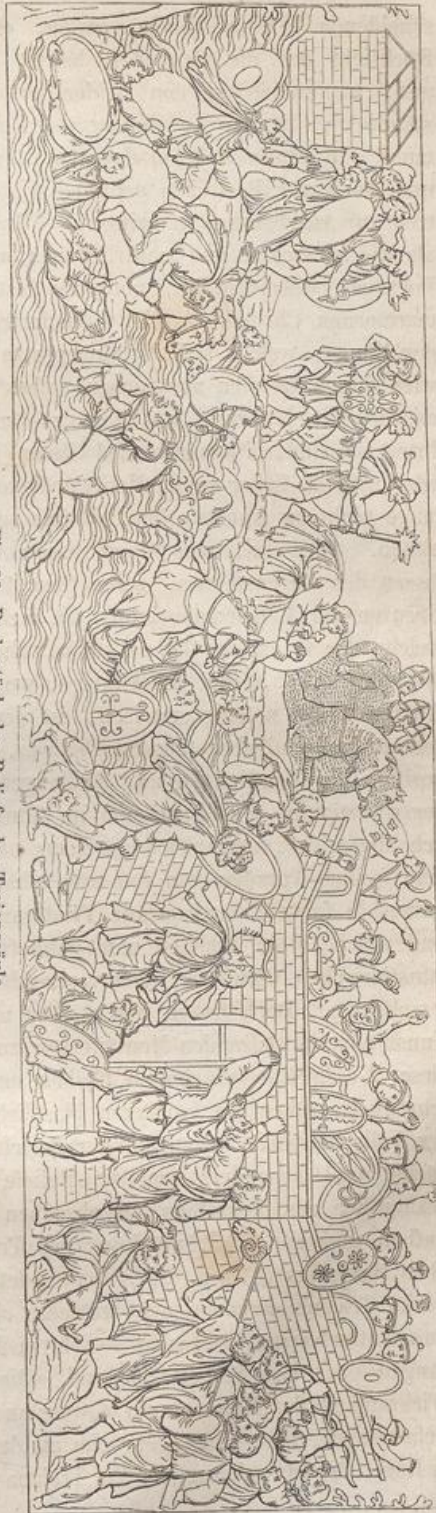
Fig. 99. Probestück der Reliefe der Trajanssäule.

Wenden wir uns von dem Gegenstande zu dem künstlerischen Charakter dieser Darstellungen, so muss allem Weiteren voran der absolute und platte Realismus als das Bestimmende und Ent-