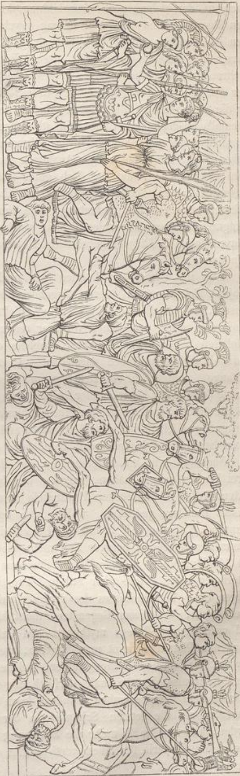
Fig. 100. Proben eines grossen historischen Reliefs aus Trajan's Zeit.

OVERBECK, Gesch. d. griech. Plastik. II.