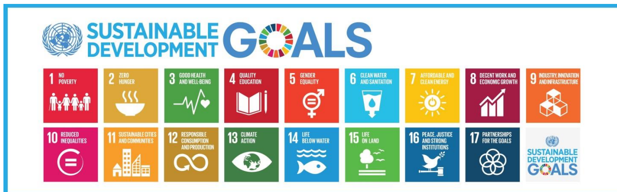
Εικόνα 2 Στόχοι Βιώσιμης Ανάπτυξης