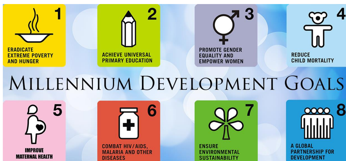
Εικόνα 1 Στόχοι Ανάπτυξης Χιλιετίας