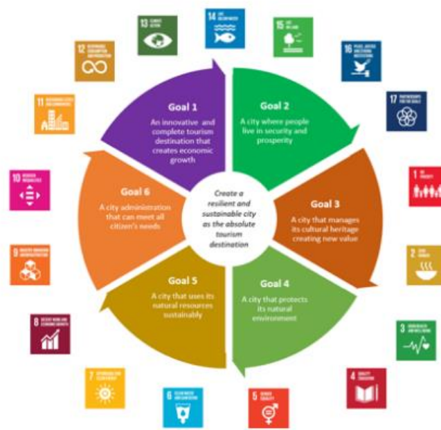
Διάγραμμα 4: Σύνδεση Στόχων με τους ΣΒΑ