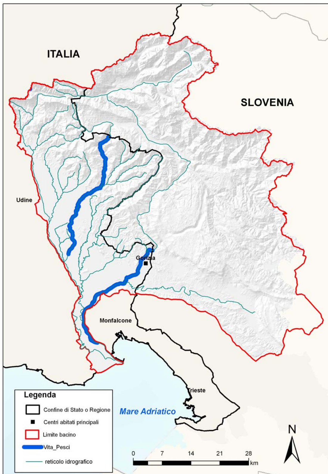
Figura 3.2: acque dolci idonee alla vita dei pesci.