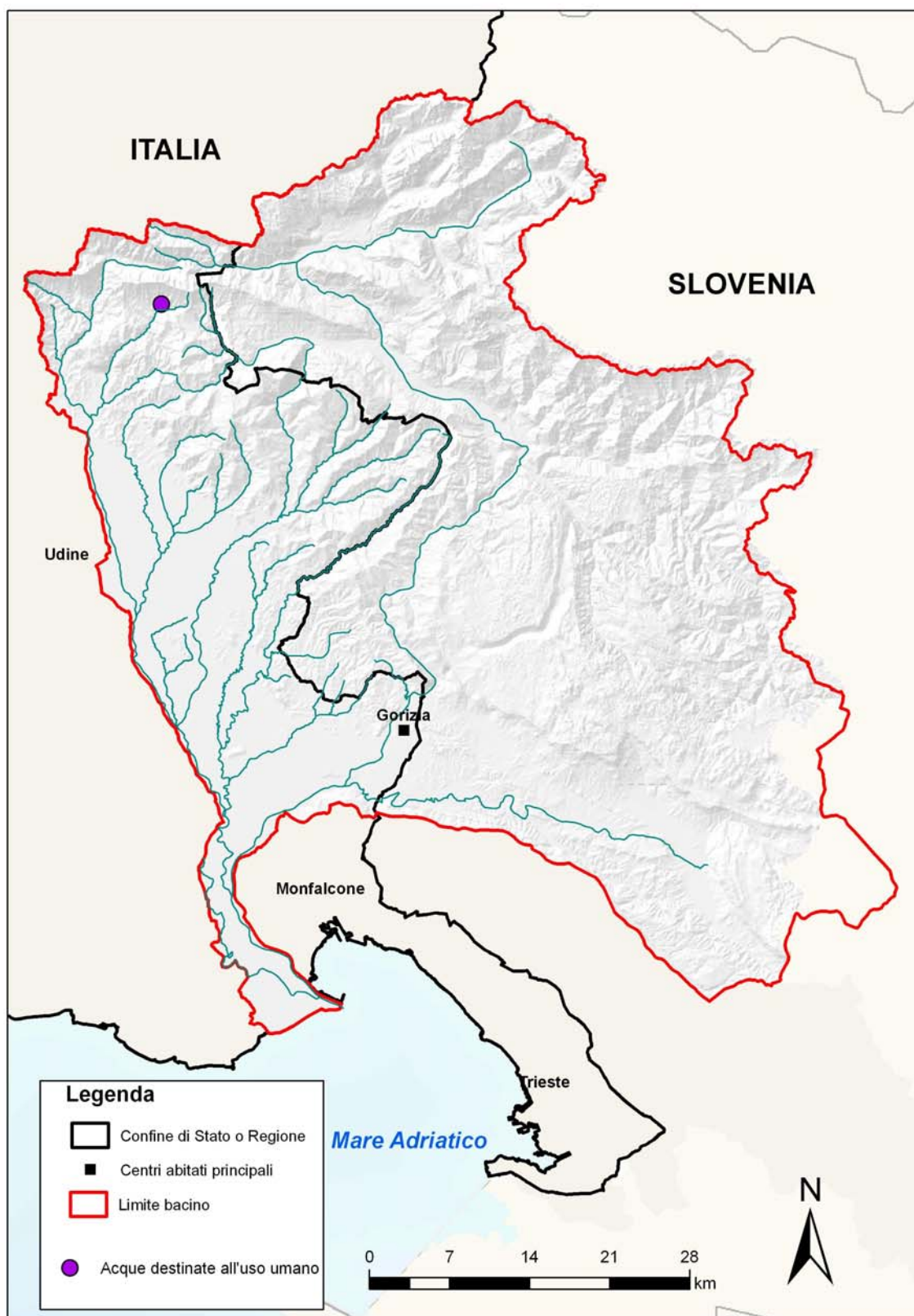
Figura 3.1: acque superficiali destinate alla produzione di acqua potabile.