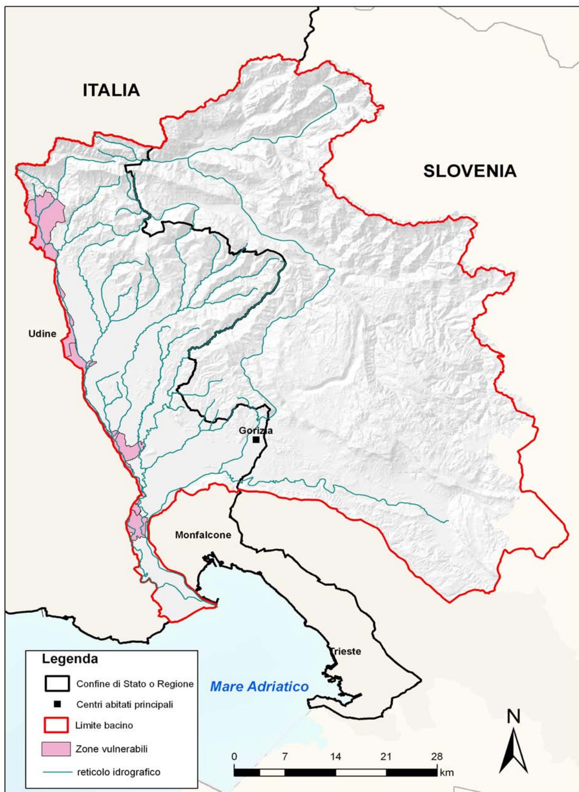
Figura 3.4: zone vulnerabili da nitrati di origine agricola.