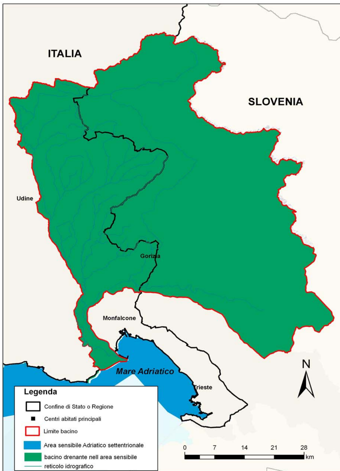
Figura 3.5: aree sensibili.