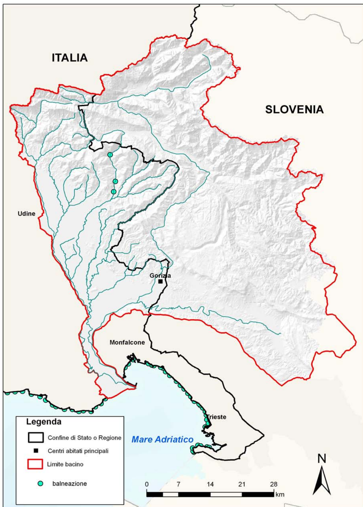
Figura 3.3: acque di balneazione.