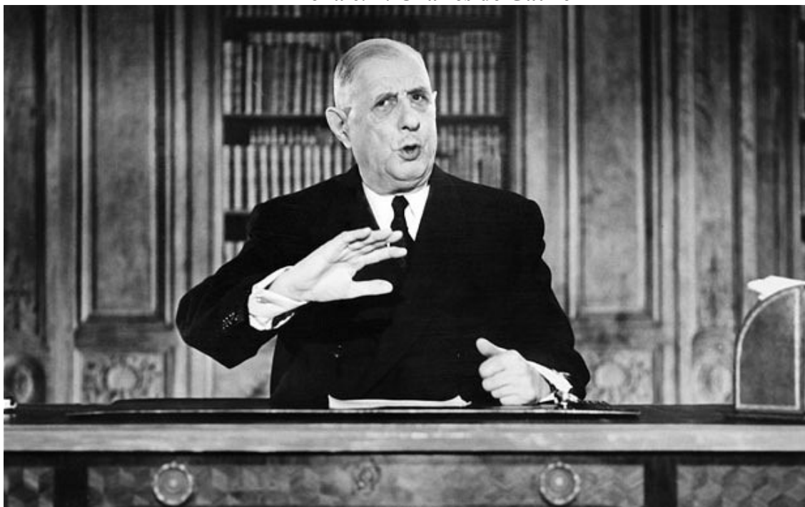
Příloha č. 2: Charles de Gaulle

< http://i.telegraph.co.uk/multimedia/archive/02455/gettydegaulle_2455627b.jpg >