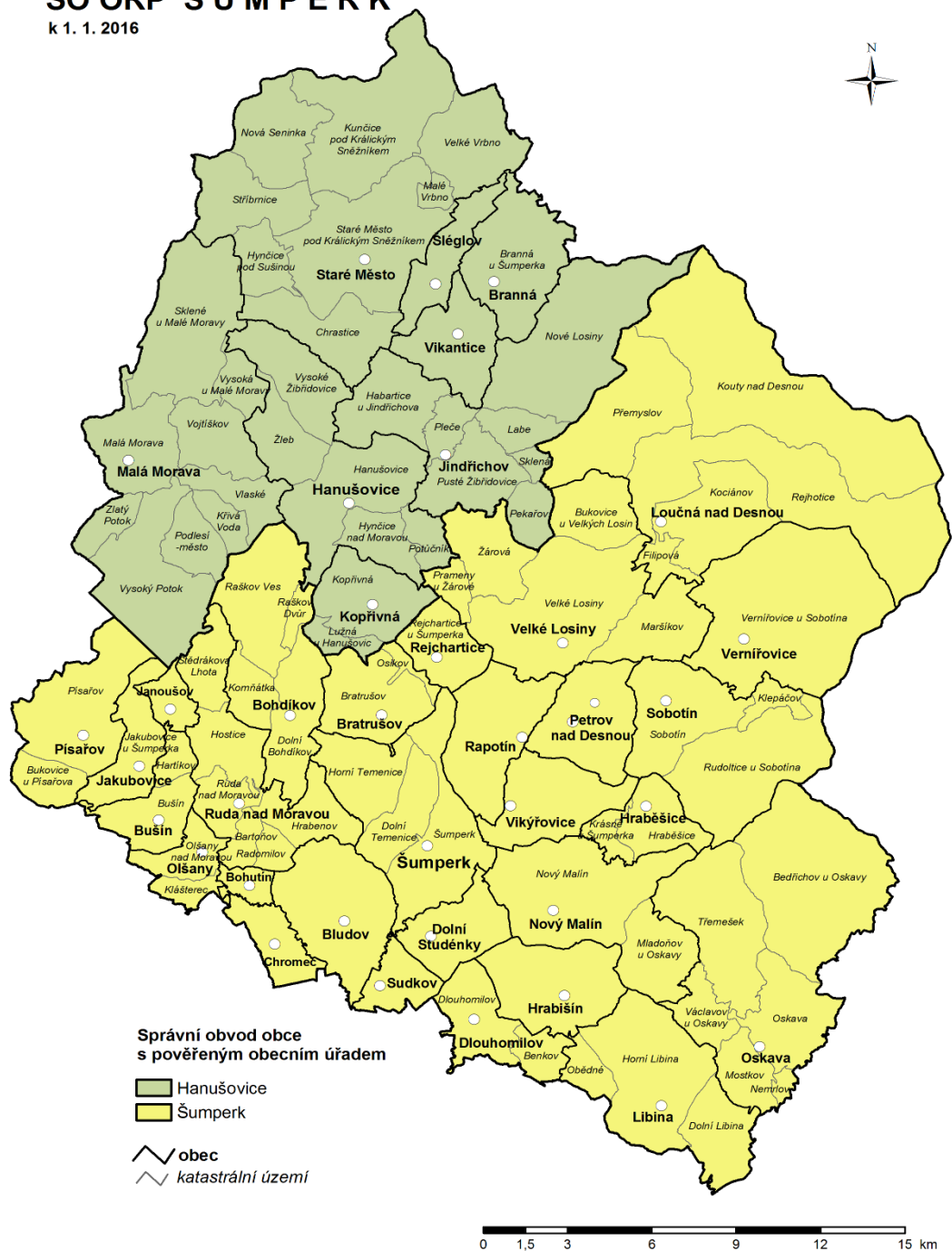
Obrázek 3: Administrativní mapa SO ORP Šumperk