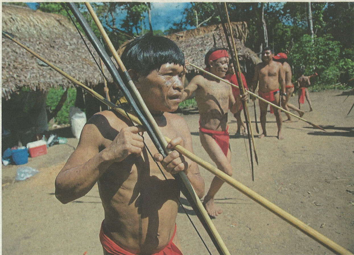
Rozmanitost. Proč jsou venezuelští Janomamové násilní a brazilští mírumilovní, jsou-li to stejní krvežíznivci Homo sapiens?

Určitě znáte italského filozofa Antonia Gramsciho, který prohlásil, že je pesimistou, protože má rozum, ale že je i optimistou, protože má vůli. Myslím, že to je hezká myšlenka.