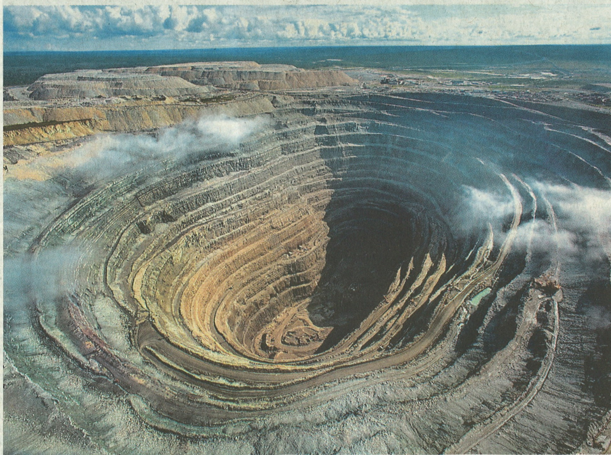
Antropocén. V novém geologickém období se stal hlavním geologickou silou člověk, což ukazuje i diamantový důl na Sibiři.