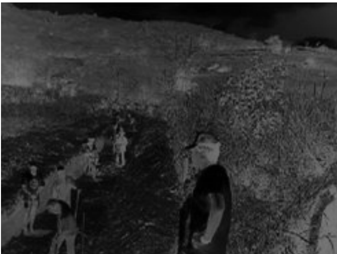
Figura 2: Construcción de una presa sub-superficial en Brasil (izquierda) y una presa madura en Kenia (derecha)

Hay dos tipos de estructuras sub-superficiales (Figuras 2 y 3): (a) presas cortadas en la cubierta aluvial para interceptar el flujo de agua subterránea (presas de agua subterránea) y (b) presas construidas en los lechos de los cauces, aguas arriba de los cuales la sedimentación forma un acuífero (presas de arena).