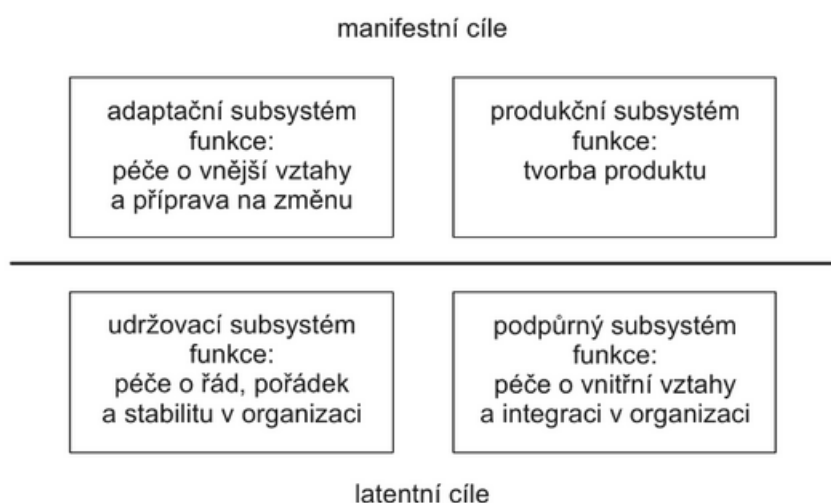
Obrázek 2: Latentní a manifestní cíle v organizaci

Tyto cíle se odlišují od sebe svou dynamikou, kdy manifestní cíle mají více statický charakter a proměňují se pomaleji než cíle latentní (Novotná, 2008).