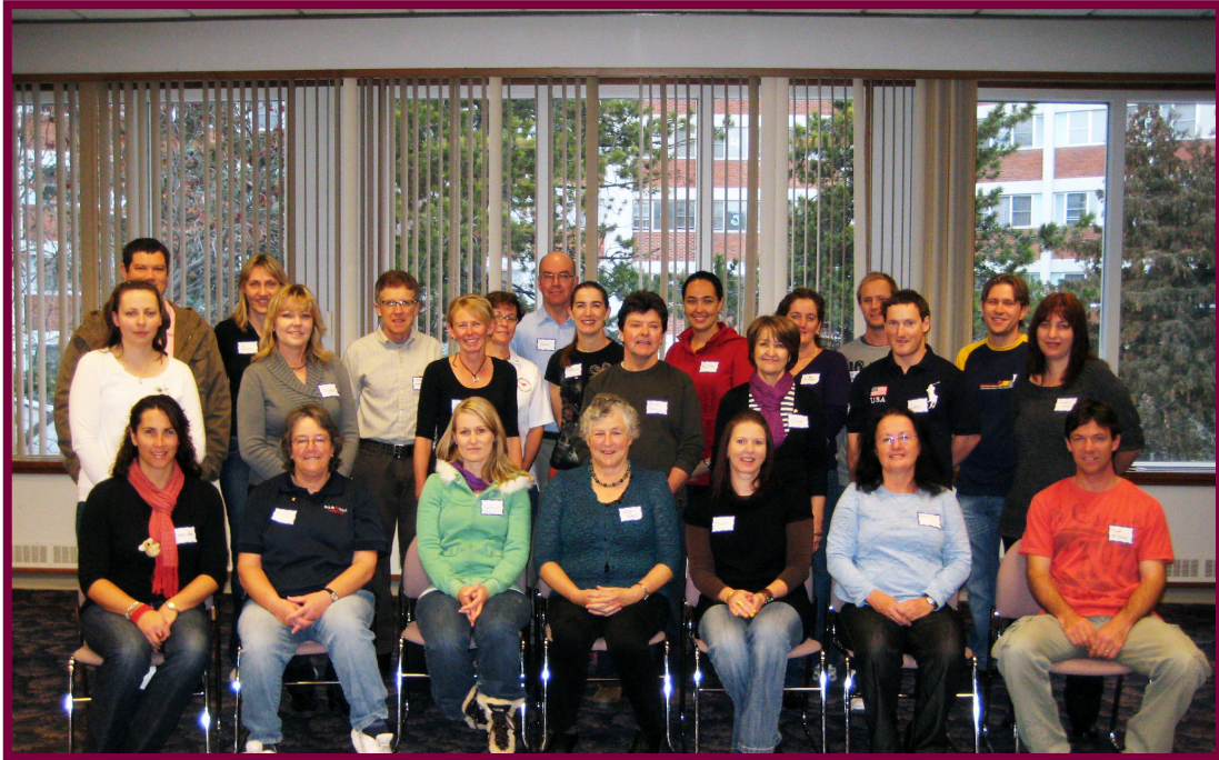
(Enseignants ayant participé à un échange avec l'Australie; photo prise lors d'une séance d'orientation, en janvier 2010)