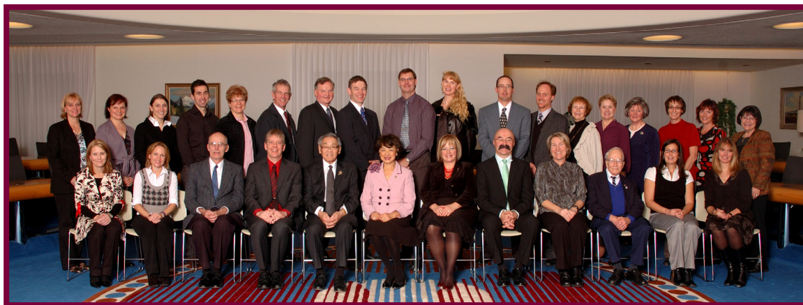
Une célébration soulignant le 30 e anniversaire du Programme d'échange d'éducation internationale de l'Alberta destiné aux enseignants.

dans la communauté scolaire éveille celle-ci au monde et offre aux enseignants albertains l'occasion de développer et de renforcer leurs compétences interculturelles. Les échanges d'éducateurs continuent à porter des fruits même