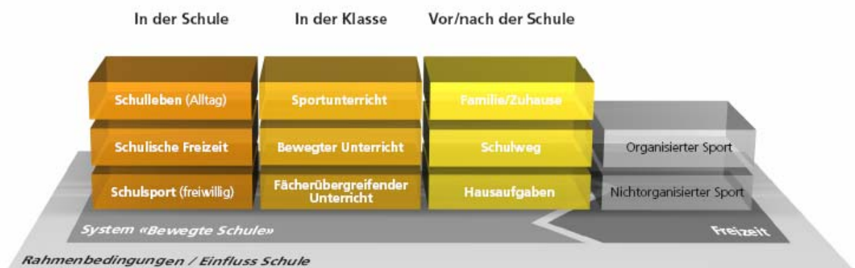
Abbildung 2: Modell der Bewegten Schule, Baspo, 2008, S. 3

Die EDK spricht sich in ihrer Erklärung „Bewegungserziehung und Bewegungsförderung in der Schule“ vom Oktober 2005 dafür aus, dass der Sportunterricht durch Bewegungsförderung im Schulalltag ergänzt werden soll. Der Bewegungsförderung und Bewegungserziehung in der Schule soll in Zukunft ein noch stärkeres Gewicht beigemessen werden. Nebst dem obligatorischen Sportunterricht sollen die Chancen der Bewegung auch in anderen Schulfächern, im Schulalltag und im Schulumfeld genutzt werden. Das Ziel ist die Bewegte Schule, wie sie in Abbildung 2 dargestellt ist. Einzelne Bausteine können auch isoliert entwickelt-, bevor sie zu einem Ganzen geschmiedet werden. Hinter allen Formen und Umsetzungen der bewegten Schule steckt die gemeinsame Absicht, die Schule als einen Bewegungsraum zu verstehen und das gesamte Schulleben bewegt(er) zu gestalten. Massnahmen zur Umsetzung sind durch eine Arbeitsgruppe unter der Leitung der KKS (Konferenz der Kantonalen Sportbeauftragten) zusammengestellt worden.