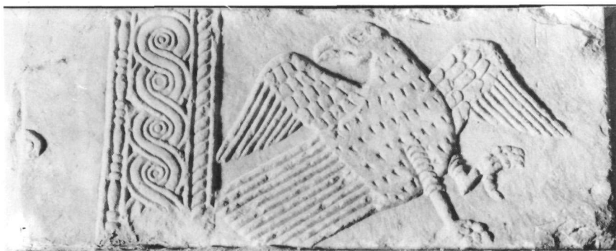
Εἰκ. 12. Ὑπερθυρο T. 188.

Τὰ παραπάνω γλυπτά ἀποτελοῦν τὰ κυριότερα δείγματα ὁμάδας ὑπερθύρων πού προέρχονται ἀπὸ τὴν περιοχὴ τῆς Ἀθήνας 22 . Κοινὸ χαρακτηριστικὸ τους ἡ διαίρεση τῆς ἐπιφάνειας σὲ διάχωρα, τρία ἢ πέντε, ἀπὸ κάθετες διακοσμητικὲς ζῶνες. Ἡ διακόσμηση ἄλλοτε περιορίζεται στὸ μεσαῖο χῶρο, ἄλλοτε ἀπλώνεται καὶ στὰ ἄλλα διάχωρα. Τὰ ἐπιμέρους στοιχεῖα, σταυροί, φυλλοφόροι κλάδοι, ζῶα, ρόδακες, ἀπαντοῦν συχνὰ σὲ γλυπτά τοῦ 9ου καὶ 10ου αἰῶνα καὶ ἀποτέλεσαν τὴ βάση γιὰ τὴ χρονολόγησι τῶν