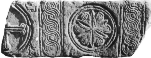
Εἰκ. 5. Ὑπέρθυρο T. 498.

Ἴδια διάταξη κοσμημάτων ἀκολουθεῖται καί στό ὑπέρθυρο T. 498 10 (διαστ. 0,75×0,295×0,28 μ.) ἀπό τή Συλλογή Θησείου (Εἰκ. 5). Ἀπό τό σωζόμενο τμήμα συμπεραίνουμε ὅτι τέσσερα κάθετα διαχωριστικά θά διαιρούσαν τήν ἐπιφάνεια σέ πέντε διάχωρα μέ διακόσμηση στά τρία. Ὁ ρόδα-