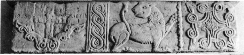
Εἰκ. 9. Ὑπέρθυρο Τ. 209.

Τά ὑπέρθυρα ἀπό τή μονή Πετράκη 17 παρουσιάζουν πλουσιότερη καί πιό φροντισμένη διακόσμηση, κατανεμημένη καί στά πέντε διάχωρα τῆς ἐπιφανείας τους, πού σχηματίζονται ἀπό κάθετους πλοχμούς, ταινίες καί ἀστράγαλο.