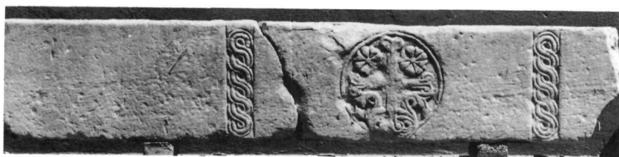
Εἰκ. 8. Ὑπέρθυρο Τ. 490.

Σταυρός καί ζῶα σέ χαμηλό ανάγλυφο, ἀποδοσμένα μέ πιό καλλιγραφικό τρόπο εἰκονίζονται καί στό ὑπέρθυρο Τ. 185 (διαστ. 1,75 \times 0,28 \times 0,16 μ.) ἀπό τή Συλλογή Θεσσαλίας (Εἰκ. 7). Οἱ κάθετοι πλοχομοί δημιουργοῦν τρία εὐρύχωρα, ὀρθογώνια διάχωρα. Στό κεντρικό σταυρός, μέ φυλλοφόρους βλαστούς πού καταλήγουν σέ φύλλα κισσοῦ 16 , πλαισιώνεται ἀπό δύο ἀντίωτους γρύπες στά ἄλλα διάχωρα. Οἱ φτεροῦγες τους, μέ λοβωτό περίγραμμα, ἀποτελοῦν ἰσχυρό διακοσμητικό στοιχεῖο καθώς καλύπτουν ὅλο σχεδόν τό σῶμα καί μέ ἀντίθετη φορά ἀπό τήν οὐρά πλησιάζουν τό κεφάλι, ὥστε νά σχηματίζονται κλειστές κυκλικές συνθέσεις. Οἱ δουλεμένοι πλοχομοί ἀπό