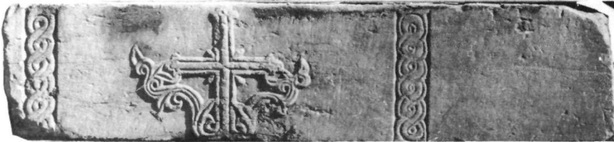
Εικ. 10. Ύπέρθυρο Τ. 450.

Τό άλλο ύπέρθυρο από τή μονή Πετράκη Τ. 979 (διαστ. 1,71×0,34×0,19 μ.) διατηρείται άκέραιο (Εικ. 11). Τό μεσαίο διάχωρο κατέχει ταινιωτός σταυρός μέ βλαστούς στά κάτω διάκενα καί άνθεμοτά φύλλα επάνω,