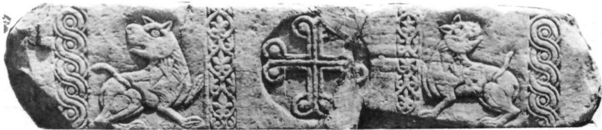
Εἰκ. 6. Ὑπέρθυρο T. 997-998.

(Εἰκ. 4), ἐνῶ μικρά ζῶα στίς γωνίες τοῦ ὀρθογωνίου διαγράφονται μέ τήν ἀφαίρεση μαρμάρου ἀπό τό περίγραμμα. Εἶναι ζωικές μορφές σέ ἓνα μεταβατικό στάδιο ἀπό τά ζῶα τῆς Σκριποῦς 12 —ἰσοδύναμα ἐκεῖ μέ τή φυτική διακόσμηση— στά ζῶα τῶν γλυπτῶν τοῦ τέλους τοῦ 9ου - ἀρχῶν τοῦ 10ου αἰώνα, μορφές αὐτοδύναμες, μέ ἔντονη διάπλαση, δουλεμένες σέ δικό τους χῶρο 13 .