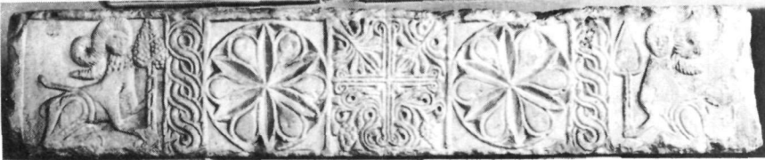
Εικ. 11. Ύπέρθυρο Τ. 979.

λοξά στις γωνίες τών κεραιών. Οί βλαστοί μέ φύλλα στρογγυλά καί καρπούς κληματίδας καλύπτουν πυκνά τήν επιφάνεια. Μεγάλοι ρόδακες μέ δύο είδη φύλλων έγγράφονται στά άμέσως επόμενα διάχωρα, ενώ στά άκρια εικονίζονται σφίγγες 20 σέ πλάγια όψη μέ τό κεφάλι γυρισμένο μπροστά, μέ έγχά-