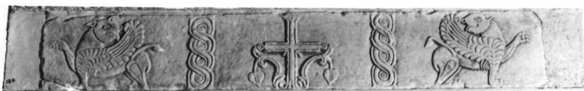
Εἰκ. 7. Ὑπέρθυρο Τ. 185.

ζονται γυρισμένα προς τό σταυρό, μέ τό κεφάλι στραμμένο πίσω 15 , σέ χαμηλό ανάγλυφο. Ἐντιμέτωπα, ἀλλά παράλληλα ἀπομονωμένα στούς ιδιαίτερους χώρους πού σχηματίζουν οἱ κάθετοι πλοχομοί καί οἱ δύο ζῶνες μέ τό σχηματοποιημένο φυτικό κόσμημα, πλαισιώνουν τόν ἰσοσκελή σταυρό στόν κεντρικό χώρο, πού ὅπως καί στά Τ. 988, Τ. 498 (Εἰκ. 4, 5) προβάλλει ἀνάγλυφος μέ τήν ἀφαίρεση μαρμάρου ἀπό τό βάθος τοῦ κυκλικοῦ πλαισίου στό ὁποῖο ἐγγράφεται.