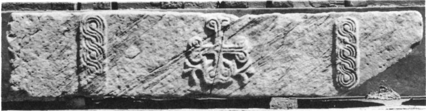
Εἰκ. 1. Ὑπέρθυρο Τ. 1014.

Στά παλιότερα παραδείγματα ἀνήκει τό ὑπέρθυρο Τ. 1014 (διαστ. 1,70 \times 0,35 \times 0,23 μ.) ἀπό τή Συλλογή Θεσείου 1 (Εἰκ. 1), μέ διακόσμηση μόνο