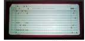
80 KOLON DELİKLİ KART

Hacettepe Üniversitesinde Matematik bölümünde okurken ve de henüz Bilgisayar Mühendisliği yok iken başında da onursal Başkanımız Aydın KÖKSAL hocamızın müdürlüğünü yaptığı o zamanki adı İnfomatik Enstitüsü olan bölümden seçmeli ders olarak Fortran IV ve Cobol programlama dilini alarak programcılığı öğrendim. Artık iş hayatına atılma zamanım geldiğinde 1977 'de Petrol Ofisi'ne programcı olarak kurumdaki o zamanki adıyla Otomasyon Müdürlüğüne başladım. Başladığımda kurumda 1968 yılı yapımı UNIVAC 9200 bilgisayarı vardı. UNIVAC 9200 Bilgisayarın 8KB (KiloBayt) belleği vardı. Yanlış duymadınız sadece 8Kb belleği vardı. UNIVAC bilgisayarın ağırlığı belleği gibi 8-10 ton civarında idi. Ayrıca harici yada dahili diski, teypi, disketi gibi yedekleme birimleri de yoktu. Programlar ve veriler başlangıçta 96 kolonlu kartlara delinirken daha sonraki yıllarda 80 kolonluk kartlara delinir olmuştü. Veriler de bu delikli kartlara deliniyordu.