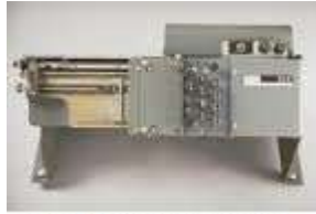
KART DELGİ MAKİNASI

Kartları delen, sıralayan, birleştiren yarı elektronik makinelerin yapımı genelde metallere oluşmakta idi. Merkezde kartları delen, delinen kartları sıralayan yada diğer kartlarla birleştiren