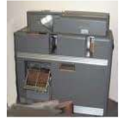
KART SIRALAMA MAK.

Kartları delen, sıralayan, birleştiren yarı elektronik makinelerin yapımı genelde metallere oluşmakta idi. Merkezde kartları delen, delinen kartları sıralayan yada diğer kartlarla birleştiren