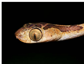
118 Imantodes cenchoa (AST) COLUBRIDAE