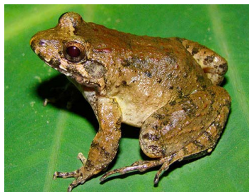
47 Leptodactylus cf. validus ♂ (FRR) LEPTODACTYLIDAE