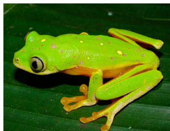
51 Agalychnis medinae (FRR) PHYLLOMEDUSIDAE