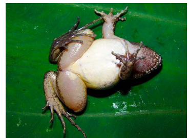
48 Leptodactylus cf. validus ♂ (FRR) LEPTODACTYLIDAE