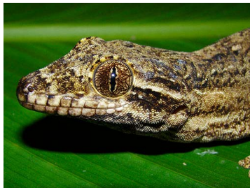
85 Thecadactylus rapicauda (FRR) PHYLLODACTYLIDAE