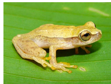
31 Dendropsophus microcephalus (FRR) HYLIDAE