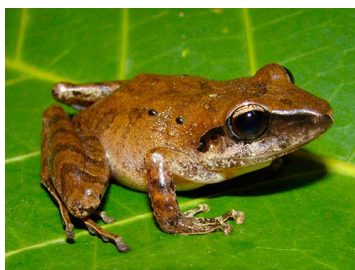
18 Pristimantis terraebolivaris (FRR) CRAUGASTORIDAE