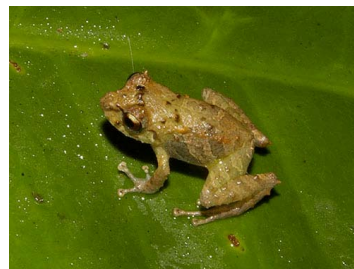
15 Pristimantis bicumulus (SL) CRAUGASTORIDAE