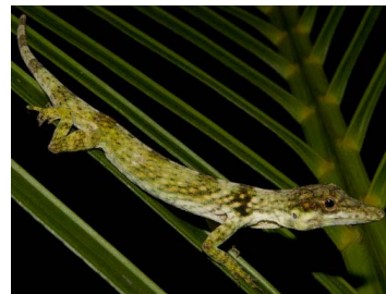
75 Anolis tigrinus ♂ (SL) DACTYLOIDAE