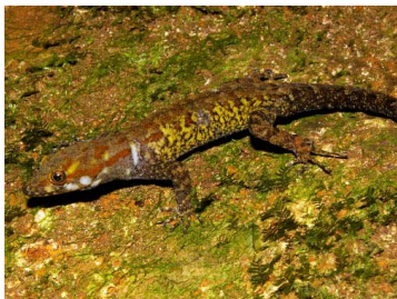
89 Gonatodes falconensis ♂ (SL) SPHAERODACTYLIDAE