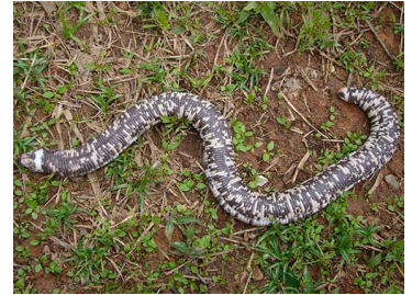
64 Amphisbaena fuliginosa (FRR) AMPHISBAENIDAE