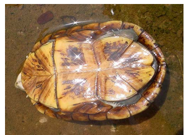
60 Kinosternon scorpioides (FRR) KINOSTERNIDAE