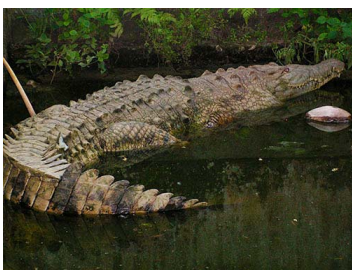
57 Crocodylus acutus (FRR) CROCODYLIDAE