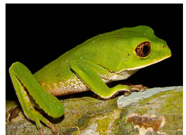
52 Phyllomedusa trinitatis (FRR) PHYLLOMEDUSIDAE