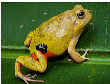
49 Pleurodema brachyops (FRR) LEPTODACTYLIDAE