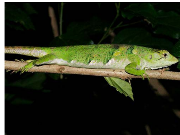
86 Polychrus auduboni (AST) POLYCHROTIDAE