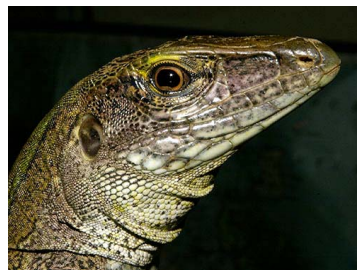
98 Ameiva praesignis (SL) TEIIDAE