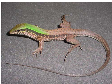
97 Ameiva praesignis (FRR) TEIIDAE