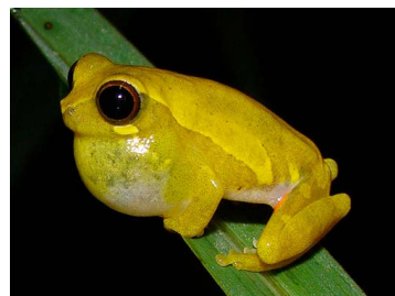
30 Dendropsophus luteocellatus (FRR) HYLIDAE