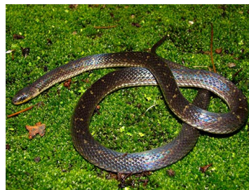
106 Atractus lancinii (FRR) COLUBRIDAE