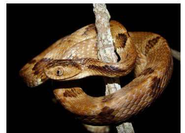
112 Dipsas variegata (FRR) COLUBRIDAE