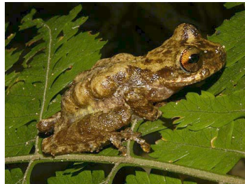
22 Flentonotus pygmaeus ♀ (SL) HEMIPHRACTIDAE