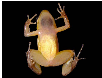
2 Allobates pittieri ♂ (FRR) AROMOBATIDAE