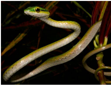
121 Leptophis coeruleodorsus COLUBRIDAE

[fieldguides@fieldmuseum.org] [1077] versión 1 10/2018