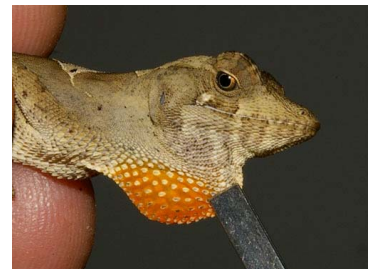
72 Anolis planiceps ♂ (SL) DACTYLOIDAE