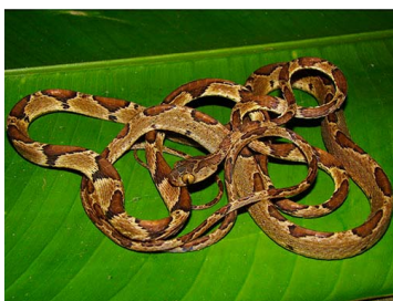
117 Imantodes cenchoa (FRR) COLUBRIDAE