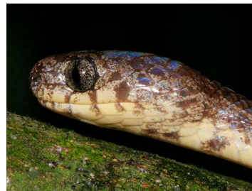
131 Sibon nebulatus (AST) COLUBRIDAE