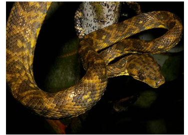
104 Corallus ruschenbergerii (SL) BOIDAE