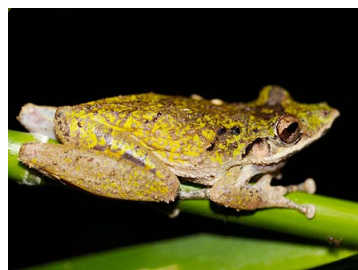
38 Scinax rostratus (JLV) HYLIDAE