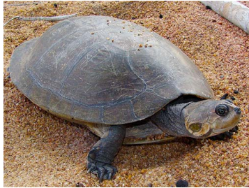
61 Podocnemis vogli PODOCNEMIDIDAE

Fotos: Fernando J.M. Rojas-Runjaic, Sebastian Lotzkat (SL), Alfredo Sánchez-Tójar (AST), José Luis Vieira-Fernandes (JLV), Luis Alejandro Rodríguez J. (LAR), Michelle Castellanos (MC), Javier Mesa (JM), Edwin Infante (EI), Pedro Cabello (PC). Producido por Fernando J.M. Rojas-Runjaic. © F.J.M. Rojas-Runjaic [rojas_runjaic@yahoo.com]; S. Lotzkat [lotzkat@yahoo.com], A. Sánchez-Tójar [alfredo.tojar@gmail.com], J.L. Vieira-Fernandes [jlvieirafrog@gmail.com] & L.A. Rodríguez J. [reptiven@gmail.com]. [fieldguides@fieldmuseum.org] [1077] versión 1 10/2018