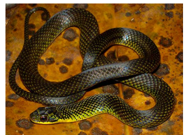
116 Erythrolamprus zweifeli (FRR) COLUBRIDAE