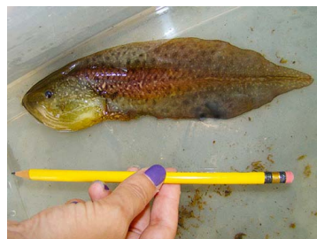
34 Pseudis paradoxa (FRR) HYLIDAE