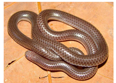
140 Trilepida macrolepis (FRR) LEPTOTYPHLOPIDAE