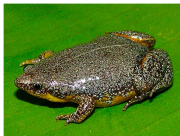
50 Elachistocleis ovalis (FRR) MICROHYLIDAE