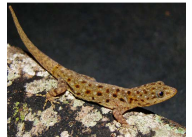
92 Gonatodes vittatus ♀ (FRR) SPHAERODACTYLIDAE