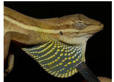
68 Anolis auratus ♂ (SL) DACTYLOIDAE