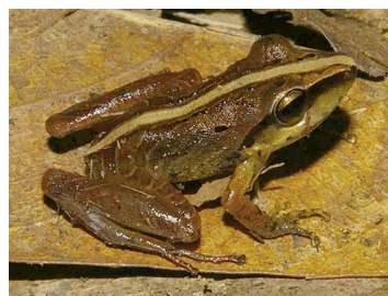
19 Pristimantis terraebolivaris (SL) CRAUGASTORIDAE