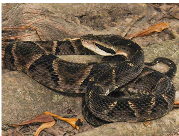
137 Bothrops venezuelensis (LAR) VIPERIDAE