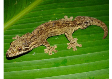
84 Thecadactylus rapicauda ♂ (FRR) PHYLLODACTYLIDAE