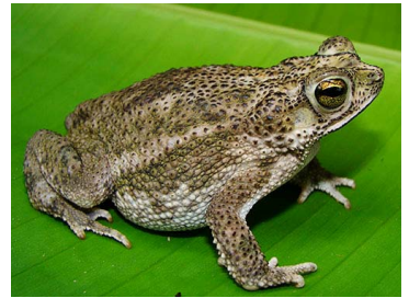
4 Rhinella beebei (FRR) BUFONIDAE