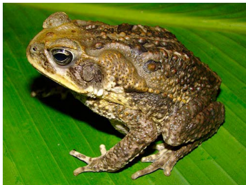
5 Rhinella marina (FRR) BUFONIDAE