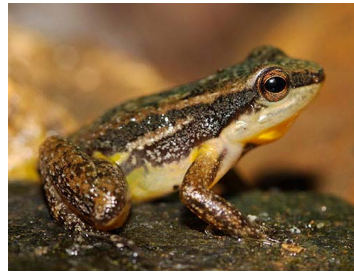
3 Mannophryne aff. herminae ♀ (JLV) AROMOBATIDAE