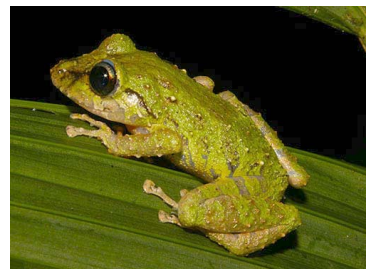
16 Pristimantis riveroi (SL) CRAUGASTORIDAE