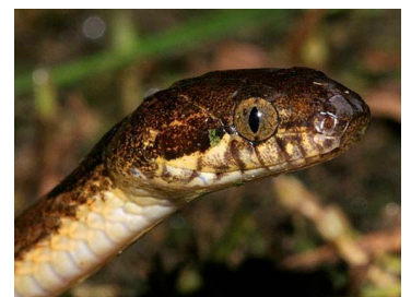
120 Leptodeira annulata (AST) COLUBRIDAE