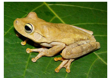
28 Boana xerophylla (FRR) HYLIDAE