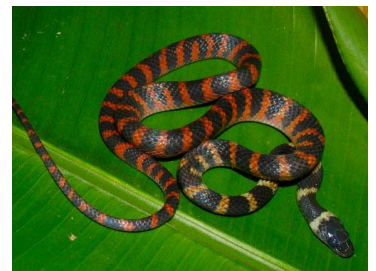
128 Oxyrhopus petolaris (FRR) COLUBRIDAE