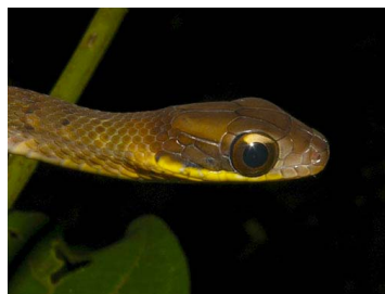
110 Dendrophidion nuchale (SL) COLUBRIDAE