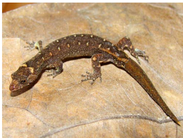
93 Pseudogonatodes lunulatus (FRR) SPHAERODACTYLIDAE