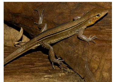
100 Cnemidophorus lemniscatus ♀ (FRR) TEIIDAE