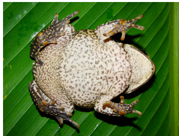
6 Rhinella marina (FRR) BUFONIDAE