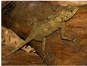
101 Plica caribeana TROPIDURIDAE