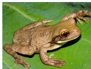
39 Trachycephalus typhonius (FRR) HYLIDAE