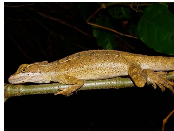
66 Basiliscus basiliscus (FRR) CORYTOPHANIDAE