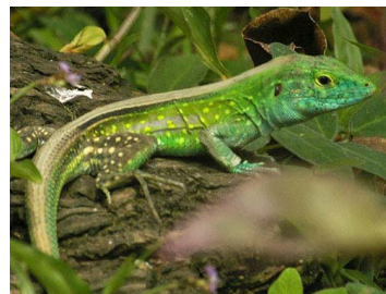
99 Cnemidophorus lemniscatus ♂ (SL) TEIIDAE