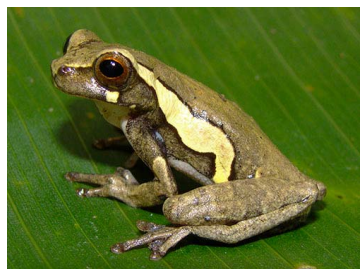
29 Dendropsophus luteocellatus (FRR) HYLIDAE