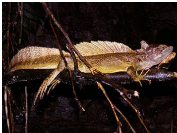
65 Basiliscus basiliscus (EI) CORYTOPHANIDAE