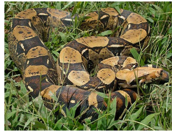
103 Boia constrictor (FRR) BOIDAE