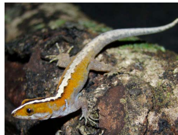
91 Gonatodes vittatus ♂ (FRR) SPHAERODACTYLIDAE