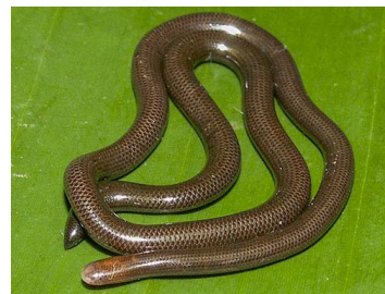
139 Liotyphlops albirostris (LAR) ANOMALEPIDIDAE