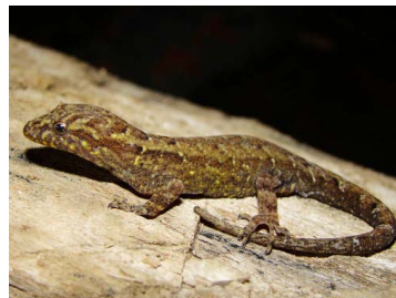
90 Gonatodes falconensis ♀ (FRR) SPHAERODACTYLIDAE