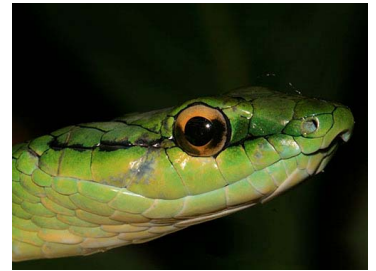
124 Leptophis occidentalis (AST) COLUBRIDAE