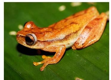
32 Dendropsophus microcephalus (JLV) HYLIDAE