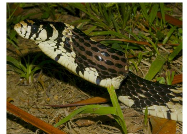
132 Spilotes pullatus (SL) COLUBRIDAE