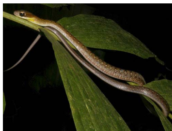
109 Dendrophidion nuchale (SL) COLUBRIDAE