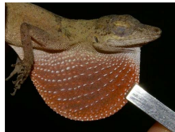
70 Anolis fuscoauratus ♂ (SL) DACTYLOIDAE