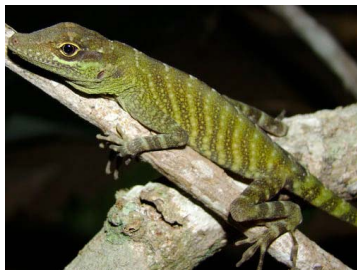
73 Anolis squamulatus ♂ (FRR) DACTYLOIDAE