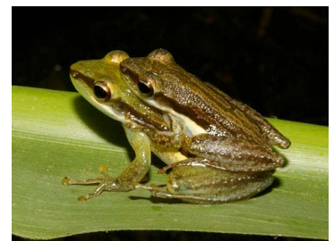
36 Scarthyla vigilans (SL) HYLIDAE