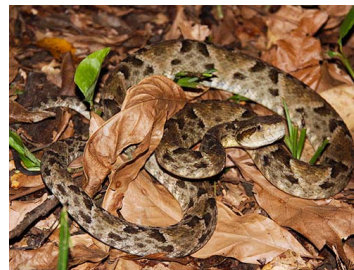
135 Bothrops colombiensis (JLV) VIPERIDAE