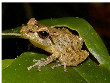
17 Pristimantis rozei (SL) CRAUGASTORIDAE