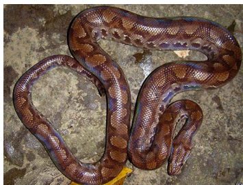
105 Epicrates maurus (FRR) BOIDAE