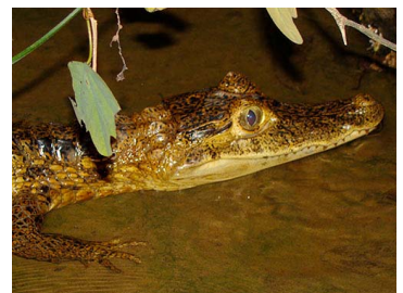
56 Caiman crocodilus (FRR) ALLIGATORIDAE