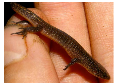
80 Ptychoglossus kugleri (SL) GYMNOPHTHALMIDAE