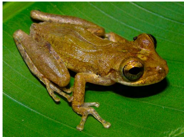
21 Flentonotus pygmaeus ♀ HEMIPHRACTIDAE

[fieldguides@fieldmuseum.org] [1077] versión 1 10/2018