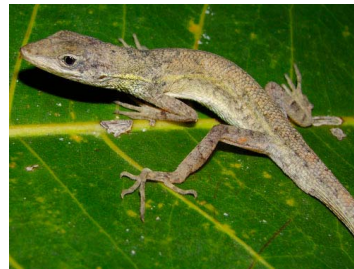
67 Anolis auratus ♂ (FRR) DACTYLOIDAE