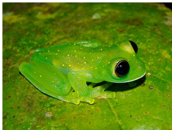
10 Vitreorana antisthenesi (FRR) CENTROLENIDAE