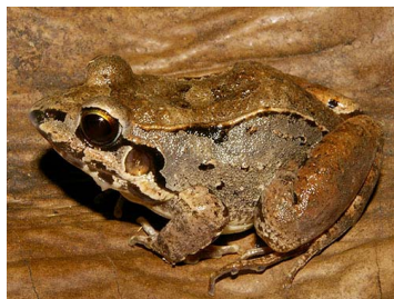
46 Leptodactylus poecilochilus (SL) LEPTODACTYLIDAE