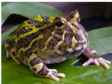
13 Ceratophrys calcarata ♂ (MC) CERATOPHRYIDAE