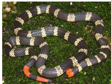
134 Micrurus mipartitus (FRR) ELAPIDAE