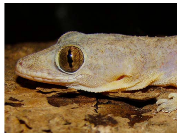
78 Hemidactylus mabouia (FRR) GEKKONIDAE