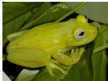
26 Boana punctata (SL) HYLIDAE