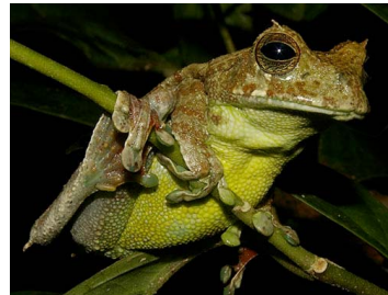
23 Gastrotheca walkeri (SL) HEMIPHRACTIDAE