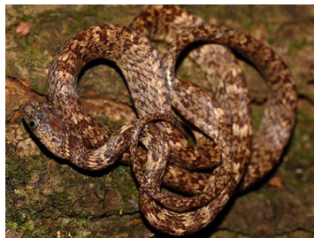
130 Sibon nebulatus (JLV) COLUBRIDAE