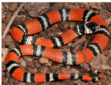
113 Erythrolamprus bizona (LAR) COLUBRIDAE