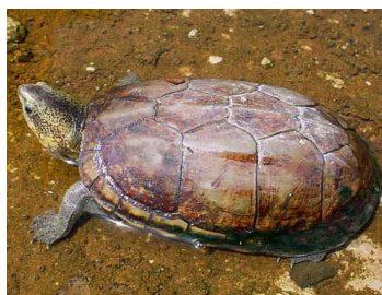
59 Kinosternon scorpioides (FRR) KINOSTERNIDAE