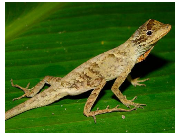
71 Anolis planiceps ♂ (FRR) DACTYLOIDAE