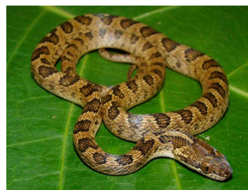
119 Leptodeira annulata (FRR) COLUBRIDAE