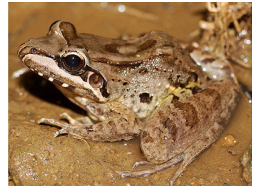
44 Leptodactylus insularum (JLV) LEPTODACTYLIDAE