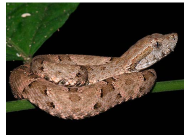
136 Bothrops colombiensis (AST) VIPERIDAE