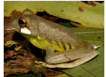
24 Gastrotheca walkeri (SL) HEMIPHRACTIDAE