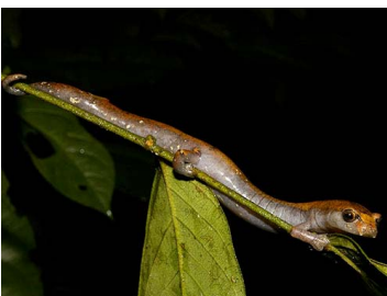
53 Bolitoglossa borburata (SL) PLETHODONTIDAE