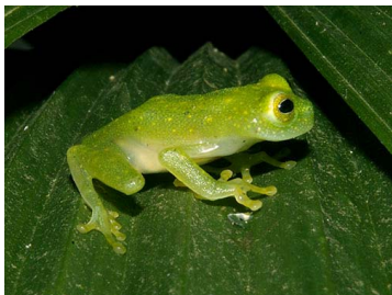
9 Hyalinobatrachium fragile ♂ (SL) CENTROLENIDAE