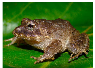
20 Strabomantis biporcatus (FRR) CRAUGASTORIDAE