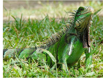
83 Iguana iguana ♂ (PC) IGUANIDAE