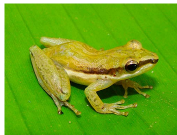
35 Scarthyla vigilans (FRR) HYLIDAE