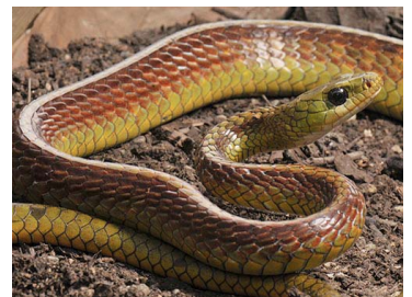
108 Chironius spixii (LAR) COLUBRIDAE