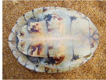
62 Podocnemis vogli (FRR) PODOCNEMIDIDAE