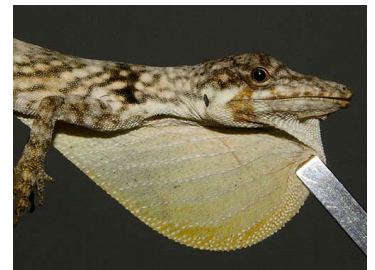
76 Anolis tigrinus ♂ (SL) DACTYLOIDAE