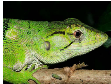
87 Polychrus auduboni (AST) POLYCHROTIDAE