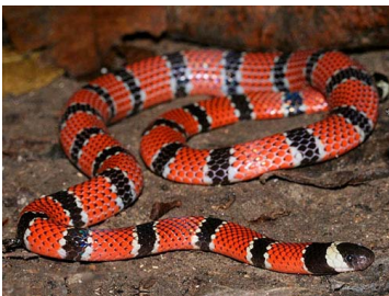
133 Micrurus dumerilii (AST) ELAPIDAE