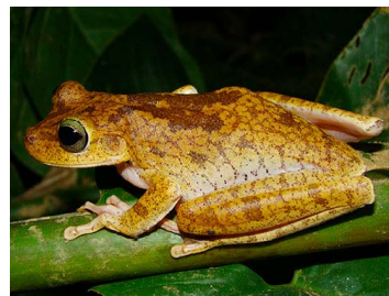
27 Boana xerophylla (FRR) HYLIDAE