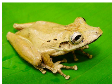
37 Scinax rostratus (FRR) HYLIDAE