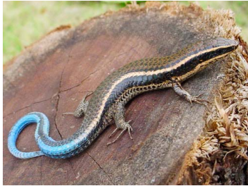
81 Tretioscincus bifasciatus GYMNOPHTHALMIDAE

[fieldguides@fieldmuseum.org] [1077] versión 1 10/2018