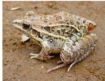
43 Leptodactylus fuscus (FRR) LEPTODACTYLIDAE