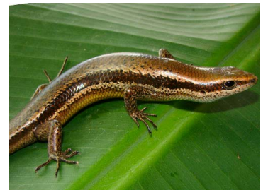
88 Copeoglossum nigropunctatum (FRR) SCINCIDAE