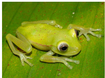
25 Boana punctata (FRR) HYLIDAE