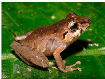
14 Pristimantis bicumulus (FRR) CRAUGASTORIDAE