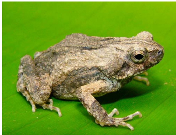
41 Engystomops pustulosus LEPTODACTYLIDAE