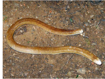
63 Amphisbaena alba (JM) AMPHISBAENIDAE