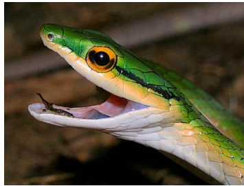
122 Leptophis coeruleodorsus (AST) COLUBRIDAE