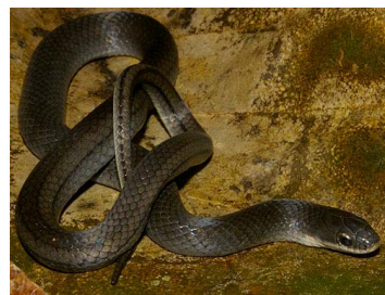
115 Erythrolamprus mertensi (SL) COLUBRIDAE