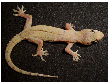
77 Hemidactylus mabouia (FRR) GEKKONIDAE