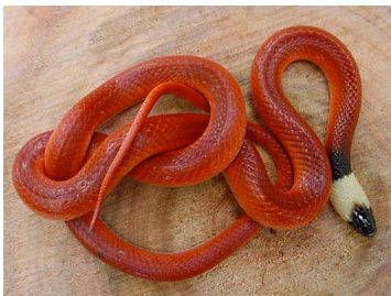
129 Pseudoboa neuwiedii (FRR) COLUBRIDAE