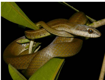
125 Mastigodryas boddaerti (SL) COLUBRIDAE