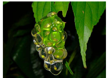
12 Vitreorana antisthenesi (FRR) CENTROLENIDAE