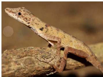
69 Anolis fuscoauratus ♀ (ILV) DACTYLOIDAE