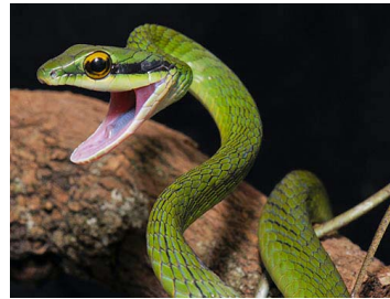
123 Leptophis occidentalis (LAR) COLUBRIDAE