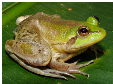
33 Pseudis paradoxa (FRR) HYLIDAE