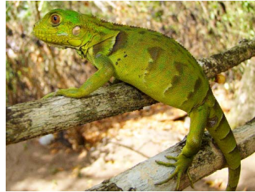
82 Iguana iguana (FRR) IGUANIDAE