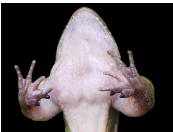
45 Leptodactylus insularum ♂ (FRR) LEPTODACTYLIDAE