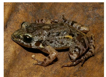
40 Adenomera sp. (SL) LEPTODACTYLIDAE