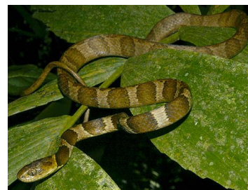
111 Dipsas praeornata (SL) COLUBRIDAE