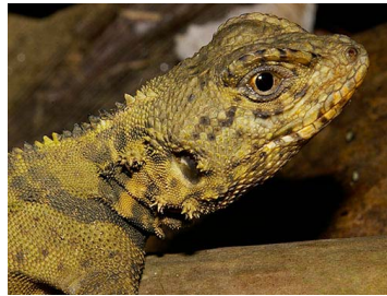
102 Plica caribeana (SL) TROPIDURIDAE