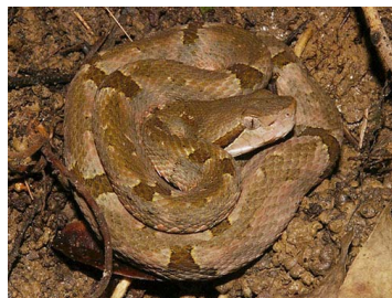
138 Bothrops venezuelensis (SL) VIPERIDAE