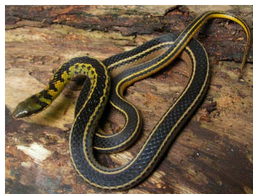
114 Erythrolamprus melanotus (FRR) COLUBRIDAE