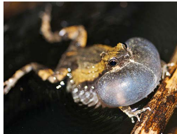
42 Engystomops pustulosus ♂ (JLV) LEPTODACTYLIDAE