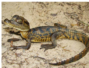
55 Caiman crocodilus (FRR) ALLIGATORIDAE