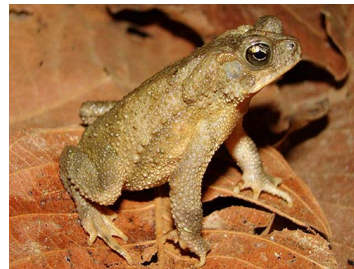
7 Rhinella sternosignata ♂ (FRR) BUFONIDAE