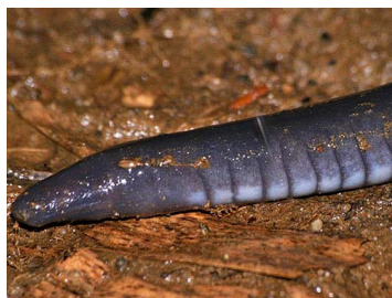
54 Caecilia tentaculata (AST) CAECILIIDAE