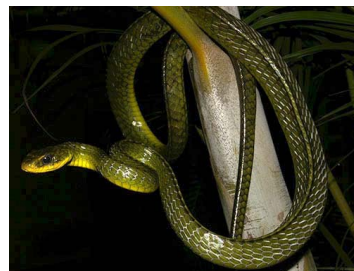
107 Chironius septentrionalis (SL) COLUBRIDAE