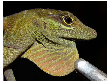
74 Anolis squamulatus ♂ (FRR) DACTYLOIDAE