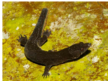
94 Pseudogonatodes manessi (SL) SPHAERODACTYLIDAE