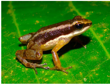
1 Allobates pittieri (FRR) AROMOBATIDAE

[fieldguides@fieldmuseum.org] [1077] versión 1 10/2018