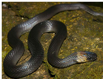
126 Ninia atrata (SL) COLUBRIDAE