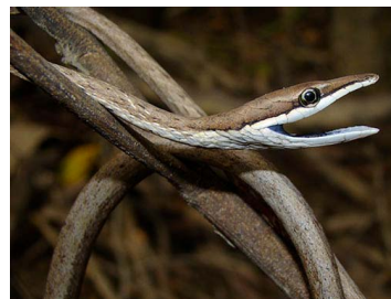
127 Oxybelis aeneus (FRR) COLUBRIDAE