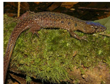
79 Oreosaurus achlyens (SL) GYMNOPHTHALMIDAE