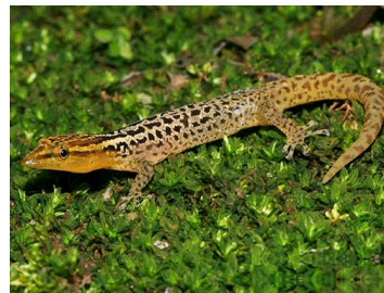
95 Sphaerodactylus molei (AST) SPHAERODACTYLIDAE