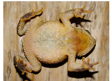
8 Rhinella sternosignata ♂ (FRR) BUFONIDAE