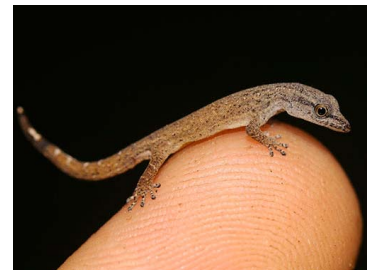
96 Sphaerodactylus molei (JLV) SPHAERODACTYLIDAE