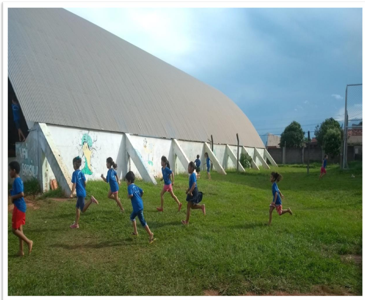
Figura 5: A quadra me espera