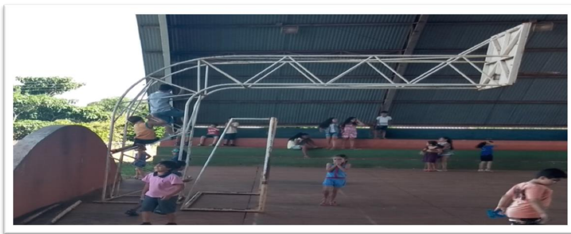
Figura 12: “O negócio da quadra”

Porque... (explicação) sabe aquele negócio do basquete? Tem aquele negócio lá, que se você subir lá... pode quebrar a cabeça e o braço. Vai que alguém vai lá, sobe lá em cima e morre!? A culpada é a diretora. (Entrevista com crianças, 2018).