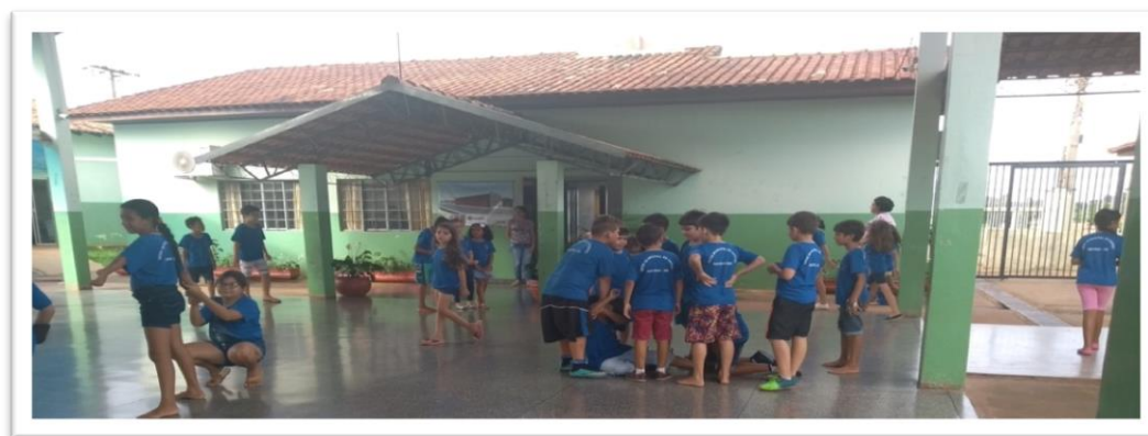
Figura 11: Vigilância

Essa presença do adulto no espaço, nos locais do recreio, pode ser explicada pelo fato de não ser atribuído às crianças a “oportunidade, necessidade, nem capacidade de ficar sós” (ELIAS, 1994, p. 108) – afirmações estas usadas pelos adultos, visto que têm interesse na ordem. Por isso, segundo Elias (1993), o controle das emoções pelo indivíduo é feito por meio da coação externa, do meio social em que o indivíduo vive. Ou seja, a falsa liberdade que as crianças detêm no intervalo do recreio é facilmente corrompida pela presença do adulto que, ainda estando no mesmo ambiente que a criança, ocupa outro meio – o do superior.