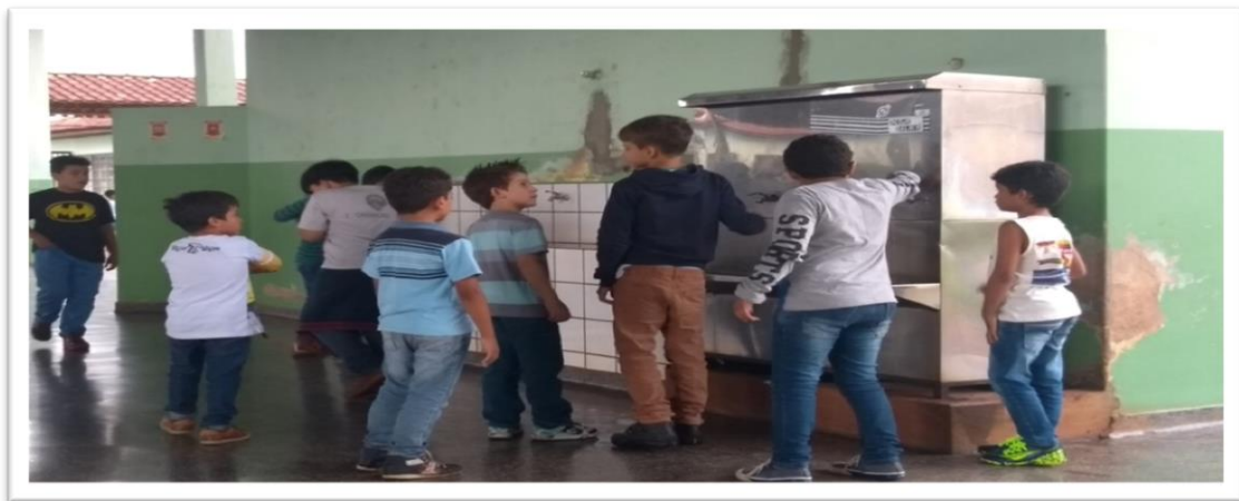
Figura 14: Água dos meninos

Nas Figuras 14 e 15 observamos a separação das meninas em relação aos meninos no momento do uso do bebedouro. Os bebedouros são dois e um ficam de frente para o outro, mas as crianças se organizam como se houvesse uma linha imaginária no meio do pátio dividindo os espaços, na primeira foto o local dominado pelos meninos.