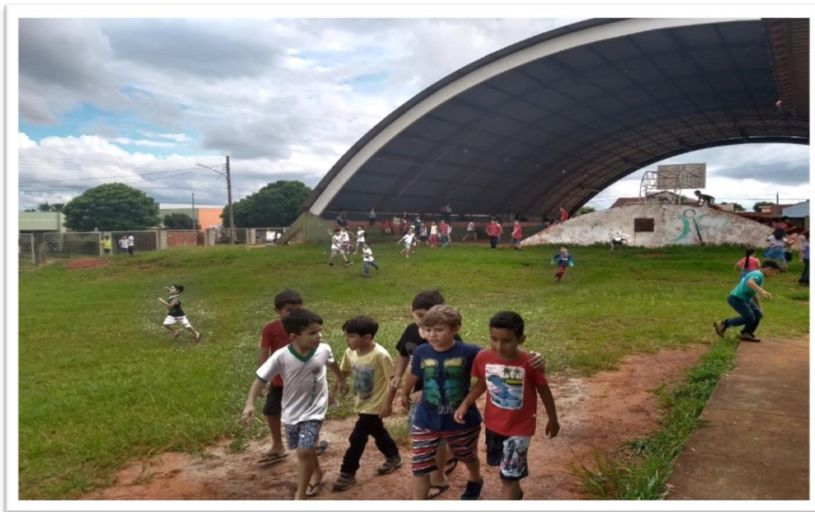
Figura 3: Gramado lateral