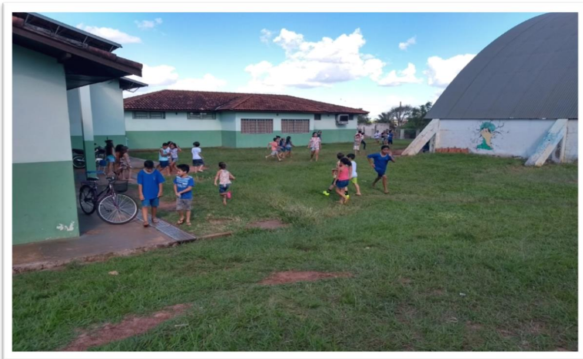
Figura 4: Gramado atrás da escola