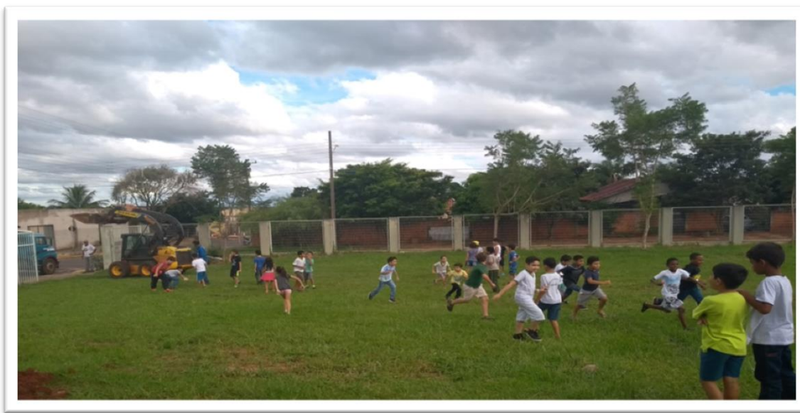
Figura 9: As brincadeiras