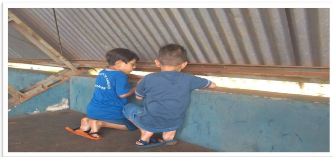
Figura 10: O imaginário da quadra

diferentes aspectos como: medo, alegria, movimentos, promove segurança e aconchego, como afirma Lima (1989)