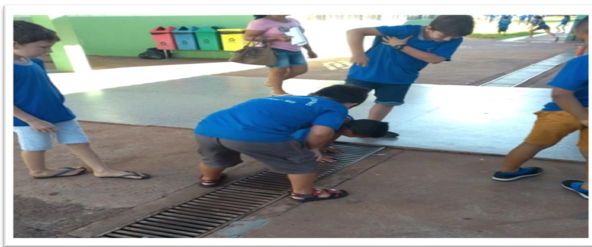
Figura 8: A curiosidade em meio à espontaneidade

Além disso, o que nos chama atenção é a curiosidade da criança em meio aos pequenos detalhes que, muitas vezes, passam despercebidos aos olhos dos adultos.