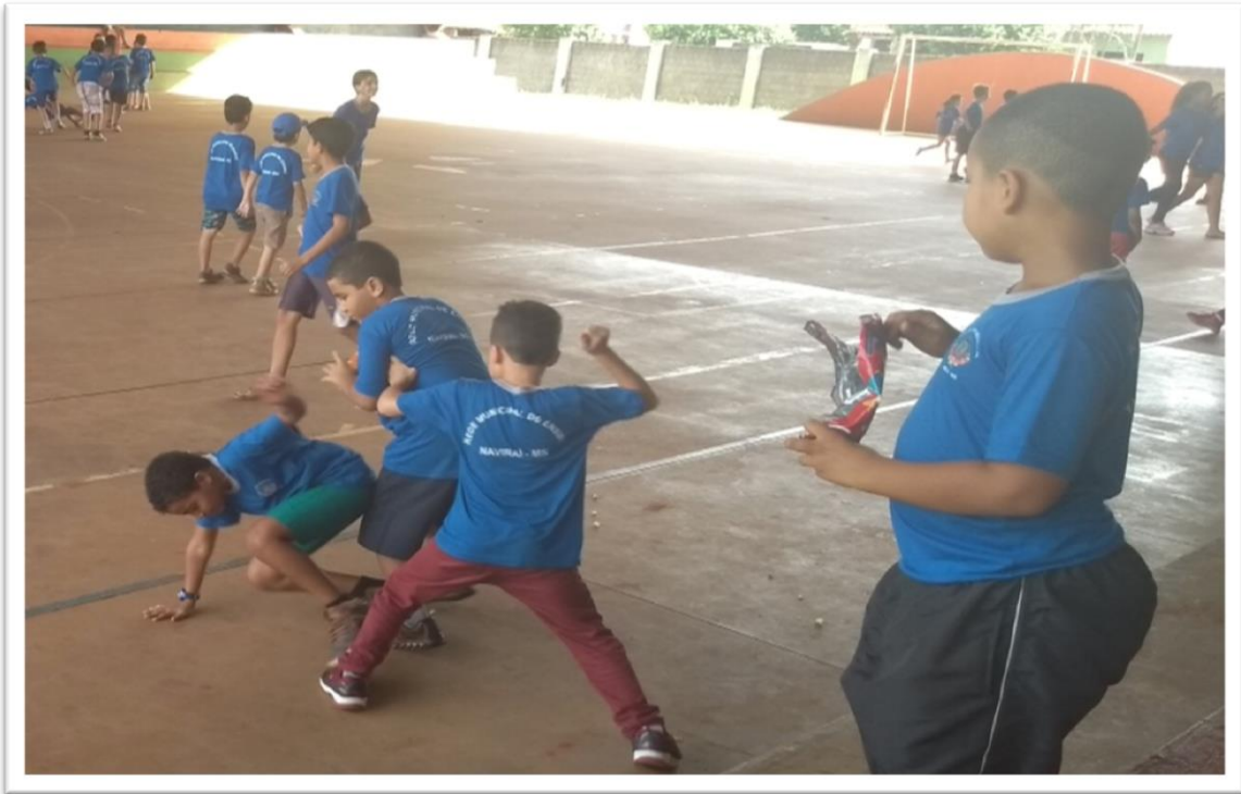
Figura 13: Brigas disfarçadas

março de 2018). Essa brincadeira tem o intuito de ser somente lúdica, mas a depender dos golpes desferidos vira uma briga na qual os adultos precisam interferir.