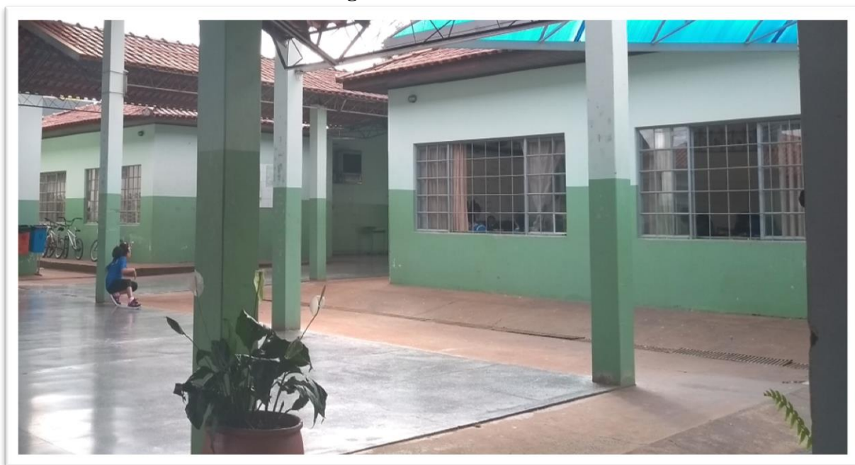
Figura 6: Conversa informal

Soa um sino para a entrada das crianças nas salas de aula, em seguida soa o segundo sino que marca a entrada da segunda aula, logo após soa o terceiro sinalizando a terceira aula e, em seguida, o quarto sino que é justamente o que indica o começo do recreio. Observamos também que a ansiedade pelo intervalo vai além das paredes da sala e a interação com os colegas, vai até o pátio com aqueles que antes já usufruem do momento do recreio.