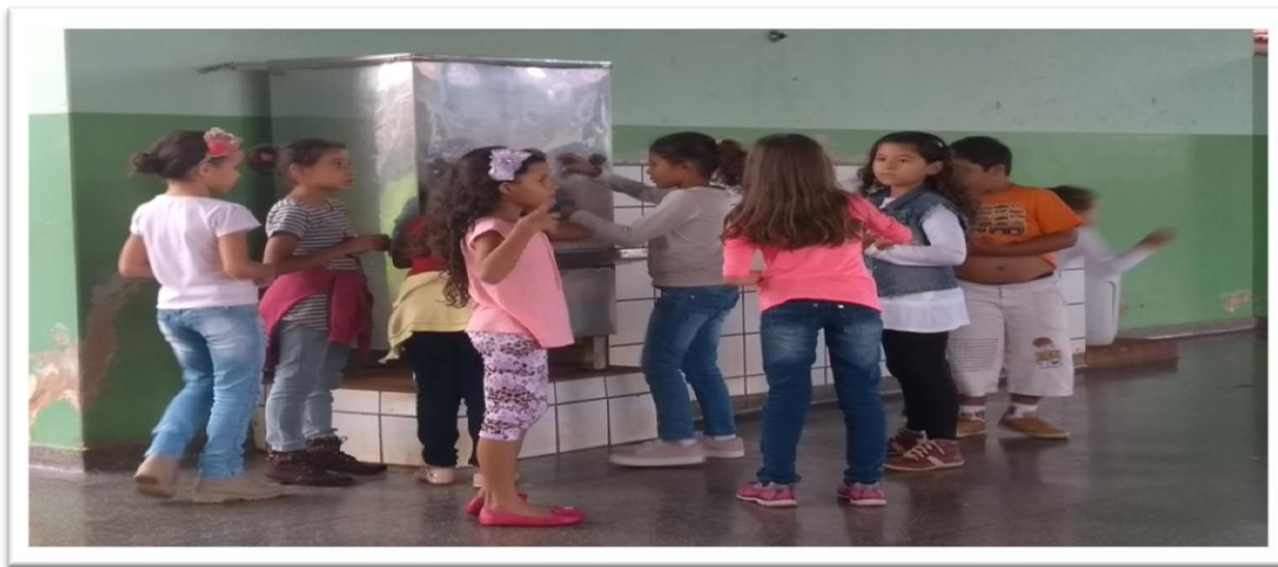
Figura 15: Água das meninas

Na segunda foto, a predominância das meninas, embora possam usar qualquer bebedouro indiscriminadamente.