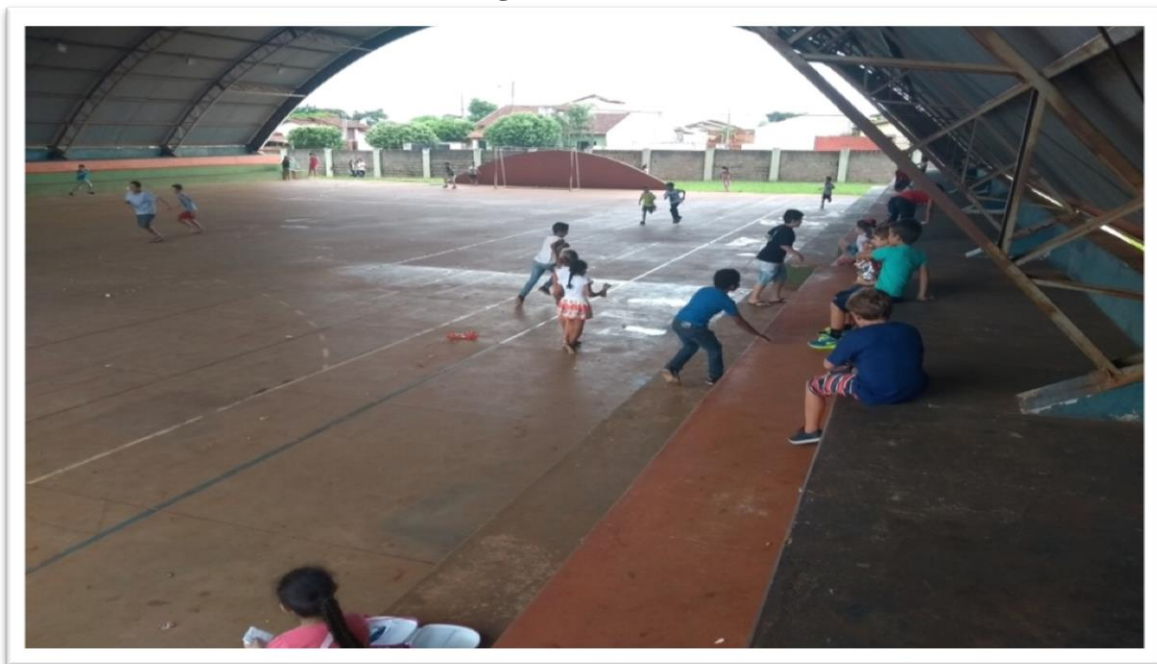
Figura 2: Quadra

A escola tem um gramado extenso, que as crianças utilizam para brincadeiras e atividades designadas pela escola. Esse gramado dá acesso à quadra e aos muros da escola, possibilitando assim uma boa movimentação das crianças. Também destacamos que a instituição possui duas quadras: uma atrás da cozinha e outra na lateral das salas, evidenciando que as duas são usadas pelas crianças. Assim, podemos visualizar esses espaços por meio das fotos, a seguir.