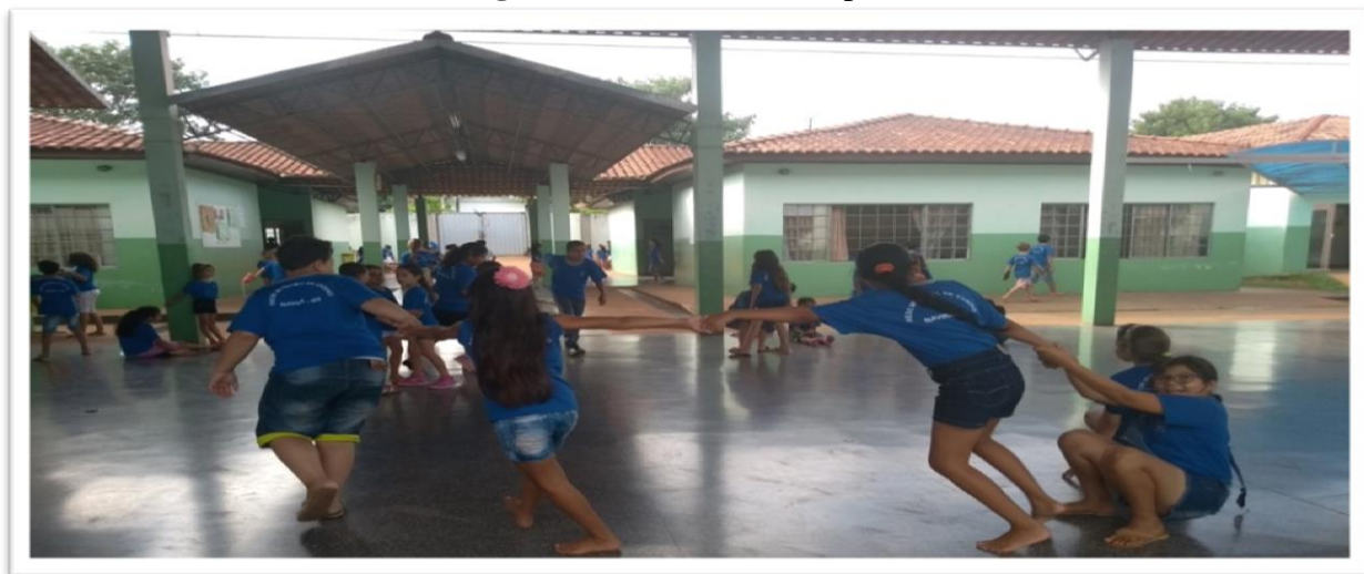
Figura 7: Brincadeiras no pátio

Essas sensações podem ser visualizadas na foto onde é possível quase “ouvir” os seus gritos, suas risadas e a alegria deste momento “legal”.