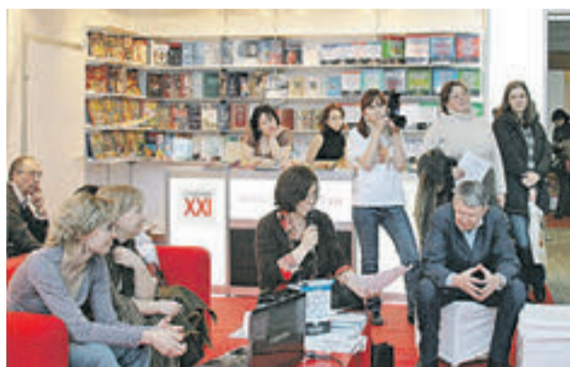
Традиционная выставка-ярмарка «Книги России» на ВВЦ

В есной на ВВЦ традиционно проводится Национальная выставка-ярмарка «Книги России». Ближайшая — семнадцатая по счету ярмарка — откроется уже совсем скоро, 26 марта. Она впервые пройдет в павильоне № 69, который расположен недалеко от главного входа ВВЦ. Здесь разместятся сотни экспозиций коллективных и индивидуальных участников смотра: представят художественную, научную, документальную, учебную, детскую литературу — всего более ста тысяч книг. 29 марта организаторы запланировали Детский день: юным любителям чтения