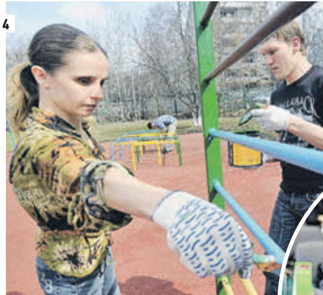
1 Работы по освещению Ярославского шоссе почти завершены — на зданиях вдоль этой магистрали установлено почти пять тысяч светильников 2–3 Спектакли «бродячих кукольников» ориентированы на детей и длятся не более 45 минут. Перед маленькими зрителями оживают знакомые сказки и звучат стихи — классические шедевры русской литературы 4–5 В этом году в Западном округе будет благоустроено почти три тысячи дворов. Кроме того, здесь создадут три пешеходные зоны 6 Мармелад уникален тем, что сохраняет все полезные свойства продуктов, из которых готовится