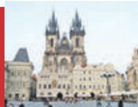
Вы сможете посетить одну из любимых нашими туристами стран — Австрию, побывать в столице Чехии — Праге или отдохнуть на курортном побережье Турции

партнерами, поэтому постоянно разрабатывает и предлагает им специальные акции. В марте стартовала акция «ПОДАРКИ ВСЕМ!!!». Каждый инвестор компании, заключивший новый договор, сможет получить приятный презент — бытовую технику и энергосберегающие комплекты. Все желающие могут убедиться в том, как удобно использовать в повседневной жизни новые достижения энергосбережения. Особым условием новой акции «ПОДАРКИ ВСЕМ!!!» является возможность отправиться в путешествие в Европу. Для этого надо выбрать интересующую вас инвестиционную программу и заключить по ней договор. Таким образом, отдыхать и увеличивать свой капитал, становиться вполне возможно. Срок действия акции ограничен — акция «ПОДАРКИ ВСЕМ!!!» проводится в компании до 31 марта 2014 года. Компания «Энергопроект» предлагает программы с различными по