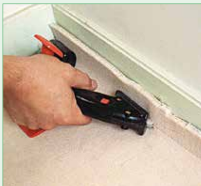
Ajuste de la inclinación

Ideal para enrasar perfectamente y de forma rápida sin gramilado todo tipo de revestimientos de suelo. Ajuste de la salida y de la inclinación de la cuchilla con dos botones de rueda. Enrasado en los dos sentidos para una unión de corte perfecta. Portacuchilla de metal. Utiliza cuchillas 92416 o 692416 .