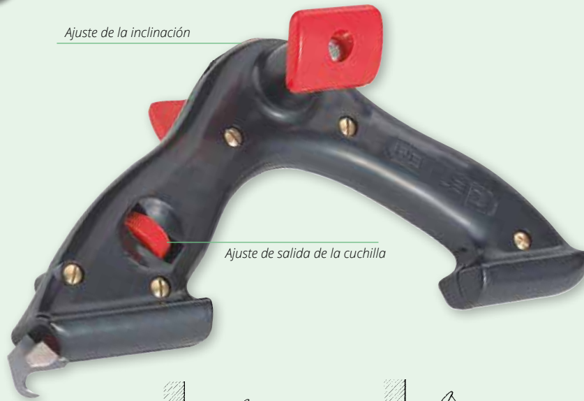
Ajuste de salida de la cuchilla