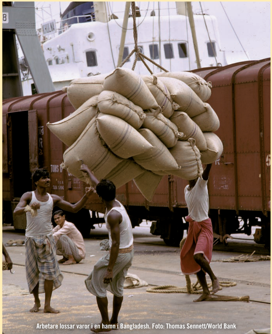
Arbetare lossar varor i en hamn i Bangladesh.

Den organisation som har störst betydelse för den globala handeln är världshandelsorganisationen WTO ( World Trade Organization ), som bildades 1995. WTO saknar formell status som fackorgan i FN-systemet men har ett nära samarbete med FN. 153 länder har frivilligt anslutit sig till denna världsomspännande institution, och ytterligare 29 har ansökt om medlemskap. Det innebär att enbart en handfull länder frivilligt står utanför WTO, som via sitt globala inflytande sätter ramarna för hur handeln mellan världens länder ska se ut.