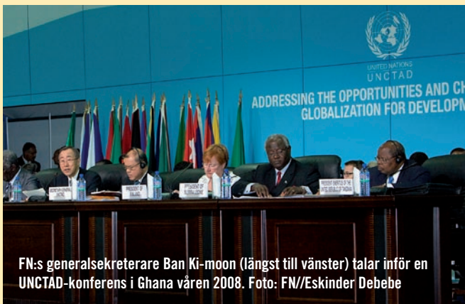
FN:s generalsekreterare Ban Ki-moon (längst till vänster) talar inför en UNCTAD-konferens i Ghana våren 2008.

under ECOSOC, FN:s ekonomiska och sociala råd. I praktiken är de båda så kallade Bretton Woods-tvillingarna självständiga institutioner, och lyder exempelvis inte under FN:s generalförsamling.