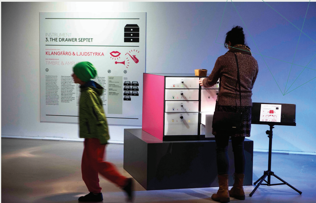
The Drawer Septet är en sjungande byrå.