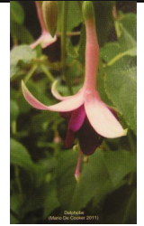
SMÅ DOB- BELTE KORT. 10 stk. 9 kr.