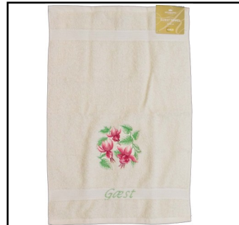
GÆSTEHÅNDKLEDE Model B - beige 110 kr. 40 cm. x 60 cm.