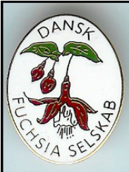
EMBLEM 30 kr.