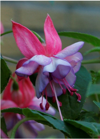
Martin's Double Delicate

Med hensyn til navngivning valgte han derfor en sammensætning af de første dele af de videnskabelige navne. Andre eksempler er kultivarer: 'Cinandrei', 'Cinpetio', 'Cinvenu' og 'Cinevulca'. Han krydsede henholdsvis F. cinerea med henholdsvis F. andrei , F. petiolaris , F. venusta og F. vulcanica .