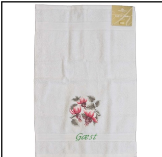
GÆSTEHÅNDKLEDE Model A - hvid 110 kr. 40 cm. x 60 cm.