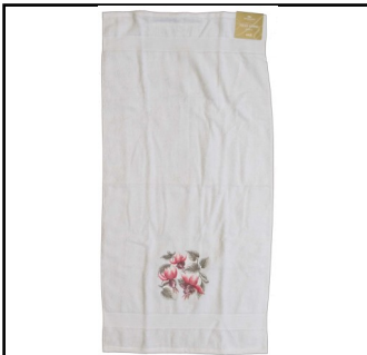
Håndklæde 175 kr. 50 cm. x 100 cm.