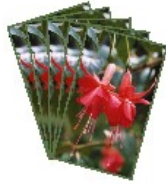
POSTKORT med kuverter 5 stk. 35 kr.