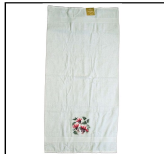
Badehåndklæde 235 kr. 70 cm. x 140 cm.