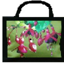
TASKE MED FUCHSIA MOTIV 85 kr.