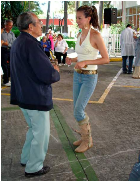
Alumna de Medicina en un Centro Gerontológico

En los centros gerontológicos del instituto, albergues, residencias de día, centros culturales, clínicas de la memoria y centro de atención integral, se otorga atención integral (biopsicosocial) y se fomenta en ellos la convivencia multigeneracional, orientando a la familia y a las amistades de las personas mayores para una buena relación y para involucrarlos en el proceso de envejecimiento y los cambios que se presentan en la vejez, con el objetivo de comprender a los mayores y prepararse para su propio envejecimiento.