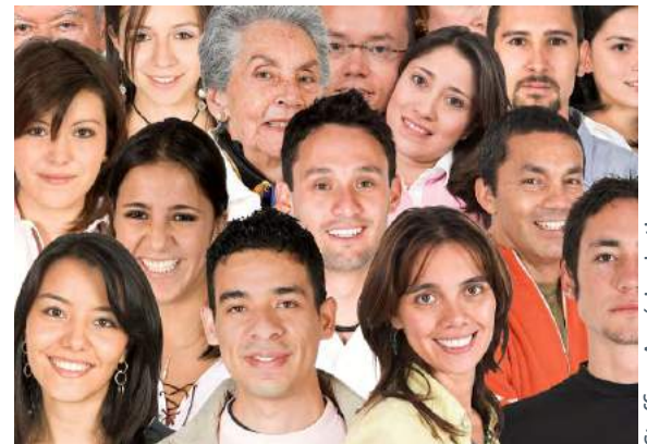
Staffing América Latina

El análisis realizado ha permitido constatar que existen más similitudes que diferencias entre las generaciones. Todas ellas