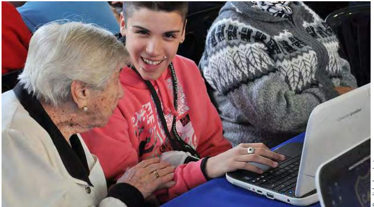
Realidad en Letras

Es la base del proyecto “Genera”, una iniciativa sin precedentes