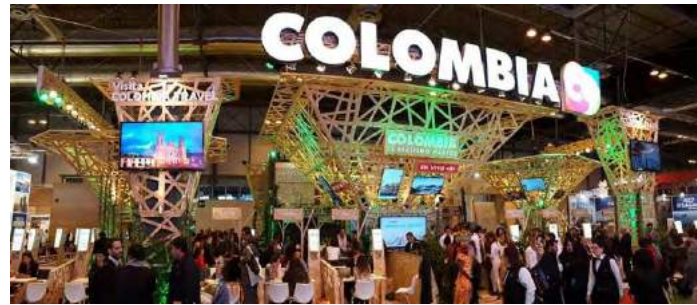
Colombia gana el premio al mejor stand de Fitur 2017.

La Conferencia ha tratado la nueva demanda de turismo; el Transporte: conectividad aérea y política de cielos abiertos; el