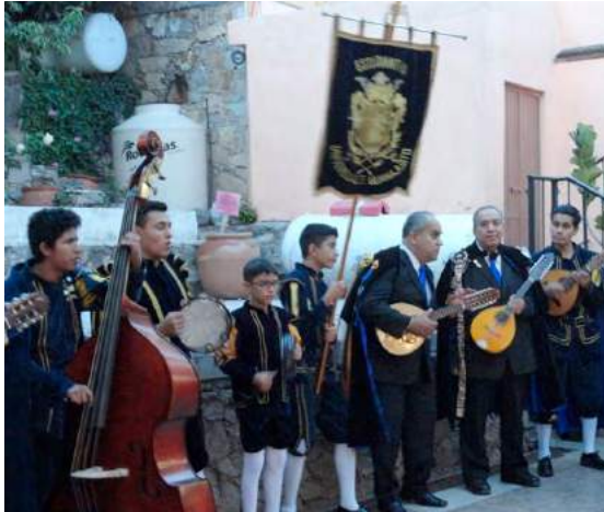
Albergue INAPAM. Estudiantina Universidad Guanajuato