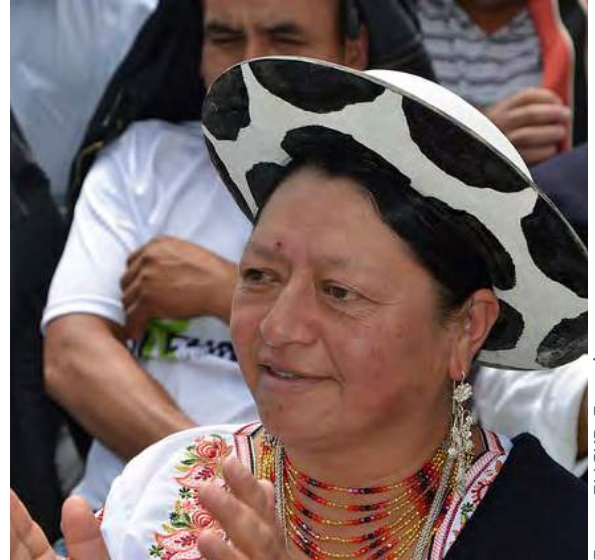
Ecuador