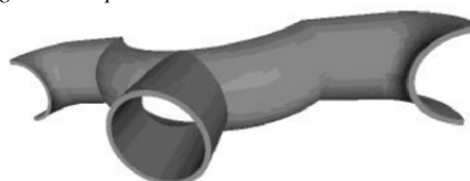
Ver Fascículo Completo