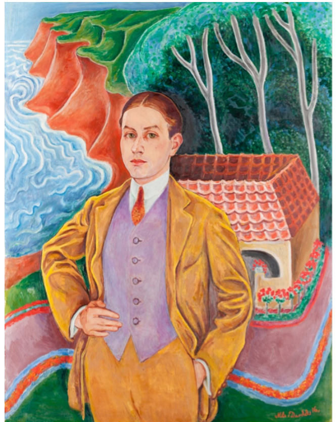
Rolf de Maré porträtterad av Nils von Dardel 1914.

Att samla på vapen under Wilhelminas tid var en statussymbol. Vad är det status att samla på idag och ser ni några könsmönster i det samlade? Till exempel, att samla på sneakers vs. att samla på designerväskor? Kan ni hitta några likheter med dagens tänk/trender med hur man såg på samlande i Wilhelminas tid?