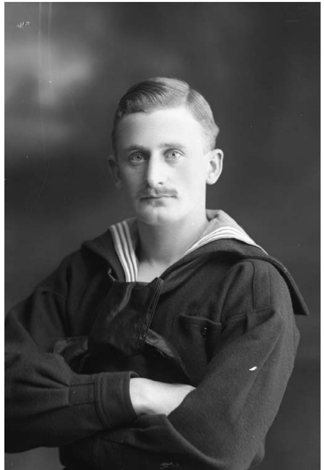
Flottist. Skeppsholmen, 1912.

Under sent 1800-tal var Stockholm en stad med bristande infrastruktur, där det bland annat fanns gytjtjuga parker med sparsam belysning. Det är just i mörkret som det försiggick aktiviteter som utmanade samhällets normer. För stadens manliga homosexuella var mörka parker en plats där de kunde mötas. I Stockholm möttes homosexuella bland annat vid