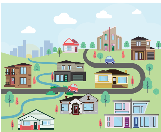
Τοπίο και θέα