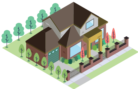
Βλάστηση (κήποι, δέντρα και φυτά)