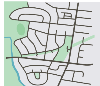
Διάταξη οδών (το μοτίβο των δρόμων και των οικοπέδων)