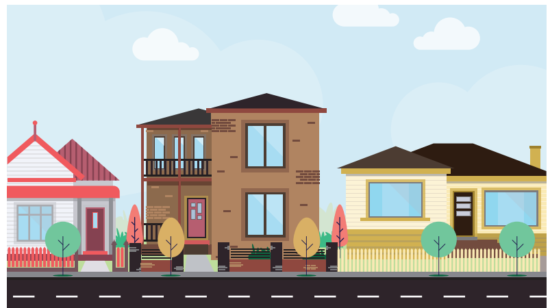
Δρόμοι (η εικόνα των οδών και των δρόμων)

Είναι σημαντικό για μας να κατανοήσουμε τι θεωρεί σημαντικό η κοινότητα όσον αφορά τις γειτονιές και πώς θα ήθελε να μοιάζουν στο μέλλον.