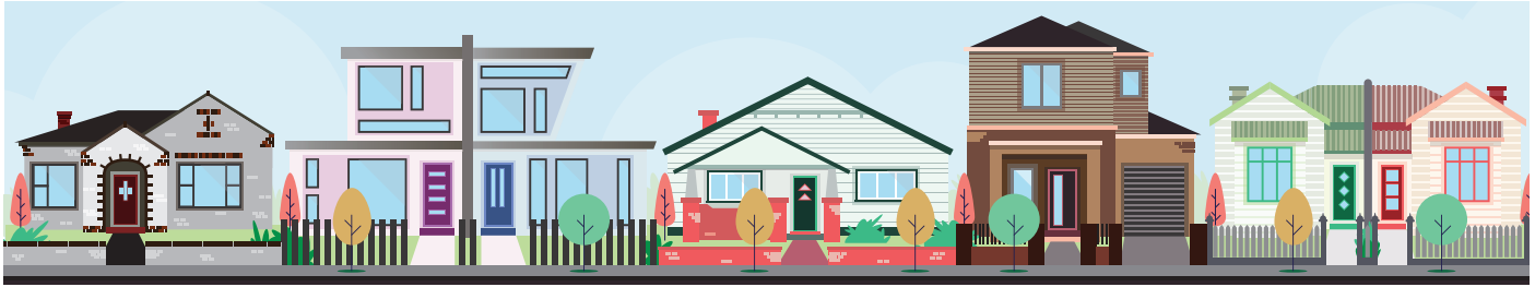
Δομική μορφή (η εικόνα των κτιρίων και των σπιτιών)

Δημιουργείται από το συνδυασμό στοιχείων και τον τρόπο που αλληλοσυνδέονται αυτά τα στοιχεία. Αυτά τα στοιχεία περιλαμβάνουν: