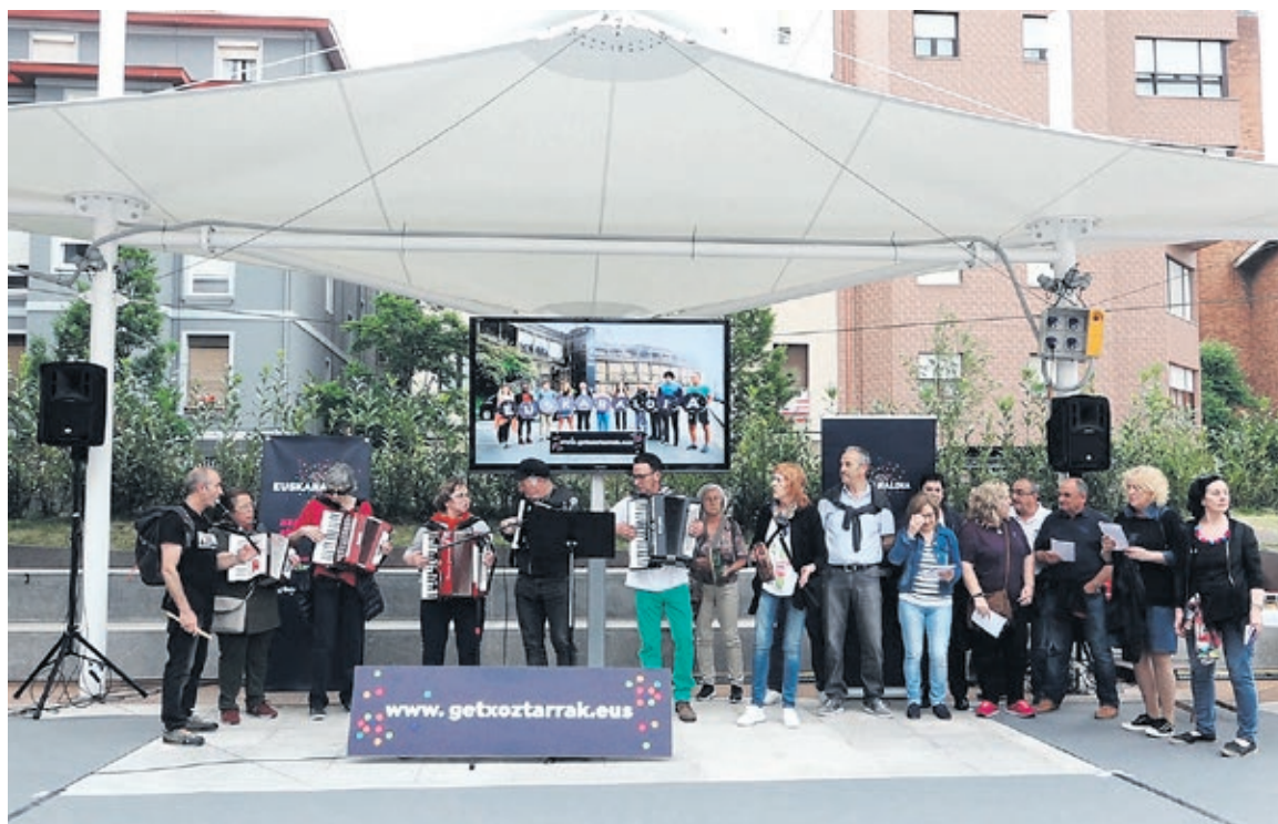
Izena emateko orduan rola aukeratu beharko dute parte-hartzaileek. HODEI TORRES

E uskaltzaleak aktibatu eta hizkuntza-ohiturak aldatzea da Euskaraldia ekimenaren helburua. Euskal Herriko hainbat elkarterek urteetan landutako «Euskarak 365 egun» lan-ildoaren barruan dago, eta mugari bi ditu: euskal hiztunen aktibazioa eta euskararen erabilera babesteko eta bul-tzatzeko neurriak hartzea. Horretarako, 11 egun euskaraz saioa egingo dute 2018ko azaroaren 23tik abenduaren 3ra. Egun horietan denetan, 16 urtetik gorako herritarrek Ahobizi eta Belarriprest rola hartu ahal izango dituzte. Ahobizi izango dira ulertzen duten denei euskaraz berba egiten dieten lagunak. Belarriprest, aldiz, gutxienez euskaraz ulertzen duten kideak, gainontzekoei euskaraz jarduteko gonbidapena egiten dietenak, alegia. Getxon, gainera, hirugarren rol bat izango dute aukeran: Iribizi. Euskara ulertu ez baina horren alde egiten dutenek hartuko dute paper hori.