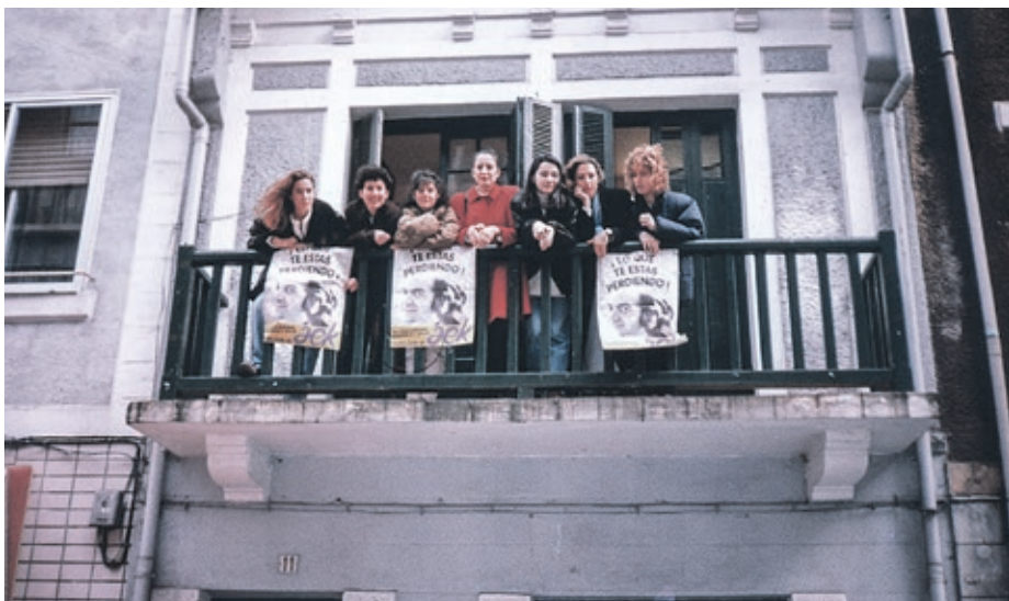
Areetako eta Itzubaltzetako euskaldun askok Ganbaran ikasi zuten euskara. AEK