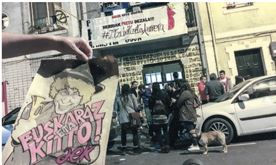
Dozenaka pertsonak bisitatu zuten Ganbara 2017ko apirilaren 22ko okupazioan.

Hogei urte igaro dira Ganbara euskaltegiaren atea estreinakoz zabaldu zirenetik. Itzubaltzeta/Romo eta Areetako milaka herritarren artean euskara sustatu ostean itxi zen 2002an. Gaur egun, zulo bat dago bertan.