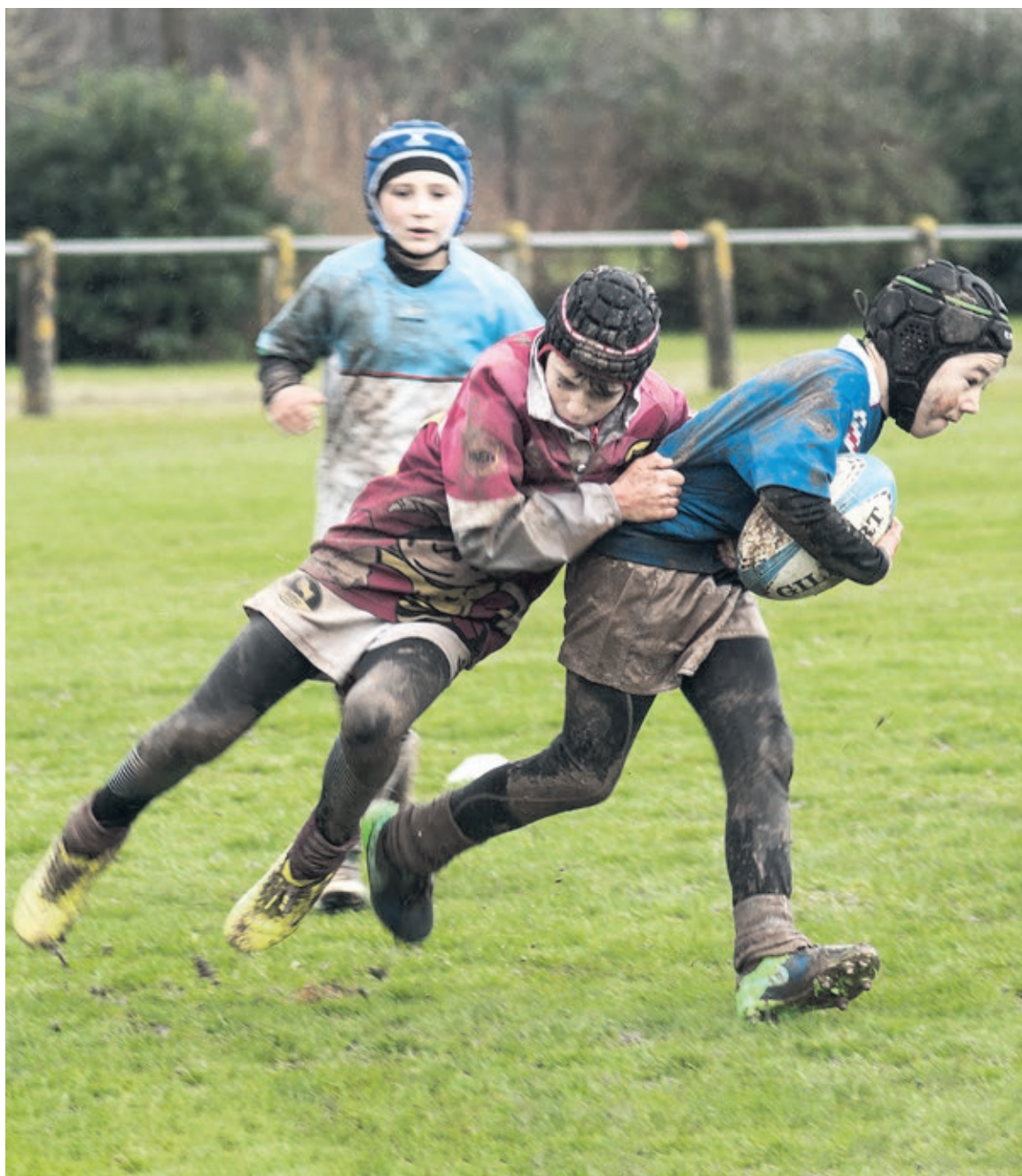
Baiona eta Getxoko taldeen artean konplizitatea sortu da.