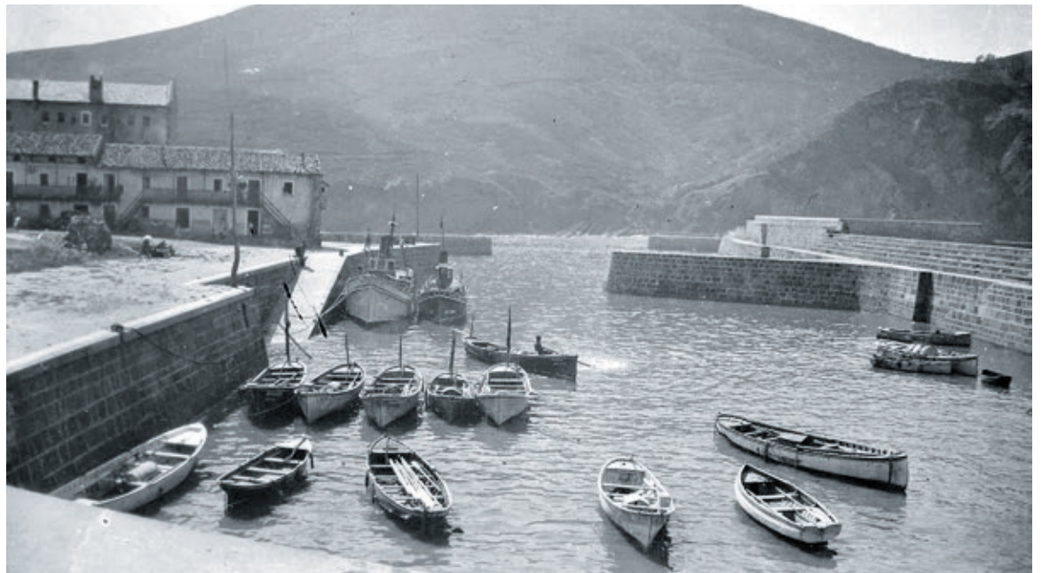
Aspaldi arrantzale txiki ugari zegoen Armintzako portuan, baita Amorruga ibaian ere.

BASERRITIK MUNDURA IKASTAROA. Aipatutako lanak Arrantzaren bilakaera Lemoizen ; Armintzako portutik Andraga gainera du izena eta Baserritik Mundura: Gure Elikaduraren Etorkizuna ikastaroaren edizioaren barruko lana da. Ikastaro hori