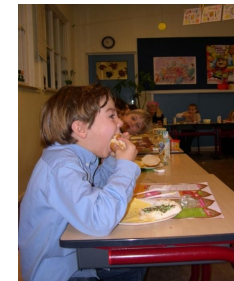
Actiedag gezonde voeding