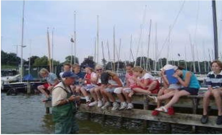
introductie zeilen groep 7