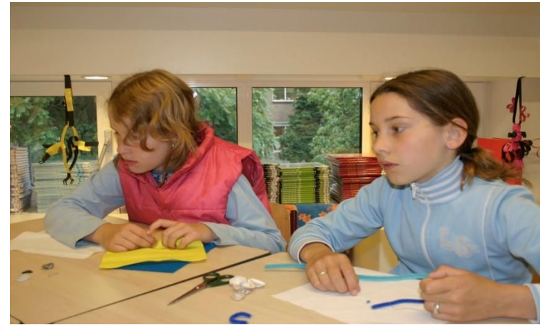
Knutselen in de bovenbouw

De Hoeksteen probeert een onderwijsleersituatie te scheppen die het mogelijk maakt een continue ontwikkelingsproces, op alle aspecten van de ontwikkeling, bij kinderen te bewerkstelligen. Deze aspecten betreffen de verstandelijke, sociale, emotionele, motorische en creatieve-ontwikkeling. In een sfeer van vertrouwen willen we kinderen in aanraking brengen met diverse samenlevingsvormen en deze bespreekbaar maken, zodat kinderen leren dat deze verschillen tussen mensen verrijkend kunnen zijn.