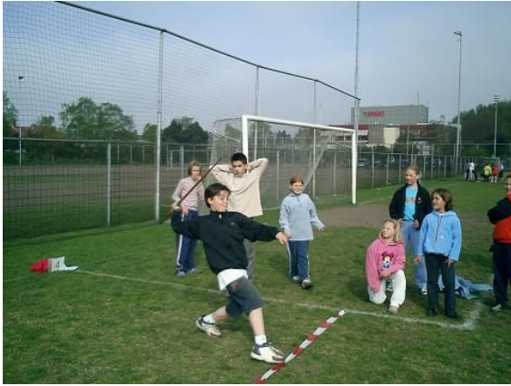
Sportdag, één van de activiteiten waarbij de Ouderraad een grote rol speelt