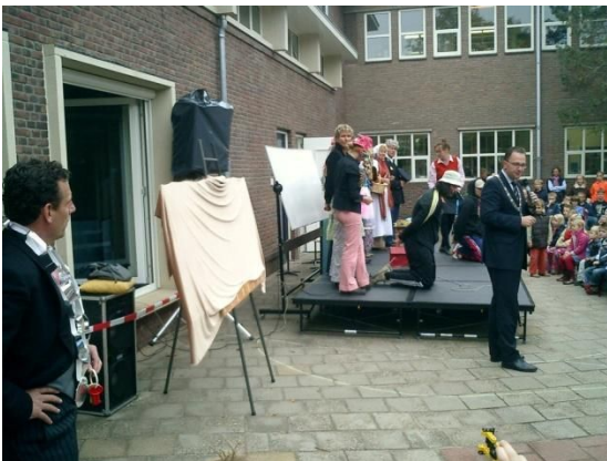
Onthulling van ons nieuwe logo door burgemeester van Bussum

De resultaten van de toetsen worden getoond in grafieken en tabellen. Deze vormen voor de leerkrachten een goede basis om hun leerlingen te volgen en het onderwijs desgewenst aan te passen. Voor de directie vormt dit een goed instrument om de kwaliteit van het onderwijs te bewaken. Behalve de toetsen geeft de observatie door de leerkracht waardevolle informatie over inschatting van vorderingen van leerlingen en over de sociaal-emotionele ontwikkeling. De leerkracht spreekt alle gegevens door met de interne begeleider. Van elk kind wordt een dossier gemaakt en bijgehouden.