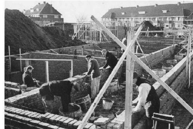
Bouw van de Hoeksteen (1950-1951)

"De Hoeksteen" handhaaft zich naar de huidige maatstaven uitermate goed. Steeds meer is de school een buurtfunctie gaan vervullen,