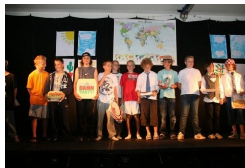
De afscheidsmusical van groep 8

Kijk op onze website voor de actuele jaarkalender