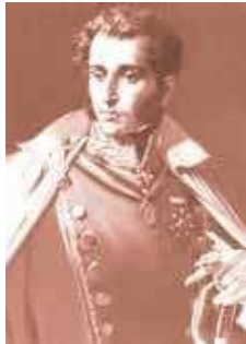
Antonio José de Sucre

Antonio José de Sucre en su apoyo a Bolívar en la Independencia de la Gran Colombia tomó Guayaquil, donde fue derrotado en la batalla de Huachi, luego junto a Sucre derrotaron al realista Aymerich en las faldas del volcán Pichincha.