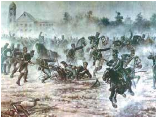
Batalla de San Lorenzo, Argentina 1816.

Sin embargo, existía un obstáculo o peligro latente: el Virreinato del Perú y el poderoso centralismo español existente, junto al bien organizado ejército realista que poseía. Entonces, así entendemos por qué los comerciantes criollos argentinos financiaron la campaña libertadora del sur: el fin era independizar el Perú.