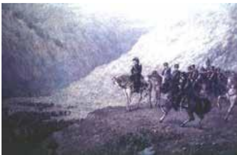
San Martín y el Ejército de los Andes