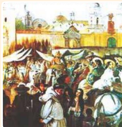
Lima a inicios del Siglo XIX

El acuerdo de Punchauca fue rechazado por el Ejército español, que se había hecho fuerte en el puerto de El Callao; José de la Serna se encontraba muy debilitado y al carecer de capacidad negociadora no pudo impedir la entrada de San Martín en Lima en julio de 1821.