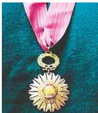
Medalla de la orden del Sol

Distintivo por el cual se repetaba todos los bienes de los criollos.