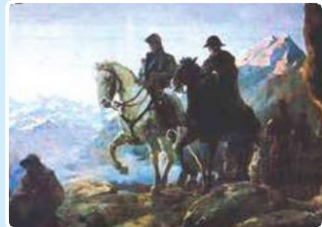
O'Higgins y San Martín

(José Agustín de la Puente C. Historia del Perú Tomo VI, pág. 281)