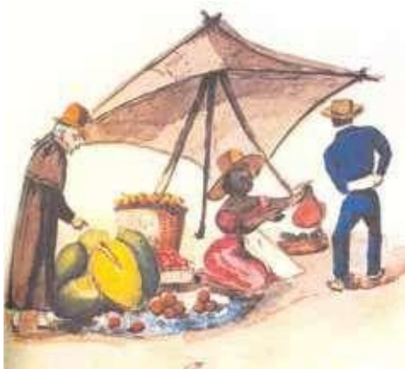
Esclavos negros en Lima, primeros años del siglo XIX. Acuarela de Pancho Fierro.

La Serna decidió evacuar Lima. En su retirada el ejército realista fue dividido por el Virrey en tres unidades. Una de ellas quedó dentro de los castillos del Callao bajo el mando del general criollo José de La Mar, quien después sería presidente del Perú. Las otras dos marcharon hacia la Sierra.