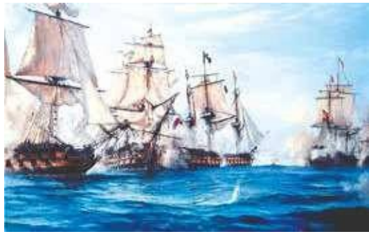
Flota Marítima Patriota