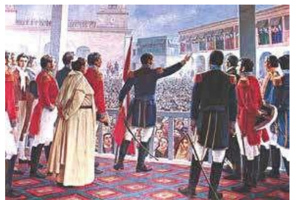
28 de julio de 1821

Quince días después de su ingreso a Lima, San Martín hizo proclamar la Independencia del Perú el 28 de julio de 1821, con un juramento donde reunió lo que para él eran las tres fuentes y principios de todo poder político: el pueblo, la justicia natural y Dios: “El Perú es desde este momento libre e independiente por la voluntad general de los pueblos y por la justicia de su causa que Dios defiende”.