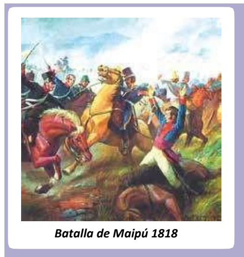
Batalla de Maipú 1818

Además de tocar nuevamente el Callao, desembarcó en Pisco y luego viró hacia el Norte hasta Santa y Guayaquil.