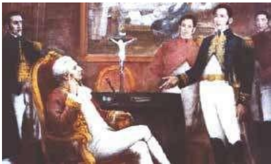
Don José de La Serna, último representante de la Monarquía Española en el Perú. Conferenció con el General San Martín en la Hacienda de Punchauca, en 1821.