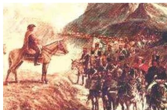
El Paso de los Andes

Los españoles no se resignaron a la derrota de Chacabuco. El virrey del Perú envió una expedición al mando de Osorio, que desembarcó con 2 600 hombres. Por un golpe de sorpresa los españoles consiguieron una victoria limitada en Cancha Rayada (marzo 1818), pero al poco tiempo fueron derrotados completamente por San Martín en Maipú (abril, 1818). La libertad de Chile estaba ganada. Había sido una guerra relámpago de casi un año.