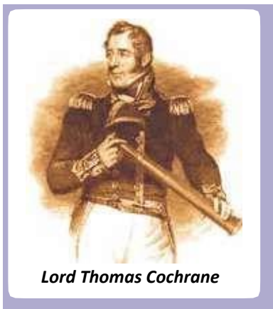
Lord Thomas Cochrane

Los mayores aportes vinieron de la empresa privada: un grupo de comerciantes que vio la oportunidad de hacer un buen negocio con la expedición dándole materiales a precios elevados (un promedio de 60 pesos por cada hombre). Además de sus ganancias directas, los comerciantes consiguieron la promesa de poder introducir 500 toneladas de mercadería en el Perú.