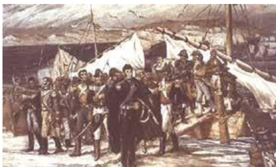
Desembarco Patriota en Pisco

De los 4 000 soldados de la expedición, más de la mitad eran argentinos y el 43% chilenos. El arma más numerosa era la infantería. Estos soldados desembarcaron en la bahía de Paracas después de dos semanas de navegación (8 de setiembre). Hubo, a los pocos días, conversaciones en Miraflores (25 de setiembre) entre representantes de San Martín y el Virrey, pero fracasaron esos intentos de paz.