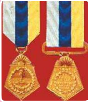
Medallas otorgadas al triunfo de Chacabuco

acercaban los hombres de Soler. Cuando San Martín llegó al campo de la lucha la batalla estaba decidida. Las pérdidas realistas fueron de 500 muertos, 600 prisioneros (incluyendo 32 oficiales), 2 piezas de artillería y 3 banderas. Los patriotas tuvieron 12 muertos y 120 heridos.