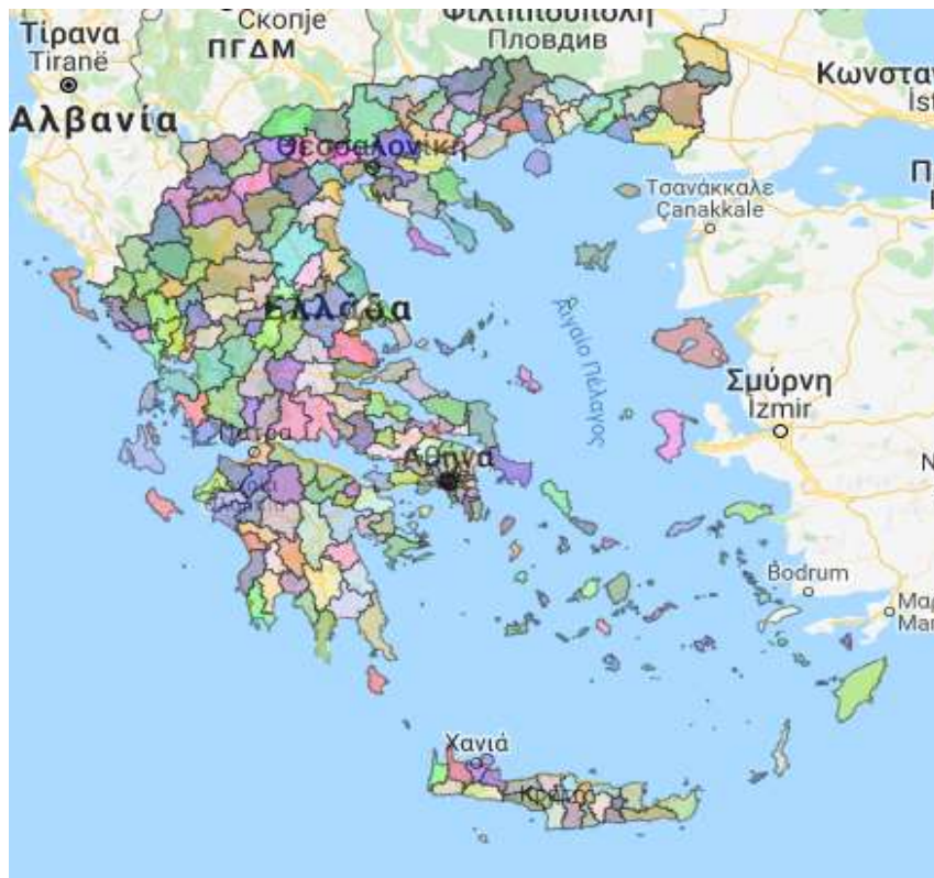
Χάρτης 3.1. Οι Δήμοι της Ελλάδας [Πηγή: 18].

Το σχέδιο περιλαμβάνει και την κατάτμηση των μεγάλων εκλογικών περιφερειών, την διενέργεια τοπικών ψηφισμάτων αλλά και την αποσύνδεση των αυτοδιοικητικών εκλογών από τις ευρωεκλογές. Επιπλέον δημιουργείται η δυνατότητα ίδρυσης εταιρειών ειδικού σκοπού στον τομέα της Κοινής Ωφέλειας. Επίσης, με το σχέδιο αυτό, καταργείται η εποπτεία των ΟΤΑ από τις Αποκεντρωμένες Διοικήσεις, όμως αντικαθίσταται από την σύσταση μόνιμης Επιτροπής Ελέγχου Αρμοδιοτήτων με τη συμμετοχή της Τοπικής Αυτοδιοίκησης η οποία θα εξετάζει και θα γνωμοδοτεί επί των επιδράσεων των σχεδίων νόμου που κατατίθενται στη Βουλή στο πεδίο των αρμοδιοτήτων της κεντρικής διοίκησης και των δύο βαθμών Αυτοδιοίκησης, αλλά αφαιρούνται από τα Δημοτικά τέλη το "πράσινο". Τέλος, οι μεταναστευτικές κοινότητες θα αντιπροσωπεύονται στα δημοτικά συμβούλια, κάτι που είχε ψηφιστεί το 2010 με τον Καλλικράτη αλλά ενεργοποιείται με τον παρόντα νόμο.