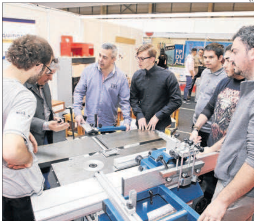
Un dels estands a l'última edició de la fira que impulsa la Formació Professional a Lleida.