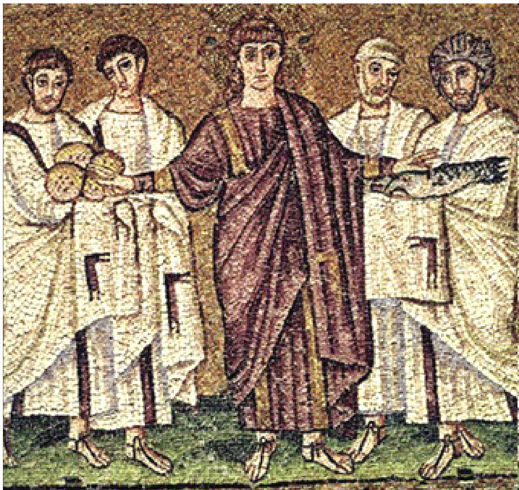
Zázračné rozmnožení chleba a ryb (kolem 504), mozaika z kostela Sant' Apollinare Nuovo