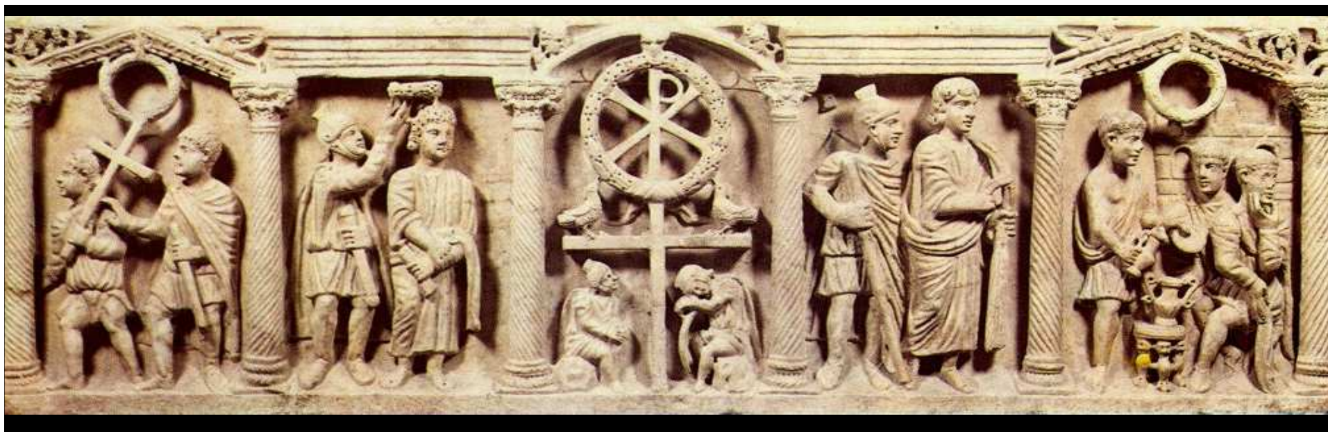
Domitilin sarkofág z Domitilíných katakomb (polovina 4. století)