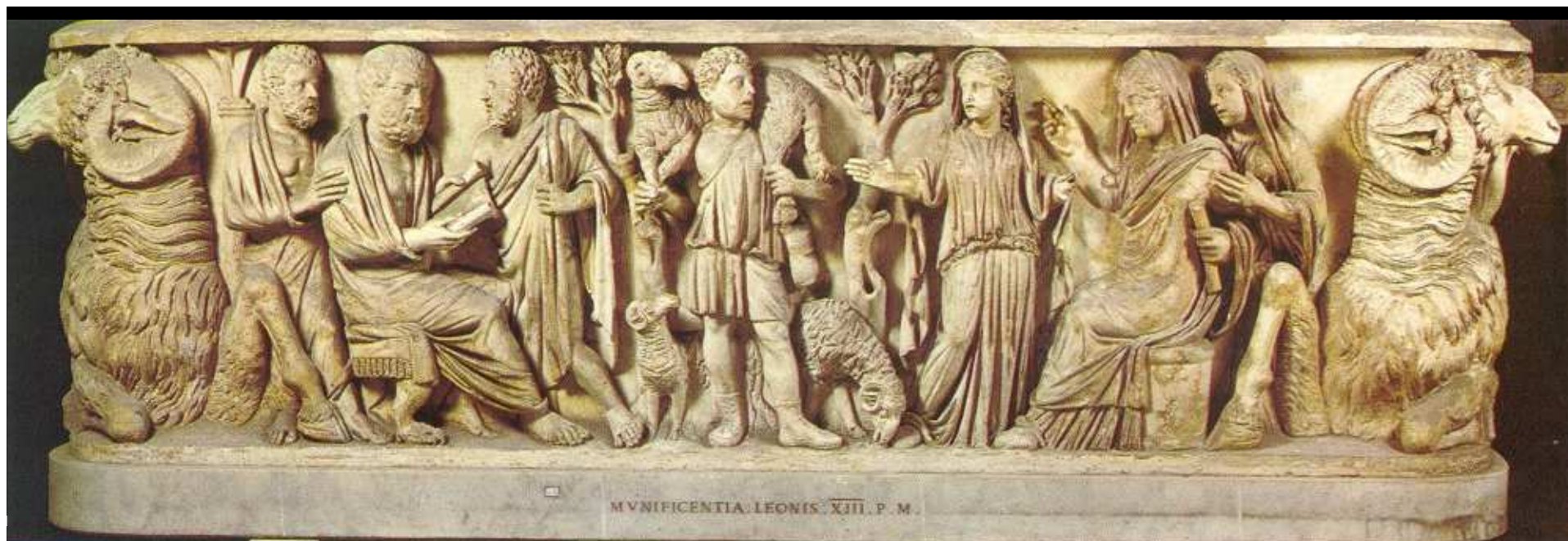
Sarkofág z Via Salaria (polovina 3. století), uprostřed dobrý pastýř