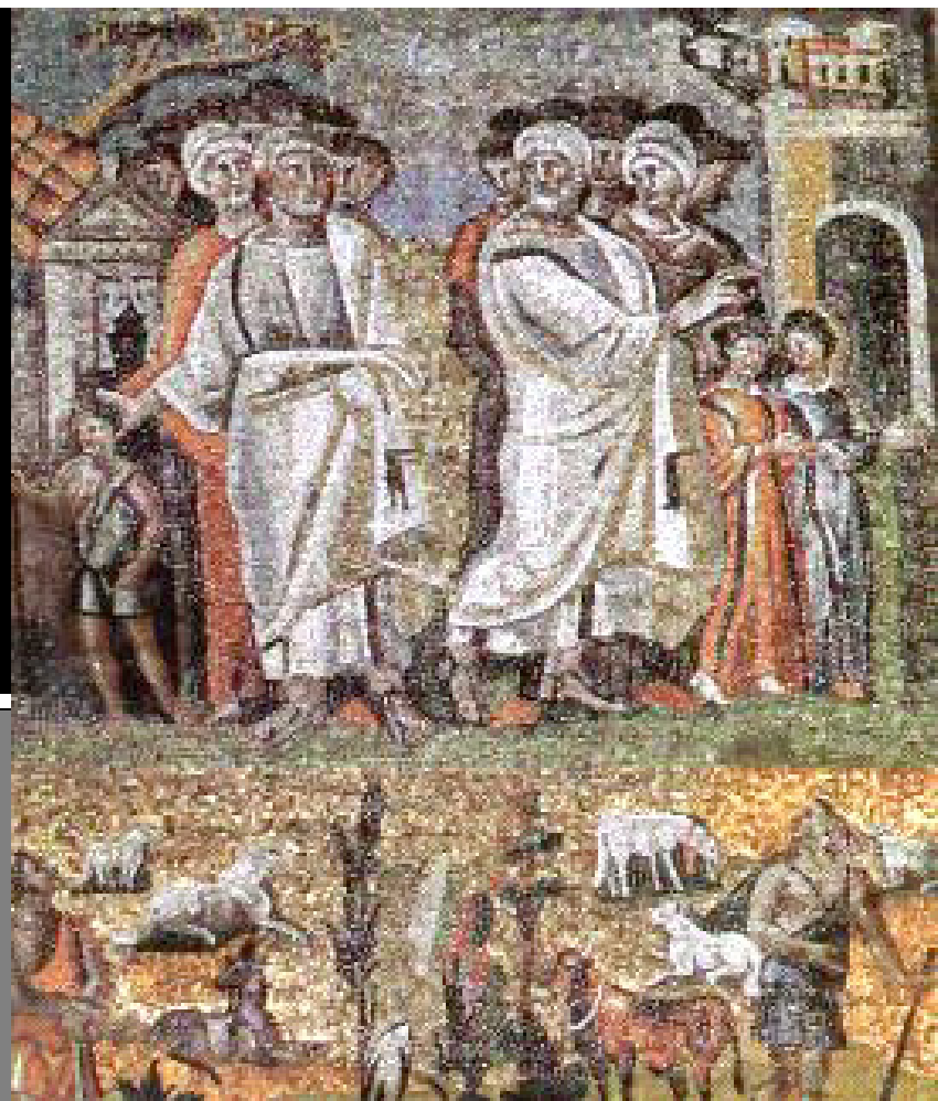
Lot a Abrahám (kolem 440), Santa Maria Maggiore, Řím