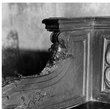
Détail d'un des angelots.