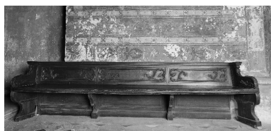
Vue d'ensemble, de face. IVR22_19966003723P