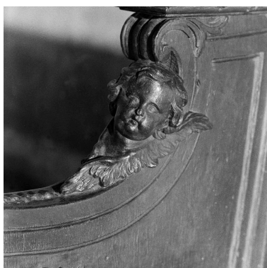
Vue rapprochée d'un des angelots.