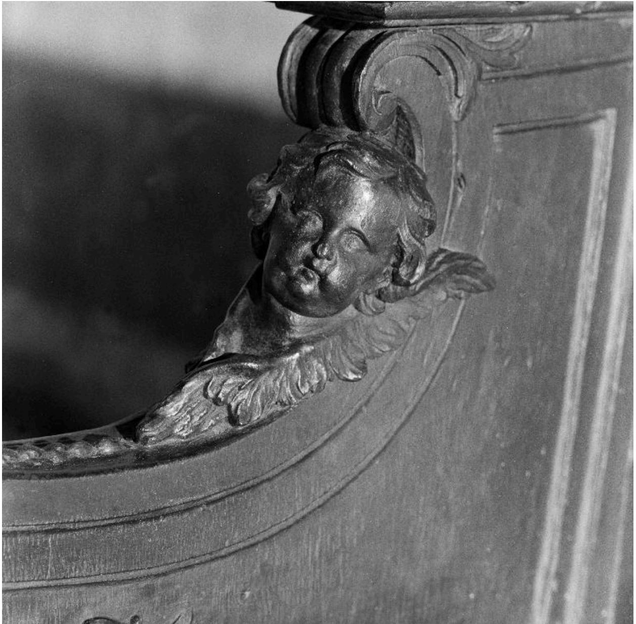
Vue rapprochée d'un des angelots.