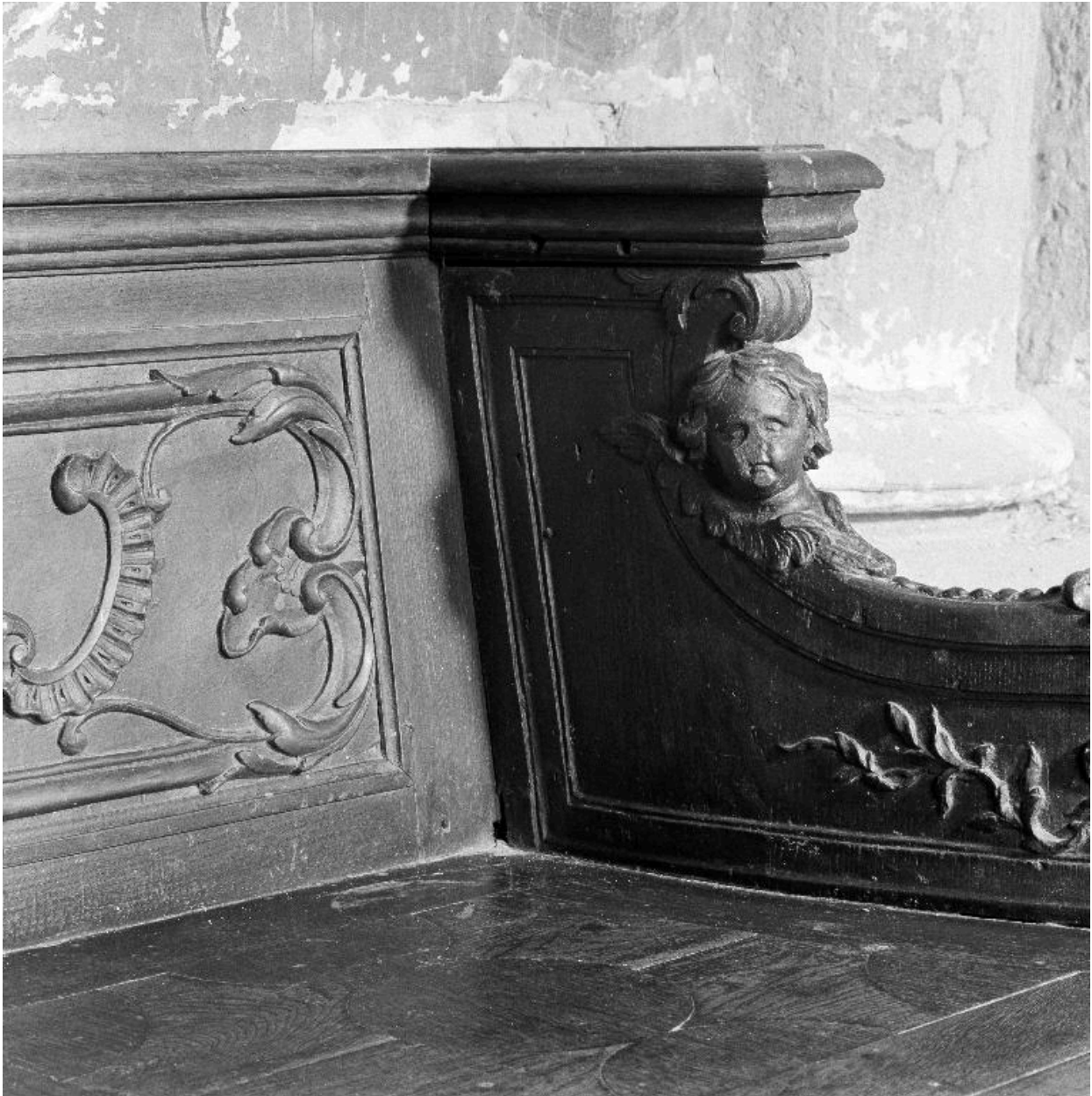
Détail du décor sculpté dans l'angle gauche : angelot et feuillage.