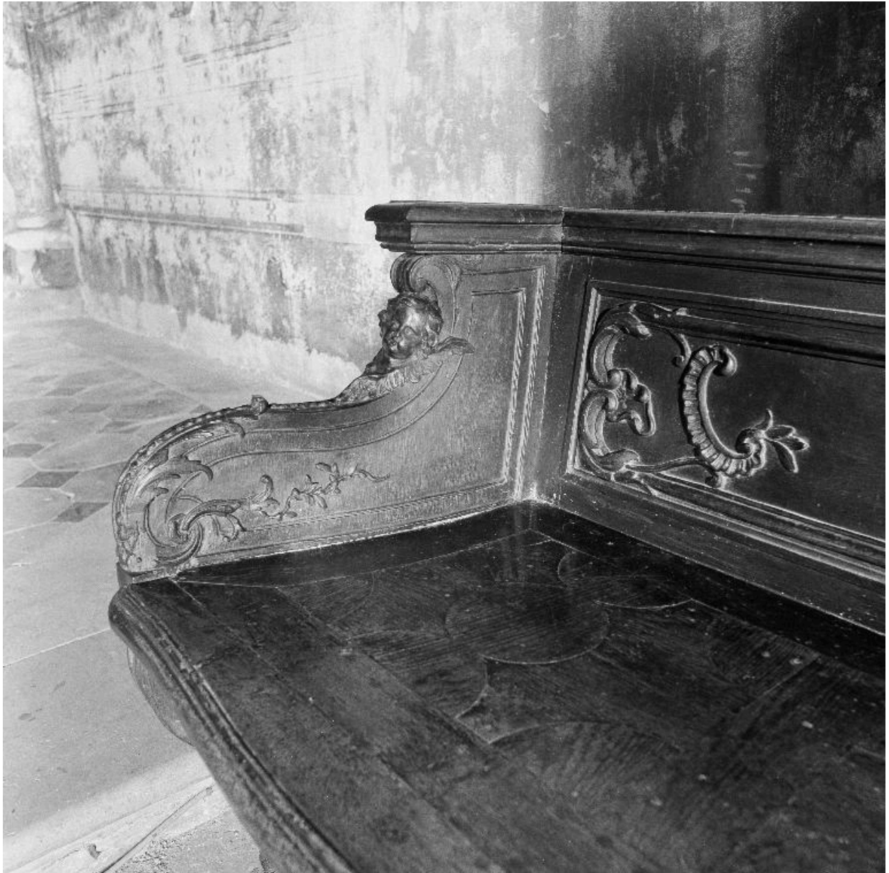
Détail d'un des côtés.