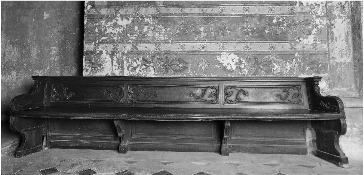
Vue d'ensemble, de face.