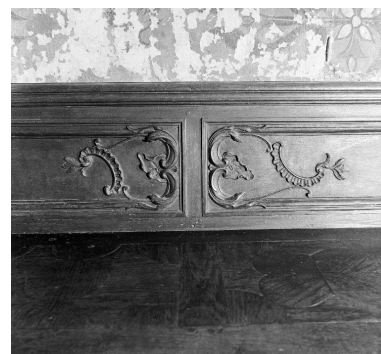
Détail du décor sculpté des panneaux du dossier et marqueterie de l'assise. IVR22_19966003725X