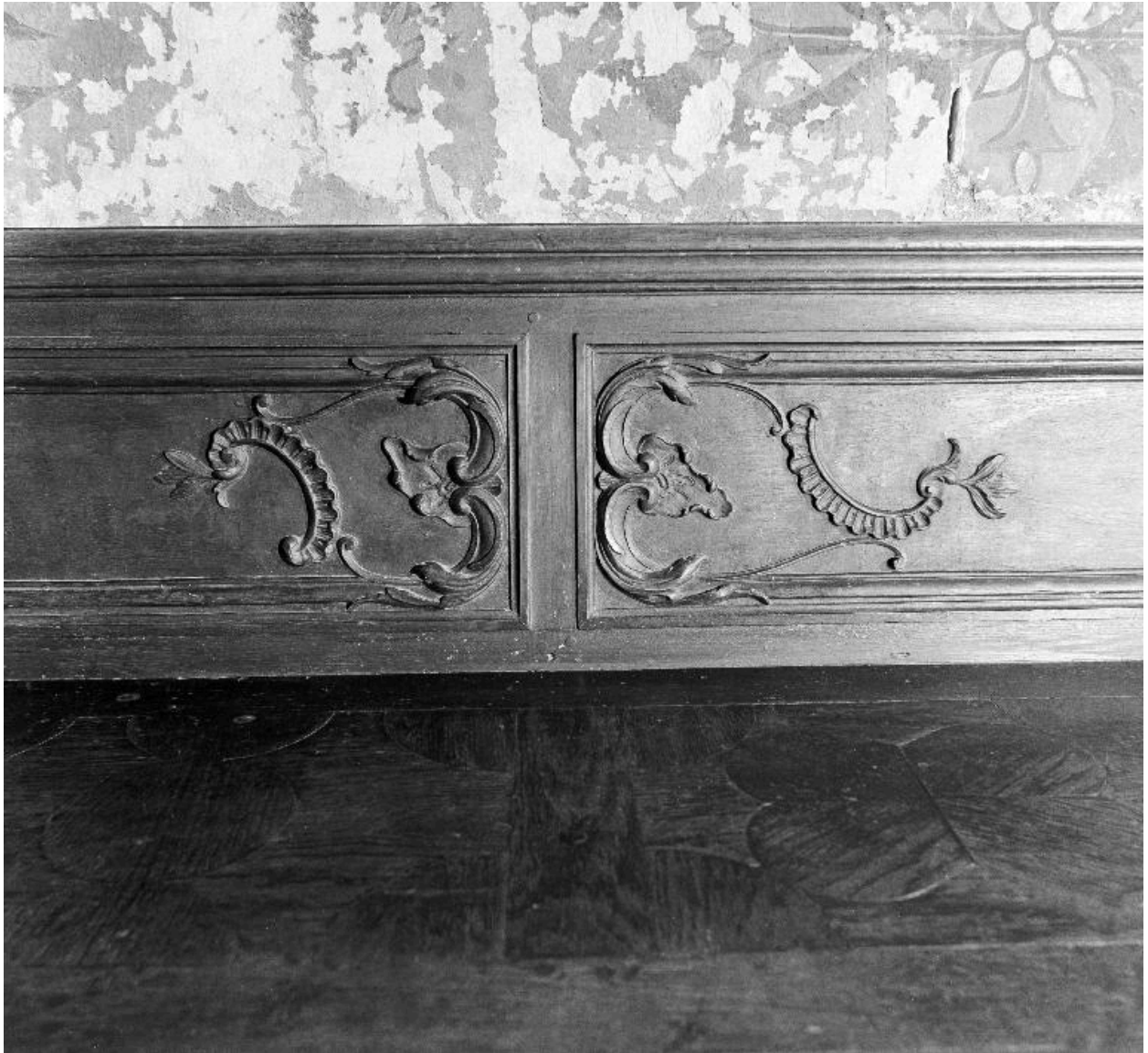
Détail du décor sculpté des panneaux du dossier et marqueterie de l'assise.