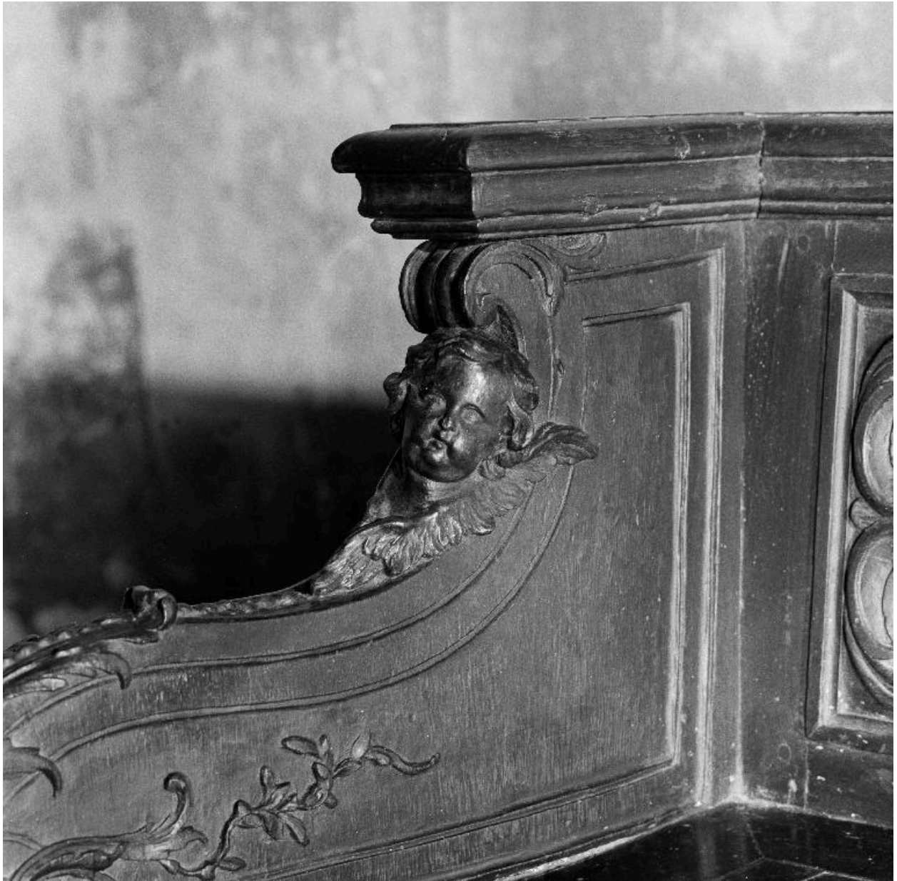
Détail d'un des angelots.