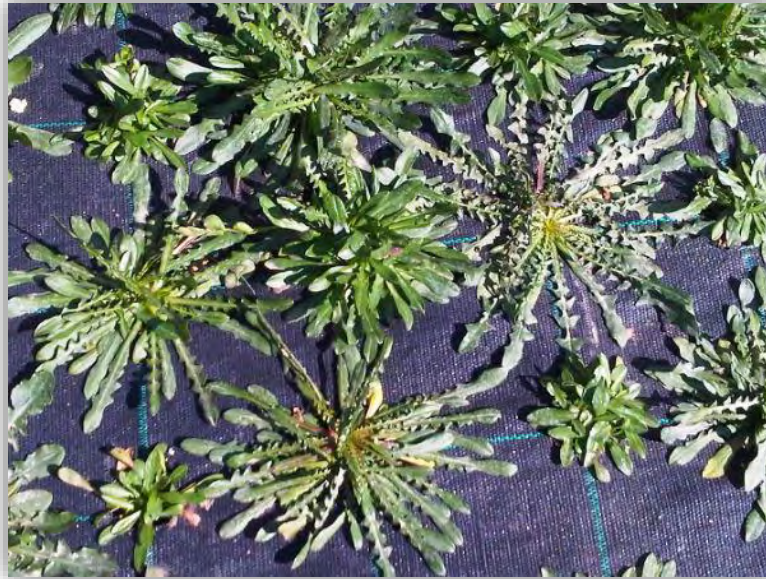
Εικόνα 1: Σταμναγκάθι, Cichorium spinosum