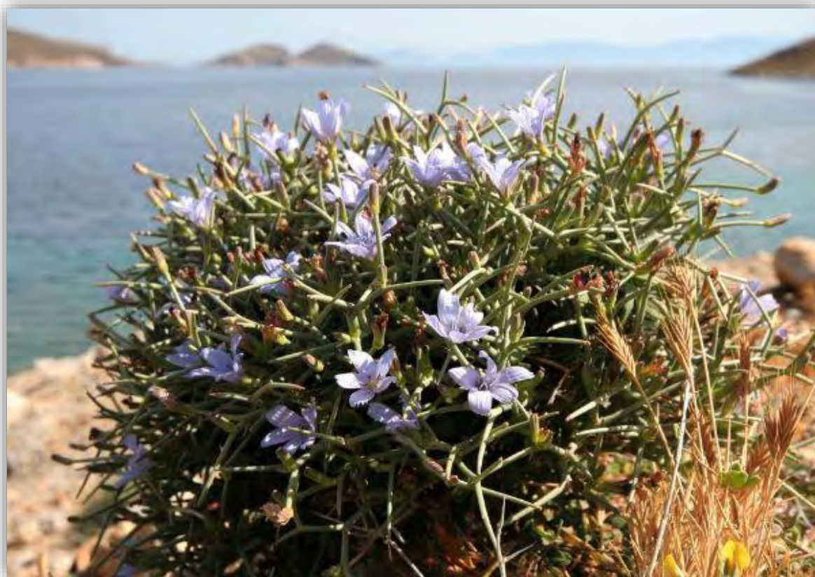
Εικόνα 2: Σταμναγκάθι, πλήρη ανάπτυξη με άνθη