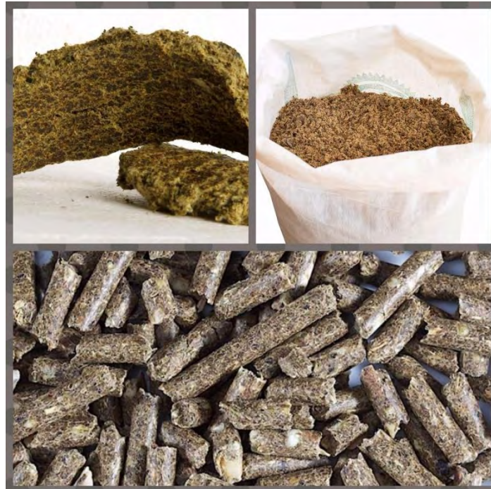
Εικόνα 9: Βαμβακόπιτα σε διαφορετικές μορφές

Τα προϊόντα που λαμβάνονται από την επεξεργασία του σπόρου είναι το λάδι, το βαμβακάλευρο (βαμβακόπιτα) (Εικόνα 9), οι φλοιοί και οι κοντές ίνες. Κατά μέσο όρο η αναλογία αυτών κατά βάρος φαίνεται στο Πίνακα 1, ενώ οι χρήσεις του φαίνεται στον πίνακα 2 (Παπακώστα, 2013).