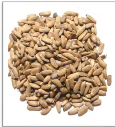
Εικόνα 4: Σπόρος αγριαγκινάρας

απαλά. Τα φύλλα της ανθικής κεφαλής της αγριαγκινάρας είναι πολύ χαρακτηριστικά καθώς είναι πολύ μεγάλα (50x30 cm) με χρώμα από κυανοπράσινο έως μωβ, όπου τμήματα αυτών έχουν σχήμα επίμηκες και καταλήγουν σε κίτρινες μικρές άκανθες. Τα άνθη της κεφαλής είναι συγκεντρωμένα σε μεγάλες σφαιρικές ανθοδόχες, οι οποίες ξεπερνούν τα 8 cm σε διάμετρο. Η στεφάνη των ανθέων είναι μπλε, ή λευκή. Τα κατά βάρος ποσοστά των διαφόρων μερών του φυτού είναι: 21% για τα φύλλα της ροζέτας, 12,1% για τα φύλλα του βλαστού, 21,9% για τους βλαστούς και 45% για τις ανθικές κεφαλές (ανθοδόχη 9,5%, βράκτια 13,2%, πάπποι 9,1% και σπέρματα 13,2%) (Παζαράς, 2014).