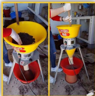
Εικόνα 10: Μηχάνημα θρυμματισμού

Για την πρώτη εποχή δημιουργήθηκαν 8 μεταχειρίσεις των 15 φυτοδοχείων όγκου 2 λίτρων ως εξής: