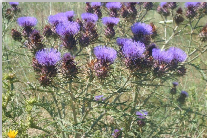
Εικόνα 7: Ανθοφορία αγριαγκινάρας

Μια εβδομάδα περίπου μετά τη συγκομιδή η καλλιέργεια αναβλαστάνει, με τη δημιουργία 1-4 φυτών ταυτόχρονα από μία ρίζα, που αναπτύσσονται παράλληλα και έτσι δημιουργούν εδαφοκάλυψη που ανταγωνίζεται τα ζιζάνια. Κατά το στάδιο της δημιουργίας ροζέτας, κάθε ρίζα θα θρέψει τελικά 1 το πολύ 2 φυτά ανάλογα με τα διαθέσιμα θρεπτικά του εδάφους. Παρατηρείται λοιπόν πως κατά το 2 ο χρόνο τα φυτά αναβλαστάνουν με ρυθμούς 5-10 φορές αυξημένους σε σύγκριση με το 1 ο έτος όπου προέρχονται από σπόρο. Σχετικά με την απόδοση σε βιομάζα, τη χρονιά της εγκατάστασης είναι συνήθως 1/3 έως 2/3 αυτής του 2 ου έτους. Από πειραματικές