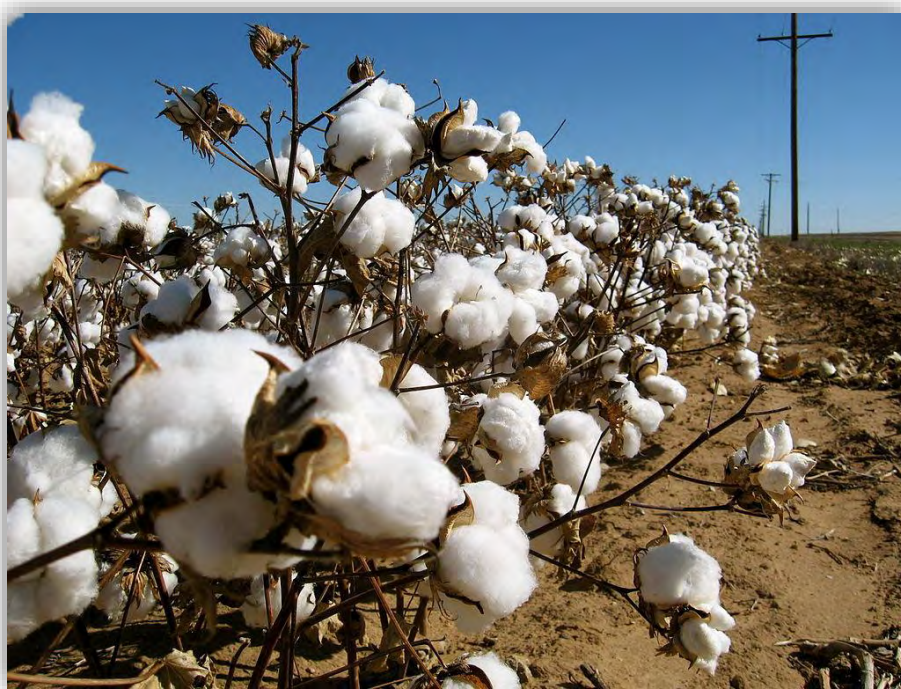
Εικόνα 8: Ωρίμανση καρπών βαμβακιού

μέχρι τέλος Οκτωβρίου συγκομίζεται περίπου το 80-85% της ολικής παραγωγής για όλη την Ελλάδα (Παπακώστα, 2013).