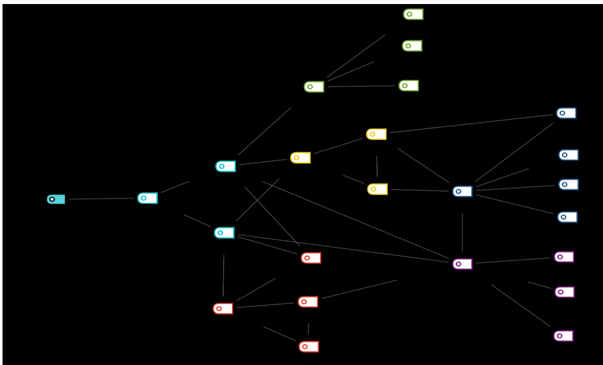
Schéma 1: Přehled kategorií a klíčových kódů

Pro lepší porozumění vztahu mezi kategoriemi a klíčovými kódy bylo vytvořeno schéma vyjadřující propojení kategorií a kódů. Po rozkódování jednotlivých segmentů u všech přepisů rozhovorů v programu MAXQDA 2020 byly převedeny opakující se segmenty do přehledného schématu. Výsledné segmenty značí zmíněnou a nejčastěji opakující se odpověď respondentů, které se týkají specifík resocializačního procesu v OV.