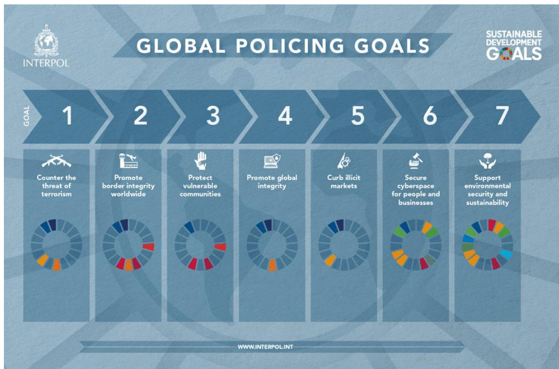
Obrázek 2 Global Policing Goals

V posledním cílů se současně zabývá INTERPOL především o ochraně důležitých zdrojů a mnoho dalších činnosti důležitých pro společnost. 3