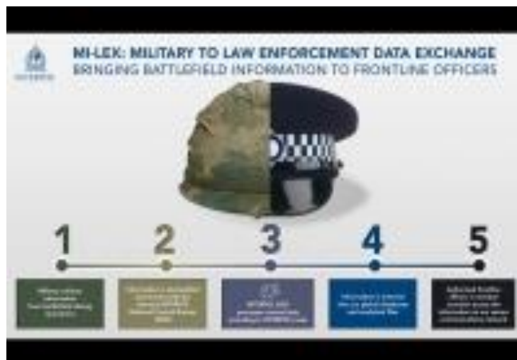
Obrázek 4 Popis spolupráce mezi Policií a vojáky

v členských zemích pak mohou k informacím přistupovat prostřednictvím sítě I-24/7 (Interpol, 2021). 6