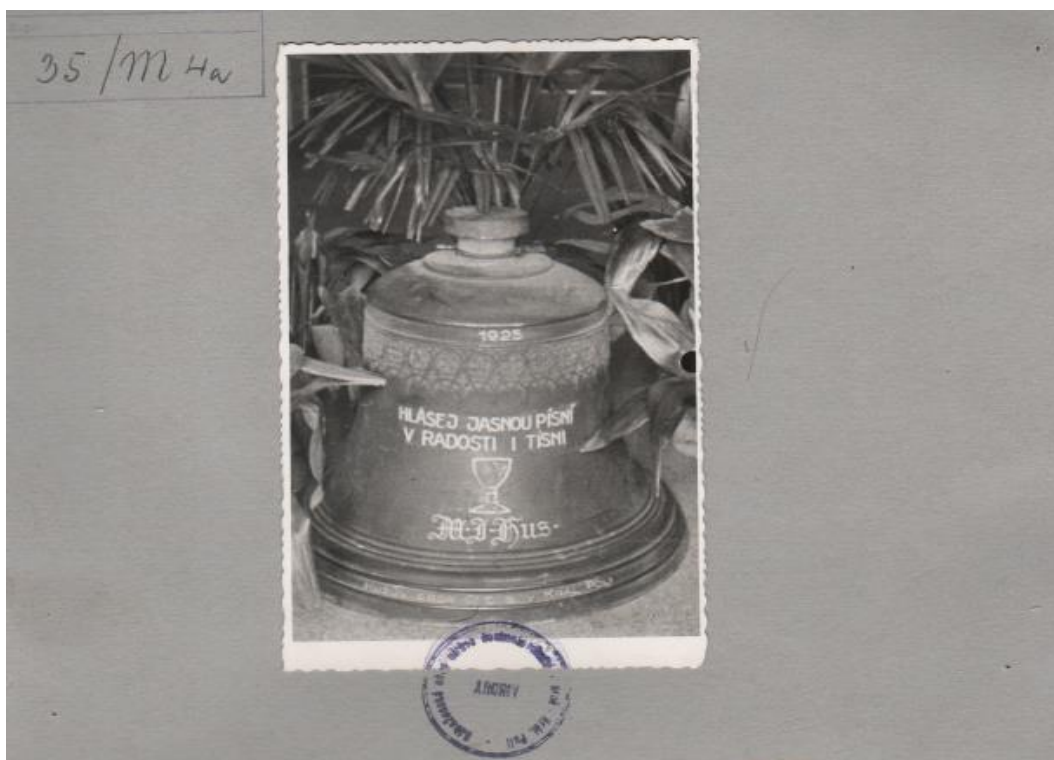
5. Menší ze dvou zvonů Husova sboru v Králově Poli. 113

Z výše uvedených citovaných finančních záznamů lze jednoznačně uvést, že pro zjištění skutečných nákladů by bylo nutné provést hlubší a důkladnější bádání, které by jistě vydalo na další studii. Rovněž je na místě úvaha, zda by další studie objasnila skutečné náklady na stavbu. Jako další uvádím, že pro tuto práci by podrobnější zkoumání finančních záznamů bylo příliš odbočující s ohledem na zvolené téma. Další zřejmou skutečností z výše popsaných událostí je, že sporů a žalob bylo daleko více. K dílčím sporům jednotlivých živnostníků nejspíš existuje v archivech CČSH více podkladů. Skutečnost, že velká většina dochovaných archivů je neinventarizována a netříděna, nabízí možnost dalšího bádání.