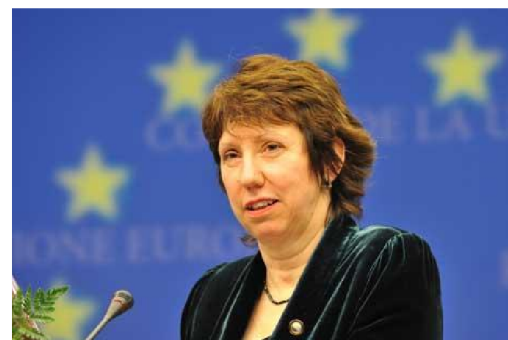
Catherine Ashtonová - vysoká představitelka Unie pro zahraniční věci a bezpečnostní politiku