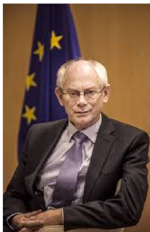
Herman van Rompuy - stálý předseda Evropské rady