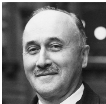
Jean Monnet - autor myšlenky sjednocené Evropy, zakladatel EU

Úkol 5. Kdo je na fotografiích? Po klepnutí na obrázek zobrazte popis: