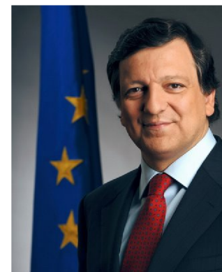
José Manuel Barroso - předseda Evropské komise