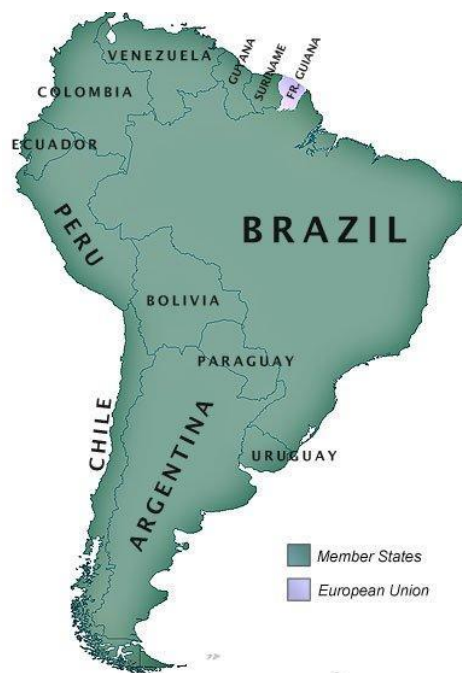
Obrázek 2 - Unie jihoamerických států