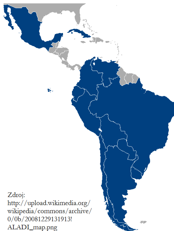
Obrázek 4 - Latinskoamerické integrační společnosti