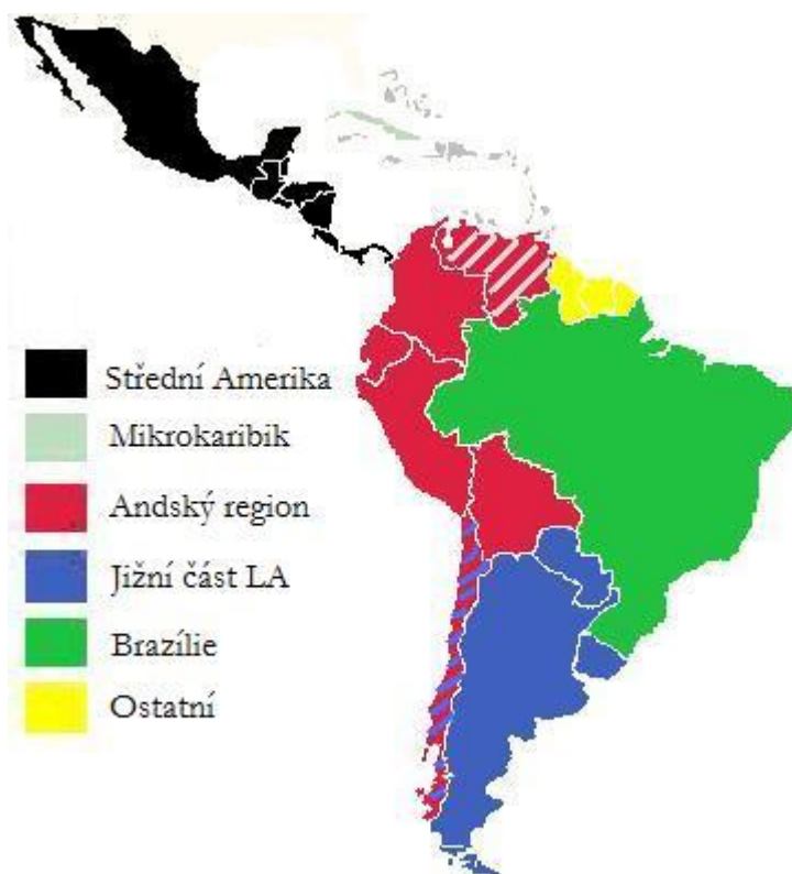
Obrázek 5 - Subregionální rozdělení LA

Mluvíme-li o Mikrokaribiku, máme na mysli pouze ostrovní státy, přestože nejvýznamnější integrační uskupení, které v oblasti nalezneme, již sdružuje i státy na Americkém kontinentu. Podobně jako ve Středoamerickém subregionu, započala integrace v Karibské oblasti poměrně brzy, již v 60. letech 20. století. Vzhledem