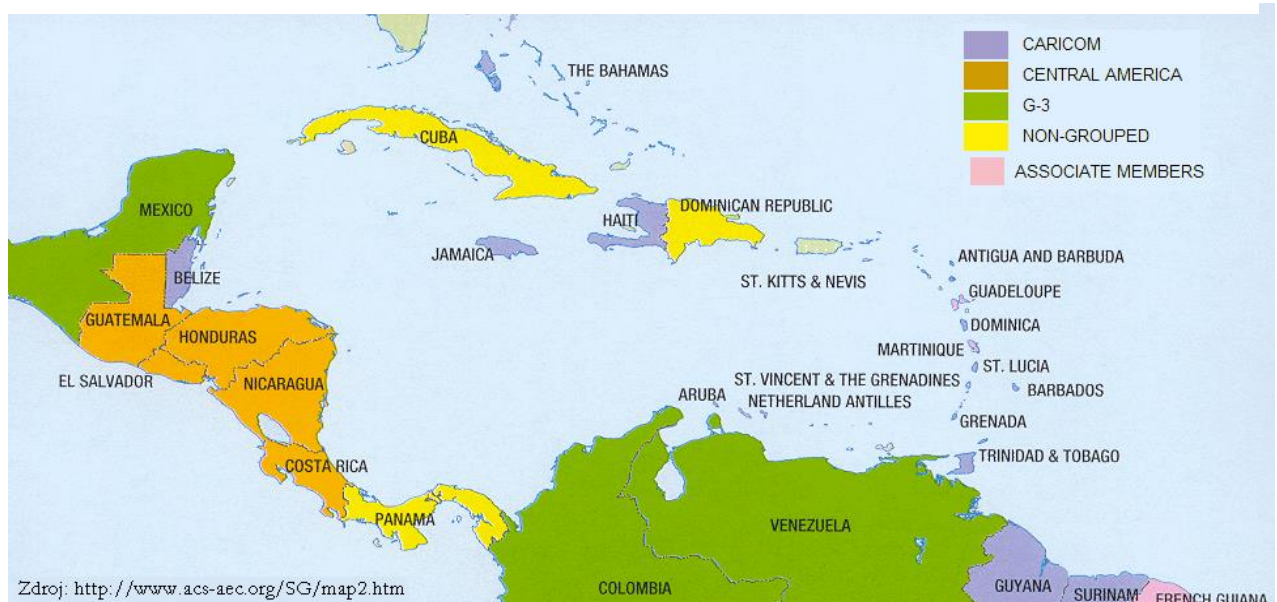
Obrázek 3 - Státy AEC rozdělené podle příslušnosti k dalším integračním seskupením

V karibském regionu nalezneme dvě hlavní integrační/kooperační seskupení, Karibská komunita a společný trh (CARICOM) a Asociace karibských států (AEC).