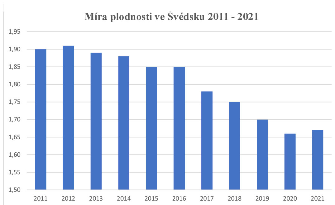
Graf č. 1: Míra plodnosti ve Švédsku 2011-2021

Zdroj: Vlastní zpracování, dle: https://www.statista.com/statistics/525511/sweden-fertility-rate/ 33