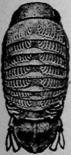
Fig. 90. Cymodoce longistylis Miers, ♀, ± 5 X.

Länge 9 mm., Breite 4.5 mm. Augen hellbraun. Das zweite Thoracomer ist bedeutend länger als die übrigen. Die Antennen erreichen den Hinterrand des zweiten Thoracomers. Die Coxalplatten sind spitz, vor allem die vorderen. Am Hinterrand des achten Thoracomers beiderseits eine kleine Spitze. Abdomen mit 3 Suturen der vorderen Pleomeren. Viertes Pleomer beiderseits mit distad gerichteter Spitze. Pleotelson gross, mit 2 starken Erhebungen. Hinterrand mit stumpfem medianem Zahn. Uropode ein wenig kürzer als das Pleotelson; Endopod beinah gerade, flach, rechteckig abgeschnitten; Exopod kürzer, zugespitzt. Oberseite mit eigentümlicher Zeichnung, welche in der Figur angegeben worden ist. Keine Brutlamellen.