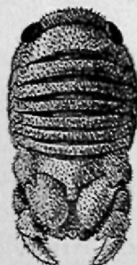
Fig. 95. Cilicæa latreillei Leach, ♀, 4 ×.