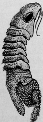
Fig. 93. Cilicæa latreillei Leach, von der rechten Seite, ♂, 5 ×.