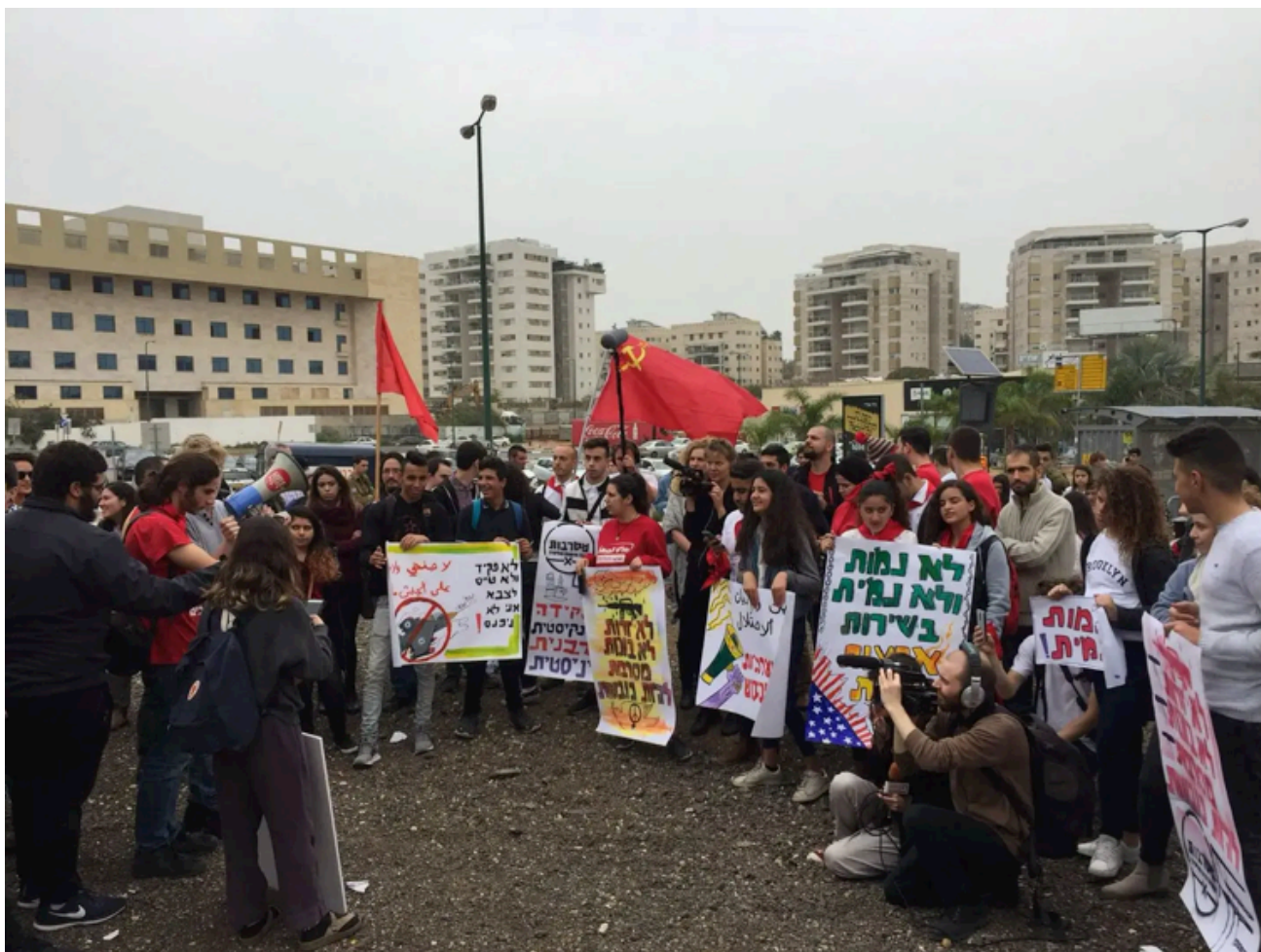
En demonstration utanför ett av IDF:s värvningskontor 2018.

De uppmärksammar även frågor som de säger att läroplanen ignorerar, som fördrivningen 1948 av araber och den ständiga kränkningen av mänskliga rättigheter i de ockuperade territorierna.