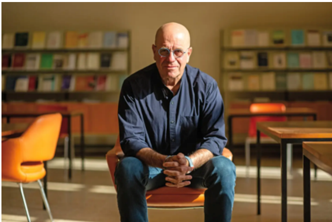
Avraham "Avrum" Burg.

A vraham Burg har varit en man med många titlar. Ättling till en av de aristokratiska familjerna i den religiösa sioniströrelsen, talman i den 15:e kneset (1999-2003), ledande medlem i Laborpartiets vänsterinriktade "group of eight" på sent 80-tal och tidigt 90-tal, ordförande för Jewish Agency (1995-1999) och, enligt protokollet, under sin ämbets tid som knessets talman, även Israels tillförordnade president mellan tiden för Ezer Weizmans avgång och valet av Moshe Katsav till den posten. Ingen resumé skulle kunna vara mer sionistisk och judisk.