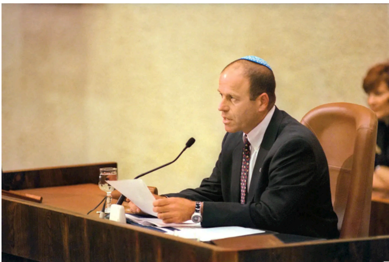
Avraham Burg som talman för Knesset.

”Ändå är den messianska dialogen mycket närvarande.”