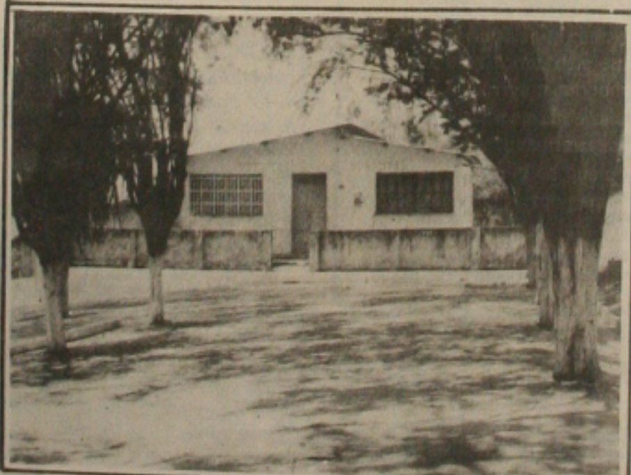
Na Prefeitura, todos os esforços são envidados no sentido de minimizar os problemas da comunidade, sem qualquer favoritismo político.

particularmente o Sertão, sofre com a estiagem que deixa um rastro de destruição e consequências drásticas para o povo, queimando os pastos, sacrificando o rebanho bovino, logicamente empobrecendo os municípios. Em Pedra Mole não poderia ser diferente visto que a chuva não depende do prefeito, mas da natureza. Apesar desta dura realidade, explicou o chefe do Executivo Municipal, o que se refere ao consumo humano Pedra Mole pode se considerar privilegiada.