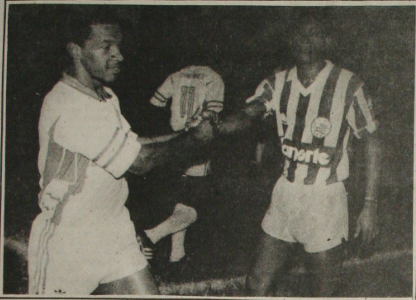
Batista segue confiante