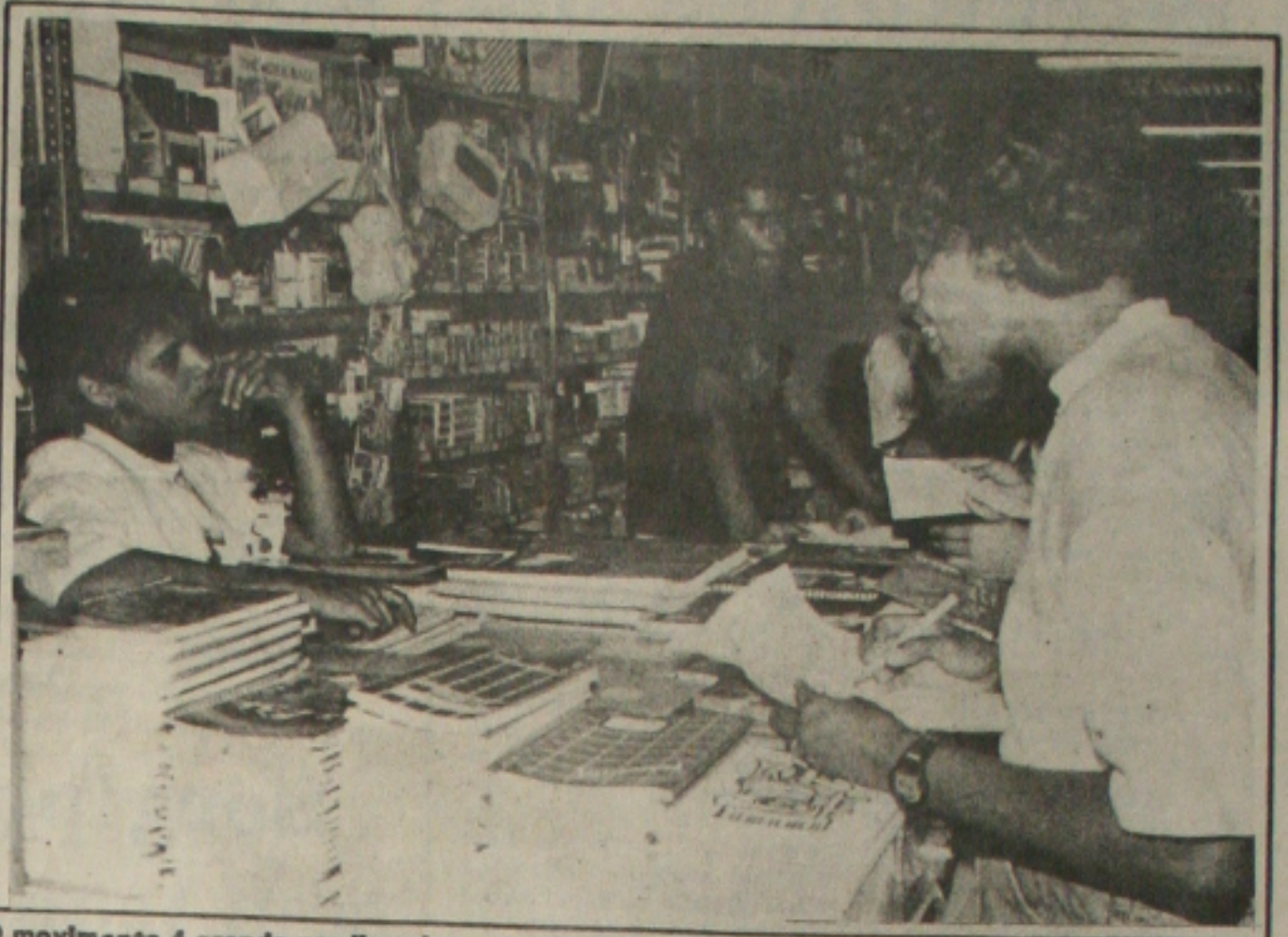
O movimento é grande nas livrarias a poucos dias do início do ano letivo