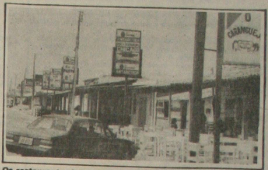
Os restaurantes lucraram com a presença de muitos turistas na cidade.

O crescimento do fluxo de turistas em Sergipe neste verão deixou bastante animados os proprietários e gerentes de restaurantes da orla marítima de Aracaju. Na maioria deles, o movimento aumentou entre 10 e 20% em comparação ao mesmo período do ano passado. Mas para a maioria, a tendência agora é de redução na frequência nos restaurantes, por causa do reinício das aulas no próximo dia 7. (Página 5A).