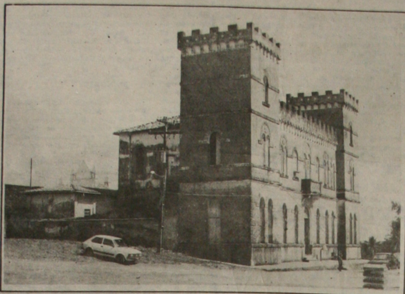
Os presos estavam no pátio interno quando tentaram a fuga e foram mortos a tiros.

Jackson Barreto também ressaltou o plantio de flores e plantas ornamentais em avenidas como Beira Mar e Ivo do Prado. Mas não é só isso, pois a malha viária também foi totalmente recuperada e a Empresa Municipal de Obras e Urbanização (Emurb) vem trabalhando ininterruptamente, evitando que as ruas voltem a ser cobertas de poeira que ora em 52.