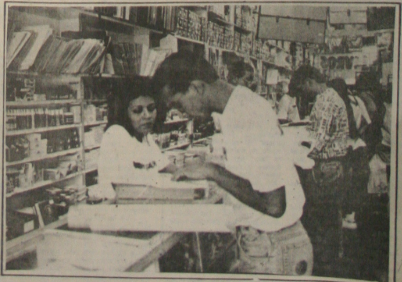
Livrarias, é cada vez mais intenso o movimento.