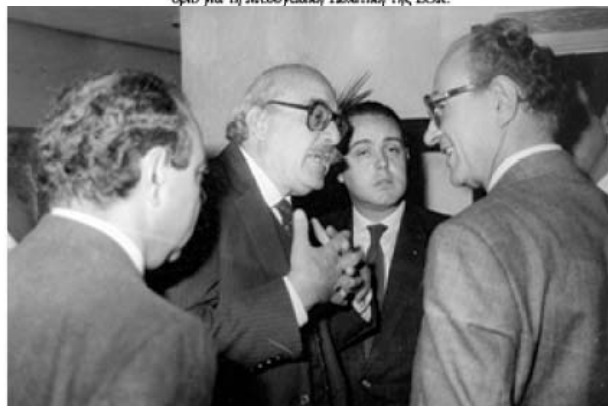
Κομισιόν-Διεθνείς Υποθέσεις, Μαρόκο. Συνέδριο για τη Μεσογειακή Πολιτική της ΕΟΚ. Απτήματα Μαροκινών επιχειρηματιών.