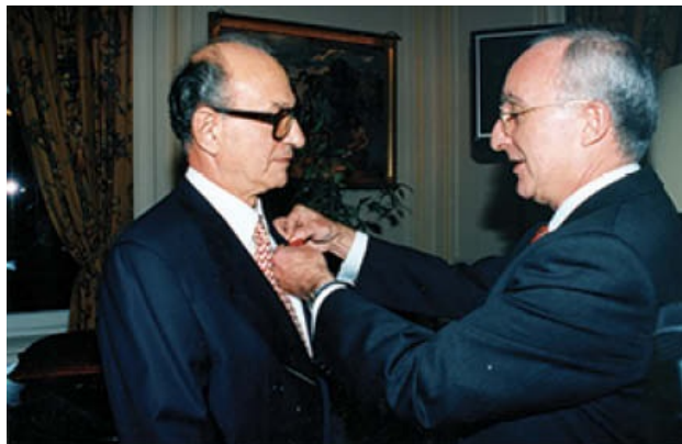
1996. Δεύτερη παρασημοφόρηση από τον Γάλλο Πρόεδρο εκ μέρους της Γαλλικής Δημοκρατίας.