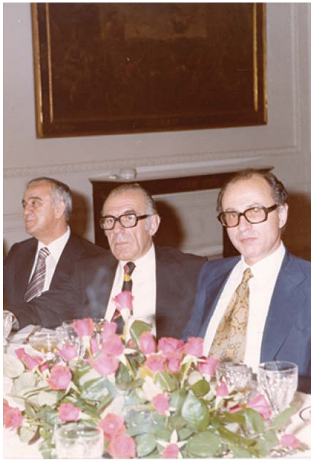
1979. Επίσημο δείπνο την ημέρα της υπογραφής της Πράξης Προσχώρησης στο Προεδρικό Μέγαρο. Πρώτος από δεξιά ο συγγραφέας.