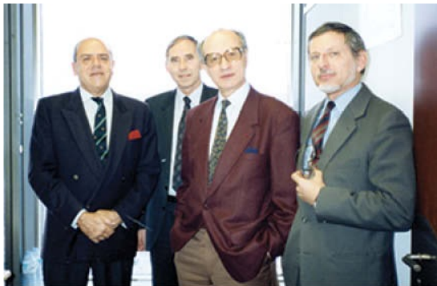
Βρυξέλλες-Ανάπτυξη. Με τους πιο στενούς συνεργάτες πολιτικούς μηχανικούς.