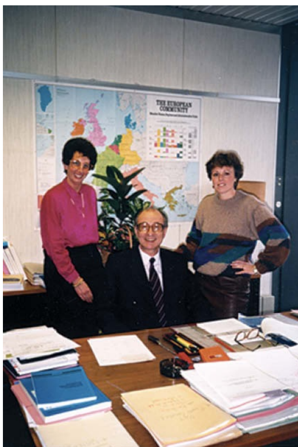
Κομισών-Διεθνείς Υποθέσεις. Με τη Γαλλίδα γραμματέα μου αριστερά και τη Βελγίδα δεξιά.