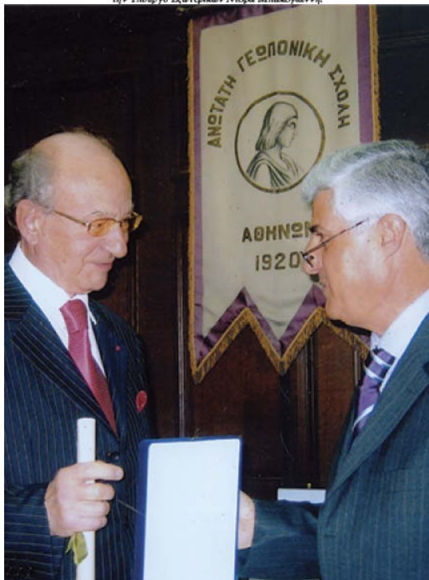
2007. Απονομή τιμητικής πλακέτας από τον Πρόεδρο του Γεωπονικού Πανεπιστημίου.