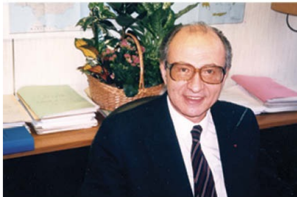
Βρυξέλλες-Διεθνείς Υποθέσεις. Στο γραφείο μου.