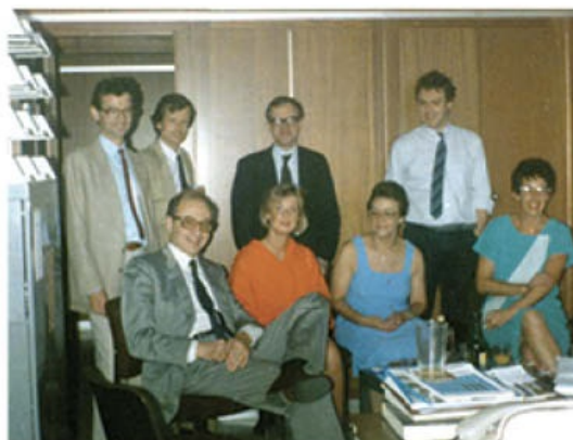
Κομισιόν-Διεθνείς Υποθέσεις. Με ομάδα συνεργατών.