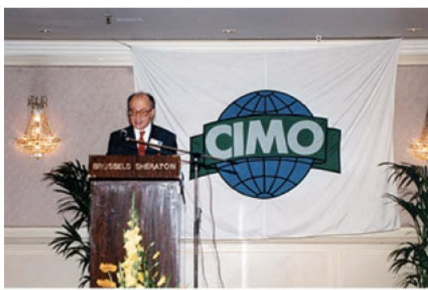
1990. Ομιλία σε συνέλευση της CIMO στις Βρυξέλλες ως εκπρόσωπος της Κομισιόν.