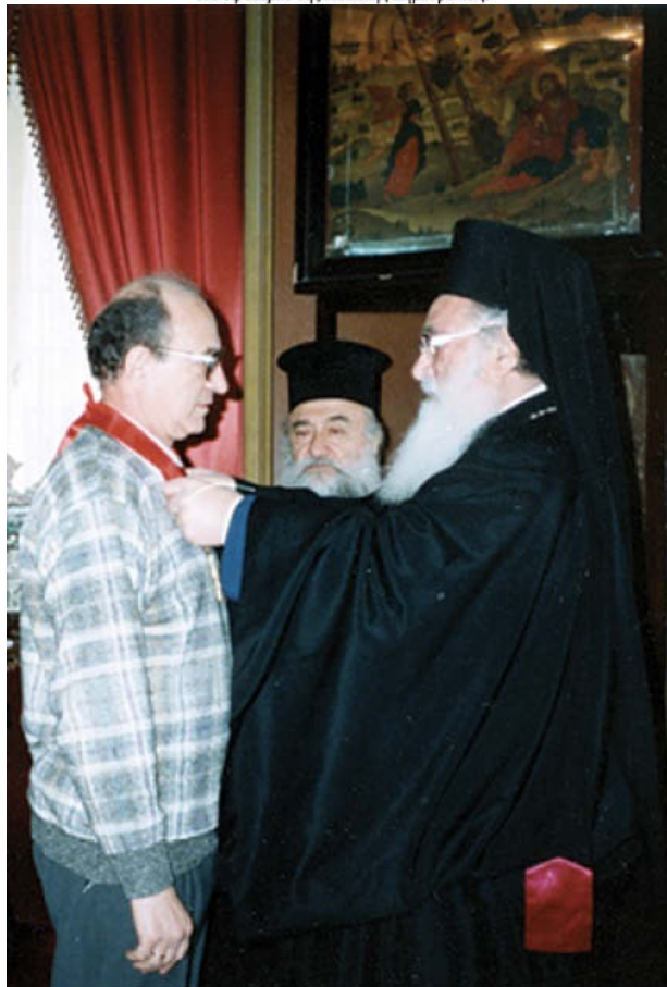
1989. Παρασημοφόρηση του συγγραφέα από τον Πατριάρχη Ιεροσολύμων Δαδβαιο Α'.