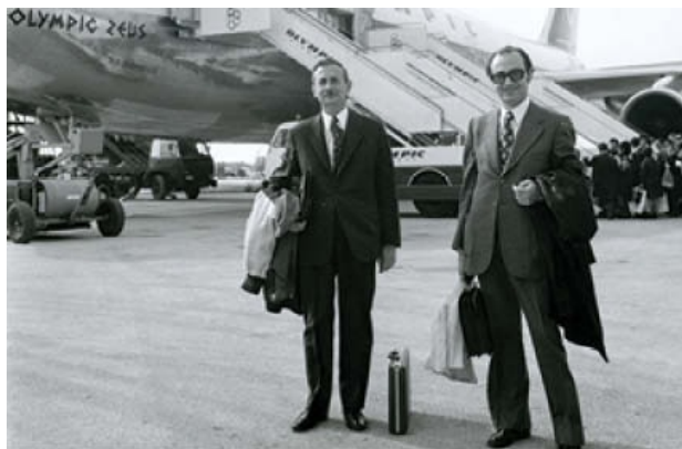
1974. Προς Ουάσινγκτον για διαπραγματεύσεις με διεθνή τράπεζα.