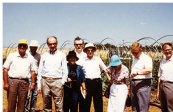
Κομισών-Διεθνείς Υποθέσεις. Περιοδεία στη Νοτιοανατολική Τουρκία με συνεργάτες μου. Επίσκεψη σε γιγαντιαίο φράγμα επί του ποταμού Ευφράτη και στην αρδευτική του περίμετρο.