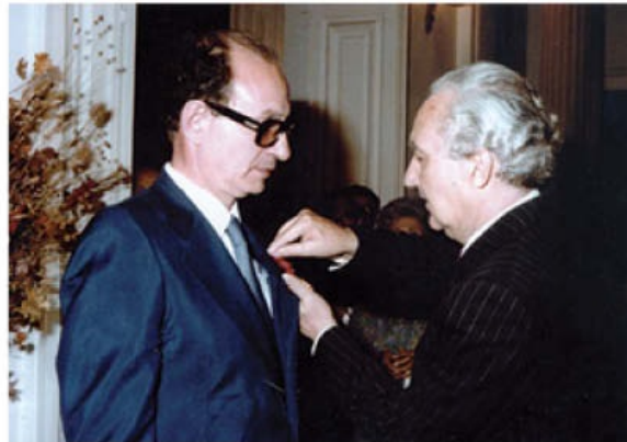
1981. Παρασημοφόρηση του συγγραφέα από τον Γάλλο Πρόσβη εκ μέρους του Προέδρου της Γαλλικής Δημοκρατίας.