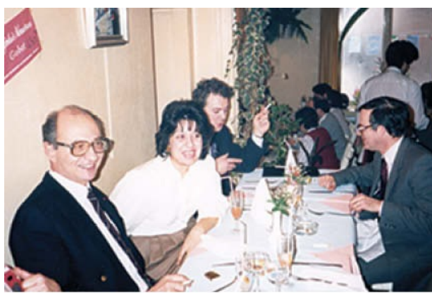
Κομισιόν-Διεθνείς Υποθέσεις. Γεύμα με συνεργάτες.