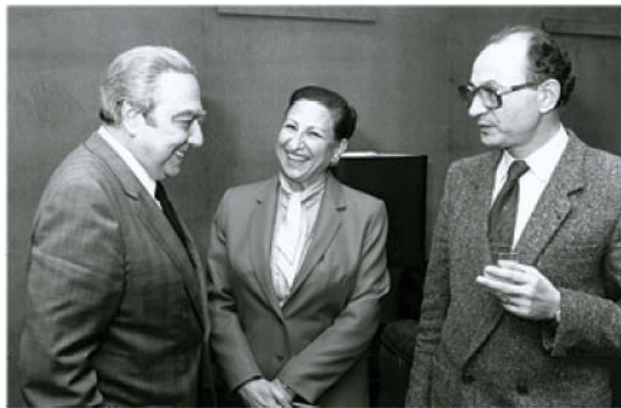
Κοινωνία-Διεθνείς Υποθέσεις. Με τον Γάλλο Επίτροπο Ortoli σε δεξίωση.