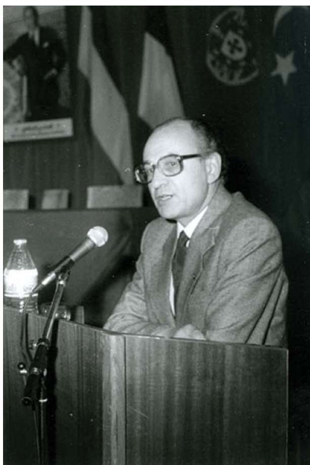
Κομισιόν-Διεθνείς Υποθέσεις, Μαρόκο. Ομιλητής σε συνέ- δριο για τη Μεσογειακή Πολιτική της ΕΟΚ.