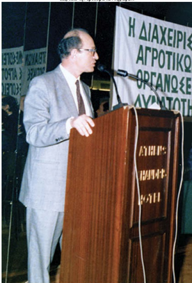
1988. Ομιλία για τη «Μεγάλη Ενιαία Αγορά» σε συνέδριο μεσογειακών χωρών στην Αθήνα, ως εκπρόσωπος της Κομμουν.