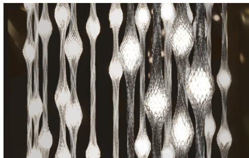
„Liana“ od Maxima Velčovského

Inspirací byl umělkyni měsíc, který je asi nejznámějším příkladem odrazu světla ve vesmíru. Aura zachycuje různé fáze tohoto vesmírného tělesa a sestavená může být stejně dobře horizontálně jako vertikálně.