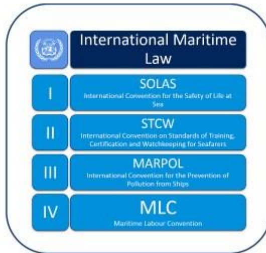
Εικόνα 3 η : Οι διεθνείς συμβάσεις του Διεθνούς Ναυτιλιακού Οργανισμού

Οι βασικοί λόγοι της θέσπισης της σύμβασης SOLAS είναι η όλο και περισσότερο αυξημένη ανησυχία για την κακή ποιότητα της διοίκησης στον κλάδο της ναυτιλίας, ο συνεχιζόμενος προβληματισμός για τη διατήρηση της ασφάλειας κατά τη διάρκεια των θαλάσσιων μεταφορών και οι τραγικές συνέπειες που είχαν φέρει τα θαλάσσια ατυχήματα τόσο για το έμπυχο δυναμικό όσο και για το περιβάλλον. Έτσι τέθηκαν σε λειτουργία οι μηχανισμοί που θέσπιζαν και ενεργοποιούσαν μια σειρά από μέτρα ασφάλειας αναφορικά με τις ανθρώπινες ζωές που πραγματοποιούν θαλάσσια ταξίδια, με τη βελτίωση των κατασκευαστικών και εξοπλιστικών στοιχείων των πλοίων, για την αποτελεσματικότερη αντιμετώπιση των κινδύνων που είχαν στο παρελθόν προκαλέσει διάφορα ατυχήματα.