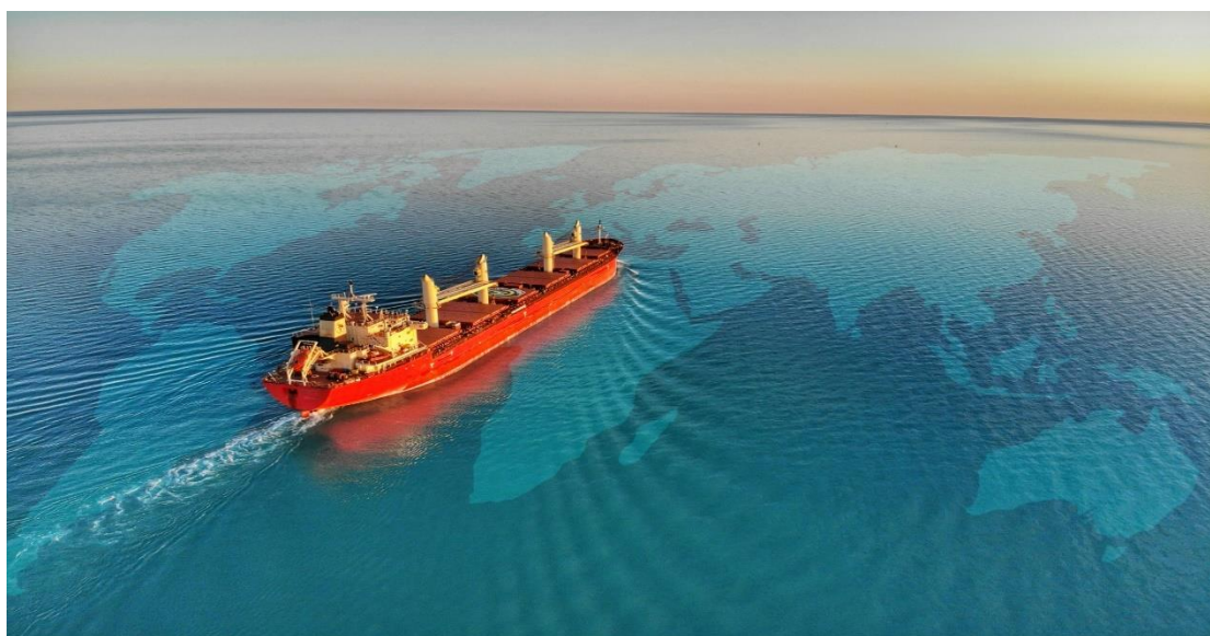
Εικόνα 1 η : Πλοίο πάνω στο σκίτσο της υδρογείου

Για παράδειγμα, το 1952 έλαβε χώρα στο Λονδίνο, μια τέτοια συνδιάσκεψη με θεματική τη θαλάσσια ρύπανση, από τη στιγμή που τα ποσοστά του όγκου του μεταφερόμενου πετρελαίου δια θαλάσσης αυξήθηκε τις δεκαετίες του 1950 και 1960. Από τη συνδιάσκεψη αυτή προέκυψε η Συνθήκη του 1954 για την Πρόληψη της Ρύπανσης της θάλασσας από πετρέλαιο με την ονομασία OILPOL. Η OILPOL όριζε μια σειρά από απαγορευμένες ζώνες που έφταναν μέχρι και 50 ναυτικά μίλια από την εκάστοτε στεριά. Φυσικά η συγκεκριμένη συνθήκη γνώρισε πολλές σταδιακές ενημερώσεις και αναδιαρθρώσεις μέσα στο πέρασμα των χρόνων ( http://www.imo.org/blast/mainframe.asp?topic_id=231#1 ).