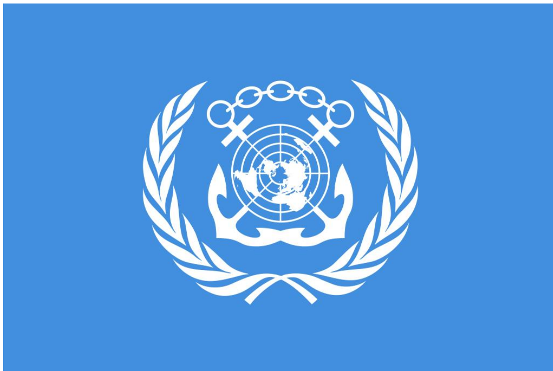
Εικόνα 2 η : Το λογότυπο του Διεθνούς Ναυτιλιακού Οργανισμού

Η ίδρυση του Διεθνούς Ναυτιλιακού Οργανισμού χρονολογείται στις 17 Μαρτίου του 1948. Η πρώτη του συνεδρία του όμως έλαβε χώρα τον Γενάρη του 1959. Η ονομασία του όπως συναντάται στη διεθνή βιβλιογραφία είναι IMO–International Marine Organization–και έτσι είναι ευρέως γνωστός στους ναυτιλιακούς κλάδους. Ο Διεθνής Οργανισμός Ναυτιλίας – στο εξής ΔΝΟ – είναι ένας οργανισμός ο οποίος υπάγεται στα Ηνωμένα Έθνη με έδρα το Λονδίνο, με σκοπό την ασφάλεια και την προστασία της παγκόσμιας ναυτιλίας και την πρόληψη της ρύπανσης που δυνητικά μπορεί να προέλθει από τα πλοία. Επιπλέον δραστηριότητες και αρμοδιότητες του ΔΝΟ, είναι να διευκολύνει την παγκόσμια θαλάσσια κυκλοφορία, επίσης η νομική ενασχόληση, ζητήματα ευθύνης και αποζημιώσεων ( https://www.mfa.gr/exoteriki-politiki/i-ellada-stous-diethneis-organismous/imo.html ).