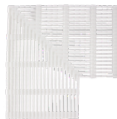
Hörn - 2310041