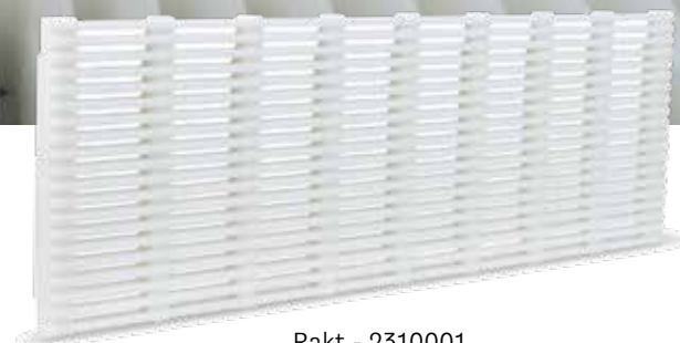
Rakt - 2310001