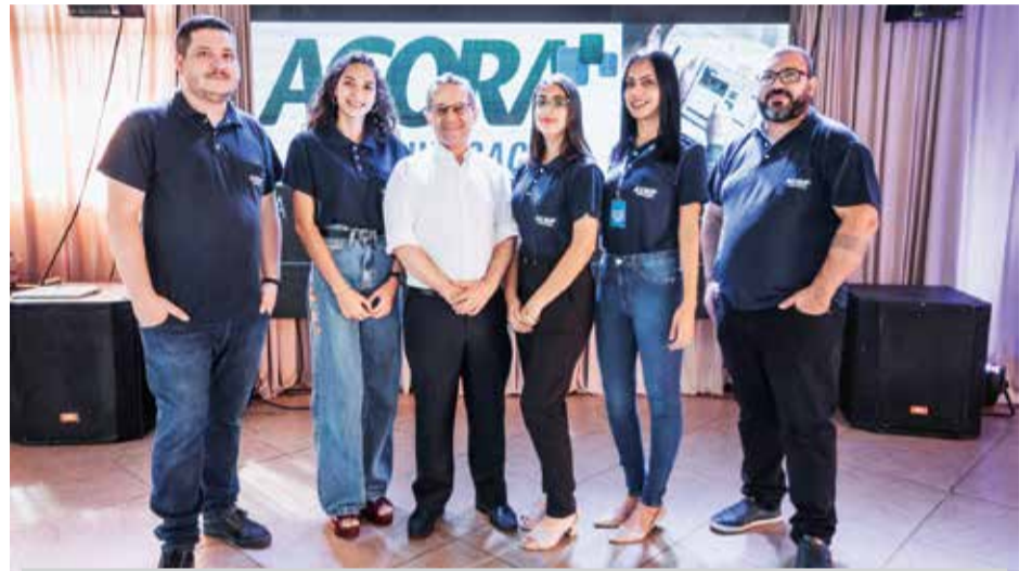
Equipe da Agora Comunicação, promotora do evento, pela segunda vez, em parceria com a empresa Datavox. A parceria será mantida em 2023 e a pesquisa deve ocorrer no primeiro trimestre do ano

Recentemente, a empresa tem investido na modalidade de aluguel de impressoras, ampliando a cartela de serviços e conquistando cada vez mais clientes.