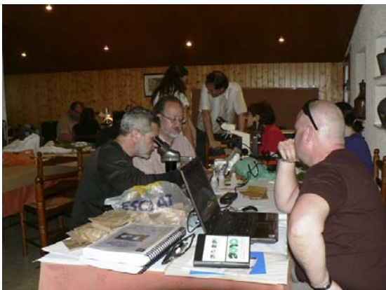
Laboratori per a la identificació d'espècies.