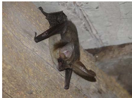
Ratpenat orellut meridional.