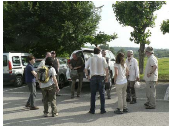
Els participants amb la Directora General de Polítiques Ambientals.