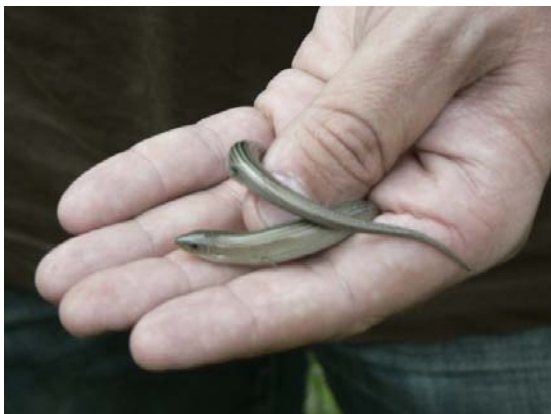
Esmunyedís ( Chalcides striatus ).