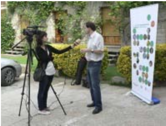
Presentació de les jornades als mitjans de comunicació.