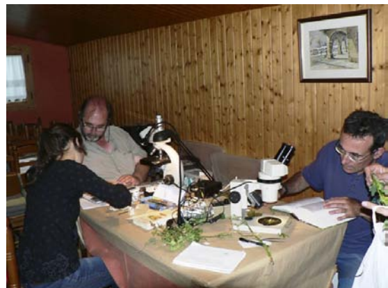
Verificació de les observacions realitzades.