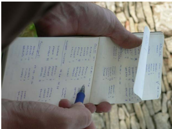
Anotant les observacions ornitològiques.