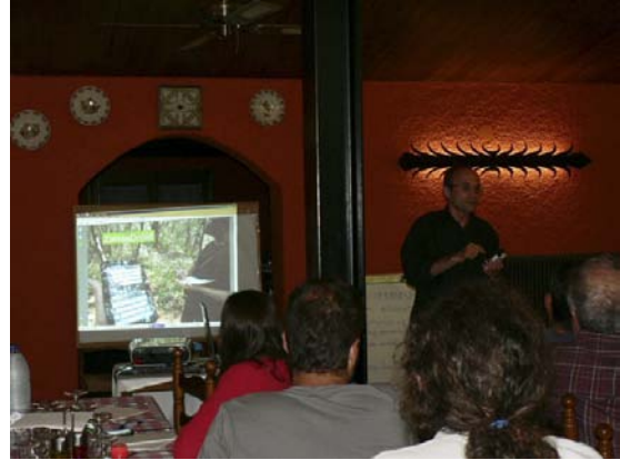
Presentació del programari ZamiaDroid.