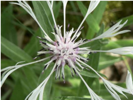
Centaurea montana .