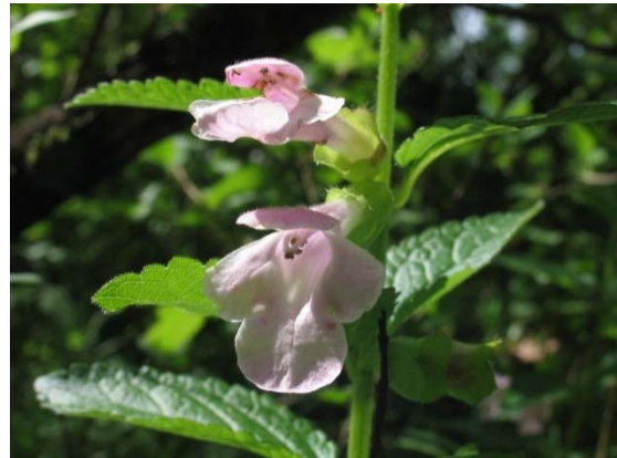
Melittis melissophyllum .