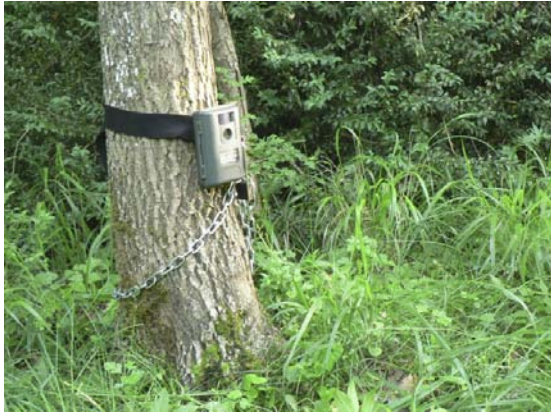
Dispositiu de presa de fotografies nocturnes.