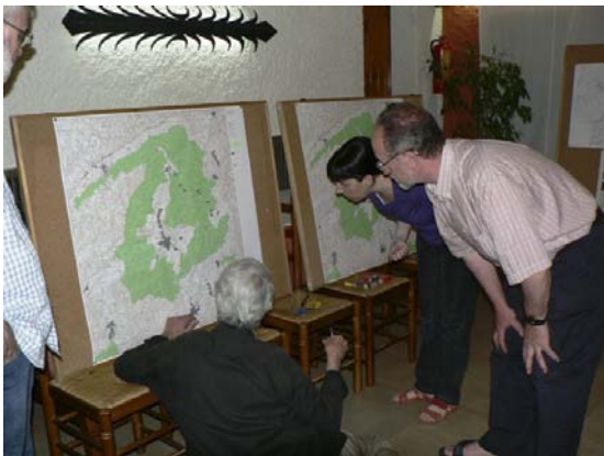
Marcant les zones prospectades.