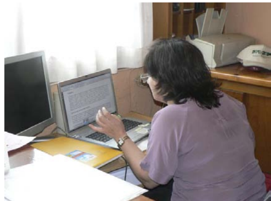
Informació a través de les xarxes socials.