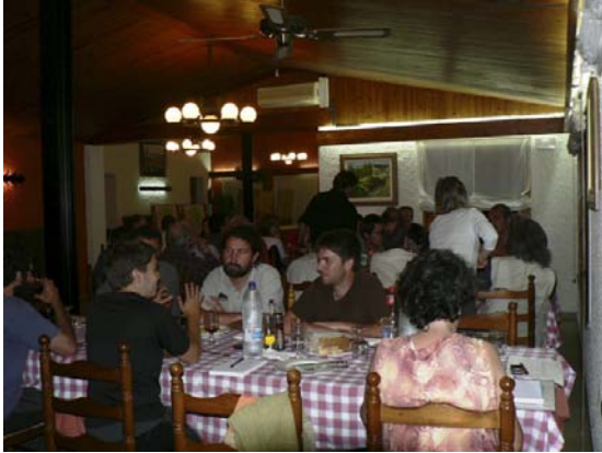
Els assistents a l'hora de sopar.