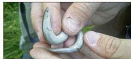
Un ratpenat orellut (a dalt) i un esmunyidís (a sota)

tic, el bosc de faig de la Saura negra, molt singular tot ell; i els voltants de les coves del Toll, tant pel que fa als cargols terrestres com als