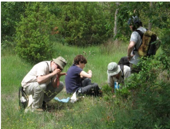
Recollint mostres de briòfits.