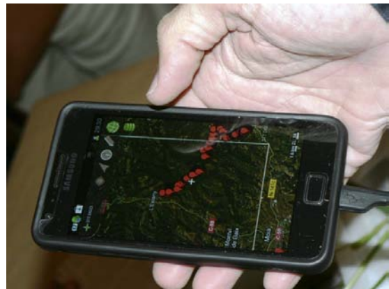
Presa de dades amb ZamiaDroid.