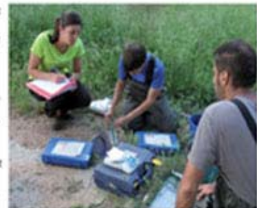
DILLUNS, 2 DE JULIOL DEL 2012 | Regió7

Les activitats públiques d'aquestes Jornades es van cloure amb la presentació de l'exposició «Natura Catalana» de la Societat Catalana de Fotògrafs de Natura (SCHN) a Moià, la qual va rebre un elevat nombre de visitants.