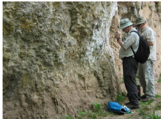
Recollint mostres de líquens.