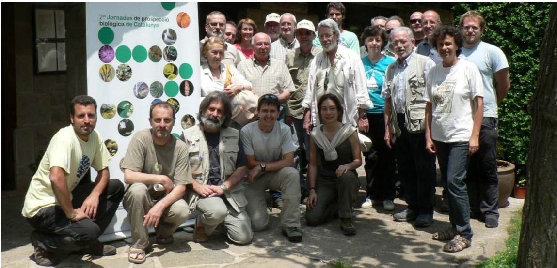
Assistents a les jornades.