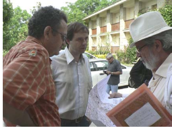
Trobada inicial i repartiment de les zones a prospectar.