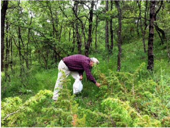
Prospectant espècies de flora.