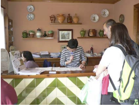
Arribada dels participants.