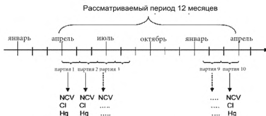
Рисунок D.1 — Пример 1. Результаты измерений характеристик твердого топлива из бытовых отходов, упорядоченные по возрастанию