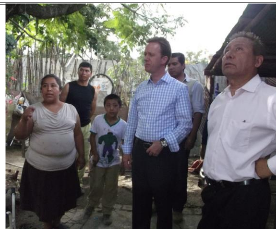
Entrega de apoyos como parte del programa “Colocación de Techos de Fibrocemento” en San Vicente Ferrer.