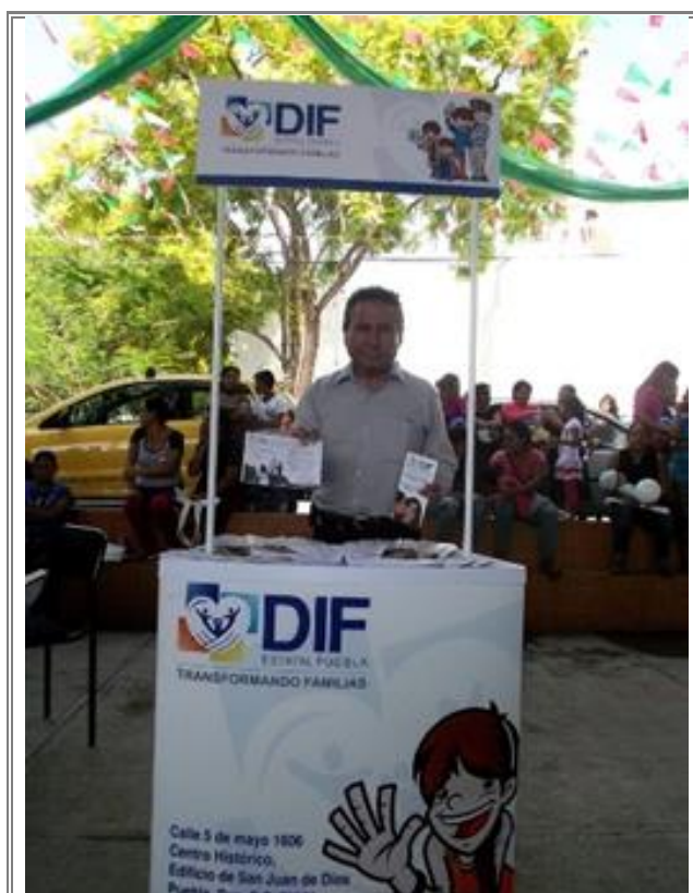
Atención general mediante módulos del DIF.