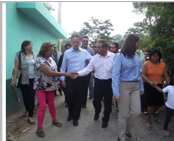
Entrega de apoyos como parte del programa “Colocación de Techos de Fibrocemento” en San Vicente Ferrer.

Este programa se realiza como parte de las acciones coordinadas entre los tres niveles de gobierno para atender a la población en situación de marginación. Se instalarán 12 mil 255 techos en toda la entidad y aproximadamente mil quinientos en la ciudad de Tehuacán y su región. Se reafirma que se seguirán coordinando esfuerzos con los Gobiernos Federal, Estatal y Municipal, a través de una planeación articulada, para atender las necesidades de los habitantes.