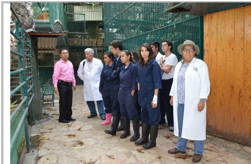
Visita de estudiantes de la UNAM a las instalaciones del zoológico “Club de los Animalitos”.

Así mismo se realizó una Visita y explicación de las piezas arqueológicas de las Culturas prehispánicas, recopiladas y dadas de alta en los catálogos del INAH a los alumnos.