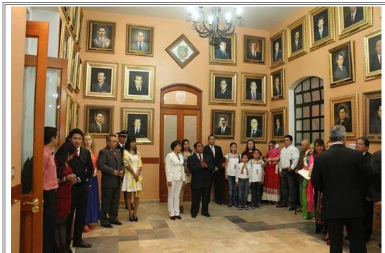
Ceremonia del Grito de Independencia en el Palacio Municipal del H. Ayuntamiento de Tehuacán.

Como parte del cumplimiento de derechos cívicos y la conservación de tradiciones nacionales.