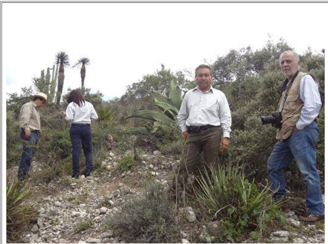
Recorrido por la zona ecoturística San Juan Raya – Zapotitlán Salinas