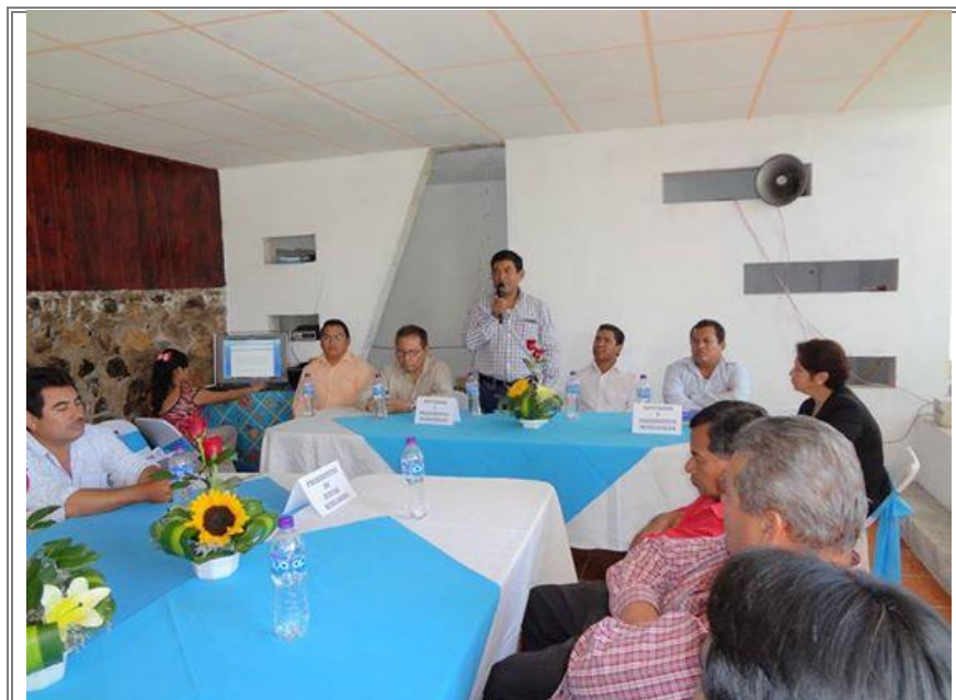
Intervenciones de los asistentes expresando y opinando sobre el proyecto.

Con la finalidad de organizarse e integrar el comité de gestión de la nueva carretera que atravesara a estos municipios interesados. Con la gestión de esta nueva carretera se beneficiara directamente a todos los habitantes de los municipios colindantes, con proyectos como estos se buscan detonar el desarrollo en beneficio de las familias de la región.