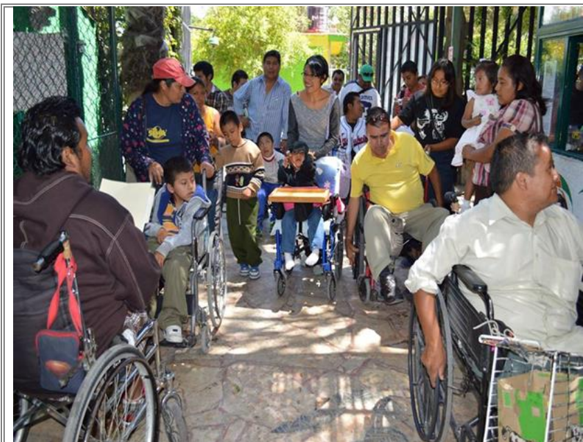
Los integrantes de la asociación civil “Unidos Derribando Barreras” en su visita al “Club de los Animalitos”.