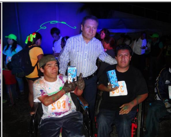
El diputado Sergio Gómez Olivier felicitando a los participantes de capacidades diferentes que se dieron cita al evento deportivo.