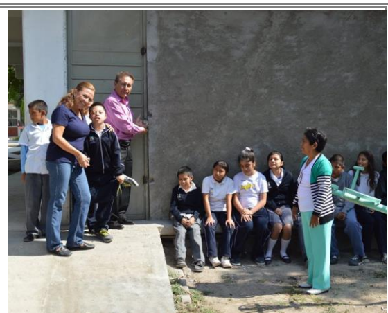
El Diputado Lic. Sergio Gómez Olivier durante la entrega de las protecciones para ventanas y puestas, así como su respectiva instalación en el Centro de Atención Múltiple Héctor Lezama Surroca.