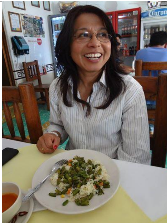
Degustación de la comida típica por parte de la periodista.