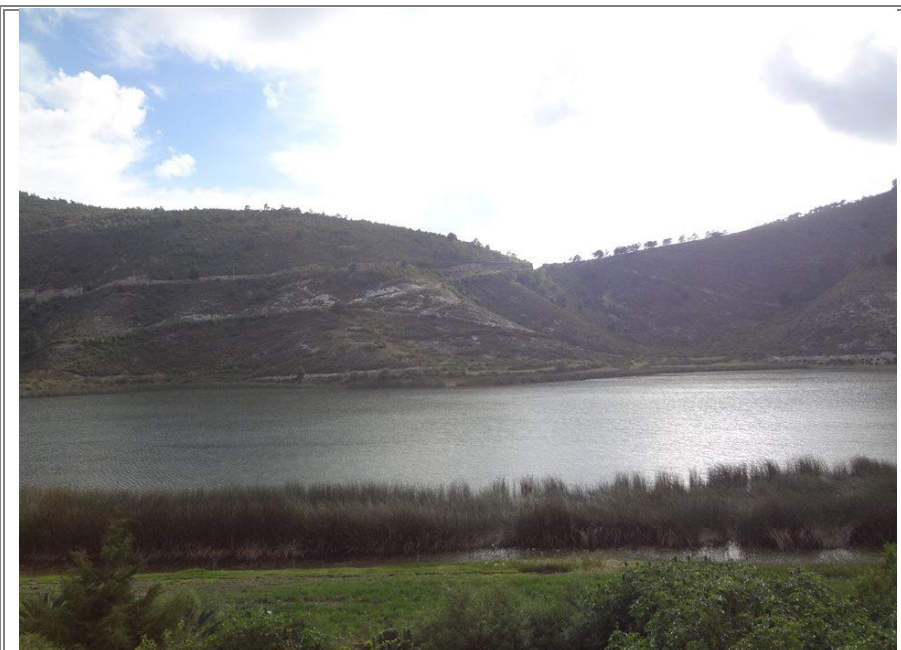
Vista desde la zona ecoturística “El Mirador” en San Bernardino Lagunas.