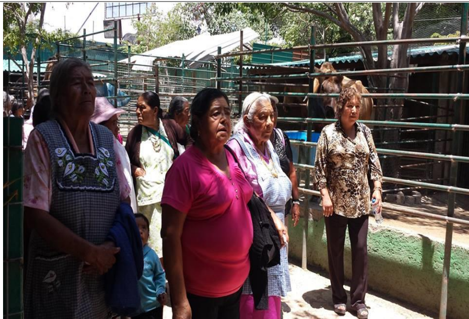
Abuelitos de Tepanco de López recorriendo el zoológico.