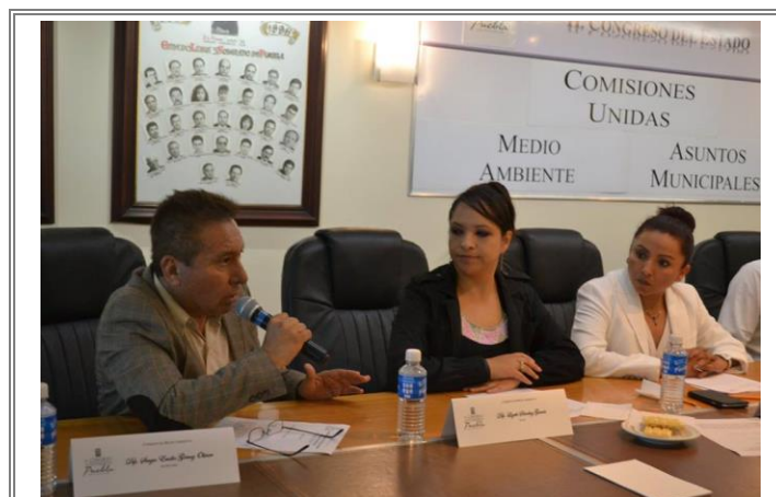
El Diputado Lic. Sergio Gómez Olivier durante su intervención en las Comisiones unidas de Medio Ambiente y Asuntos Municipales.

El acuerdo que se aprobó en las comisiones unidas es el siguiente: "Se invita respetuosamente a los 217 Ayuntamientos del Estado de Puebla para que esta temporada de lluvias refuercen y amplíen las campañas informativas dirigidas a la población en general, con el fin de que se realice una adecuada disposición de los residuos sólidos, con el fin de mitigar las consecuencias del inadecuado manejo de los mismos, como los encharcamientos e inundaciones que se presentan esta temporada."