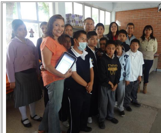
Diputado Lic. Sergio Gómez Olivier acompañado de niños y maestros del Centro de Atención Múltiple Héctor Lezama Surroca.

Con el propósito de conocer el trabajo que ahí se desempeña y atender las necesidades que requiere la institución. El centro de Atención Múltiple Héctor Lezama Surroca es una escuela altruista que atiende a alumnos con capacidades diferentes de la región de Tehuacán con el objeto de ayudar con el desarrollo integral de los niños que así los necesitan.