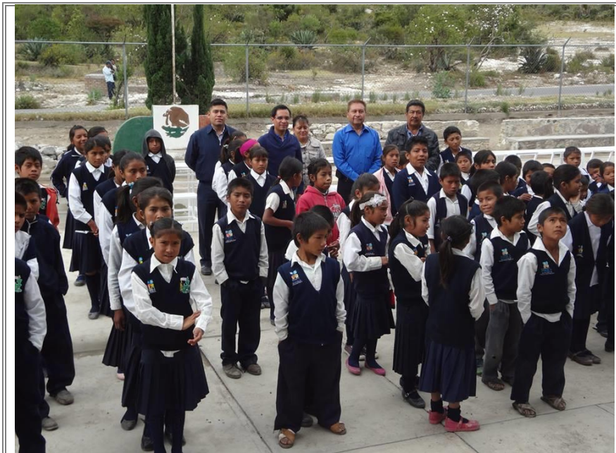
Acompañando a los niños durante su ceremonia.