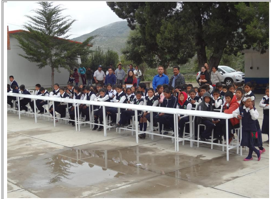
Alumnos utilizando por primera ocasión sus mesas y sillas.