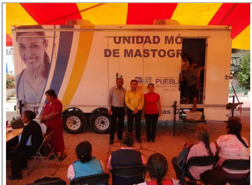
Diputado Lic. Sergio Gómez Olivier en el inicio de la Jornada de Mastografía en Zapotitlán Salinas.

Con el objetivo de promover la salud en las mujeres de dichas comunidades, se gestionó la adquisición de jornadas de mastografía para las comunidades de mayor marginación en busca de elevar los niveles de vida y promover la salud de las mujeres de la región.