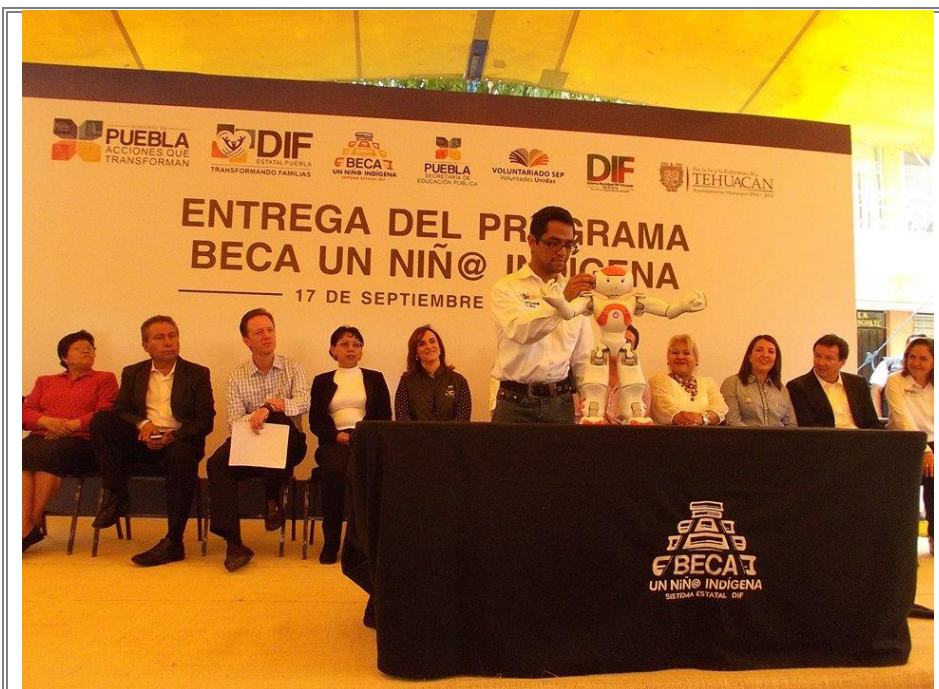
Voluntariado del SEDIF durante la entrega de becas como parte del programa “BECA UN NIÑO INDÍGENA”.