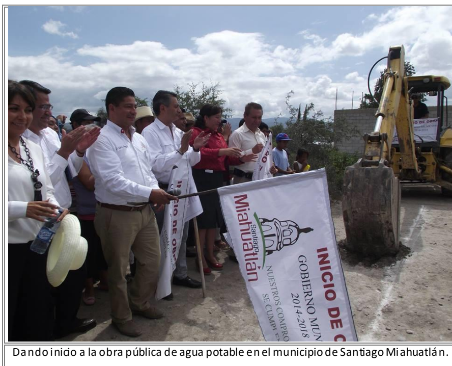
Dando inicio a la obra pública de agua potable en el municipio de Santiago Miahuatlán.

Teniendo como principal objetivo satisfacer las necesidades de los servicios básicos del municipio, de esta manera se creara una red de agua potable de 2.5 km y que contara con 400 tomas, así como, incentivos para proyectos productivos de traspatio y fertilizantes en beneficio de las familias de la comunidad con lo que se espera detonar el desarrollo económico de la región, así como, el mejoramiento de la calidad de vida de los pobladores.