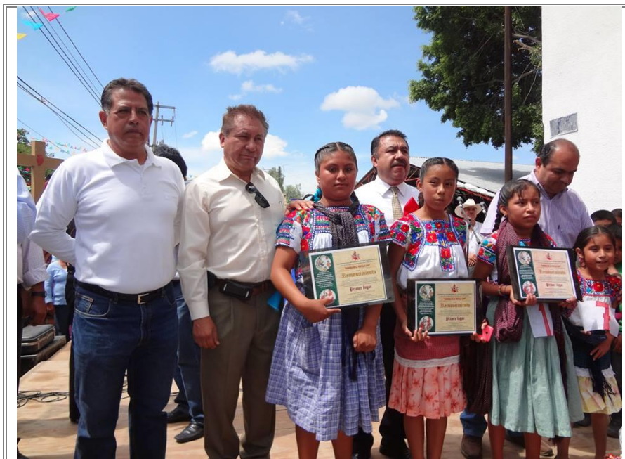
Premiación de la carrera “La Cultura del Maiz y la Tortilla”