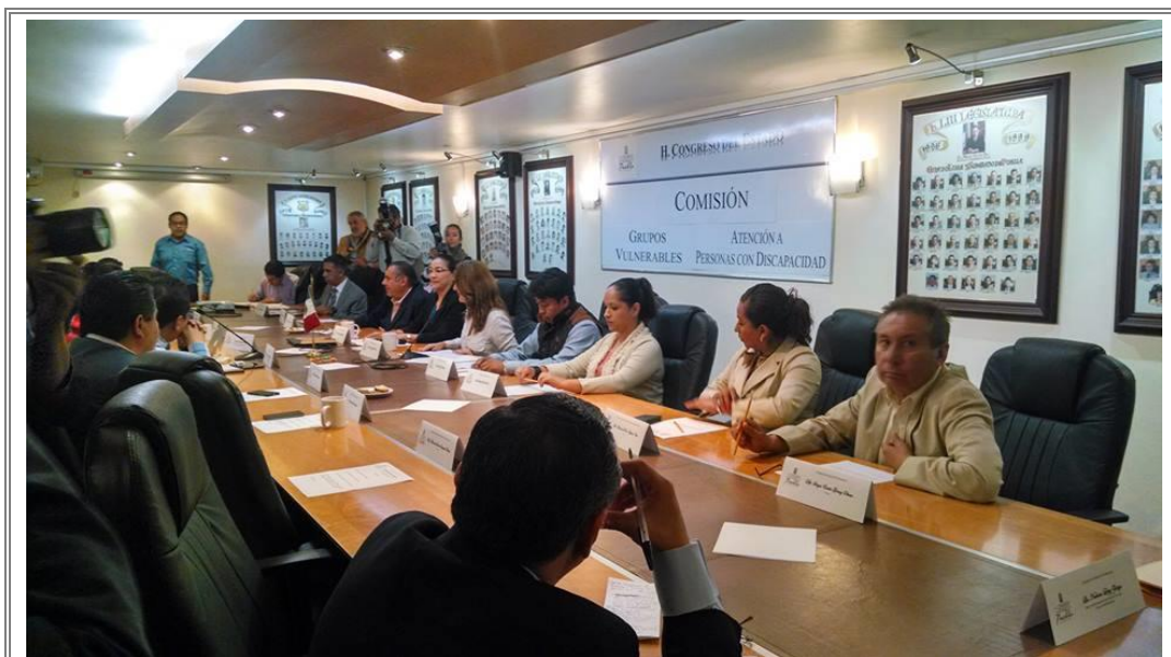
Comisiones unidas de Grupos Vulnerables y Atención a Personas con Discapacidad.