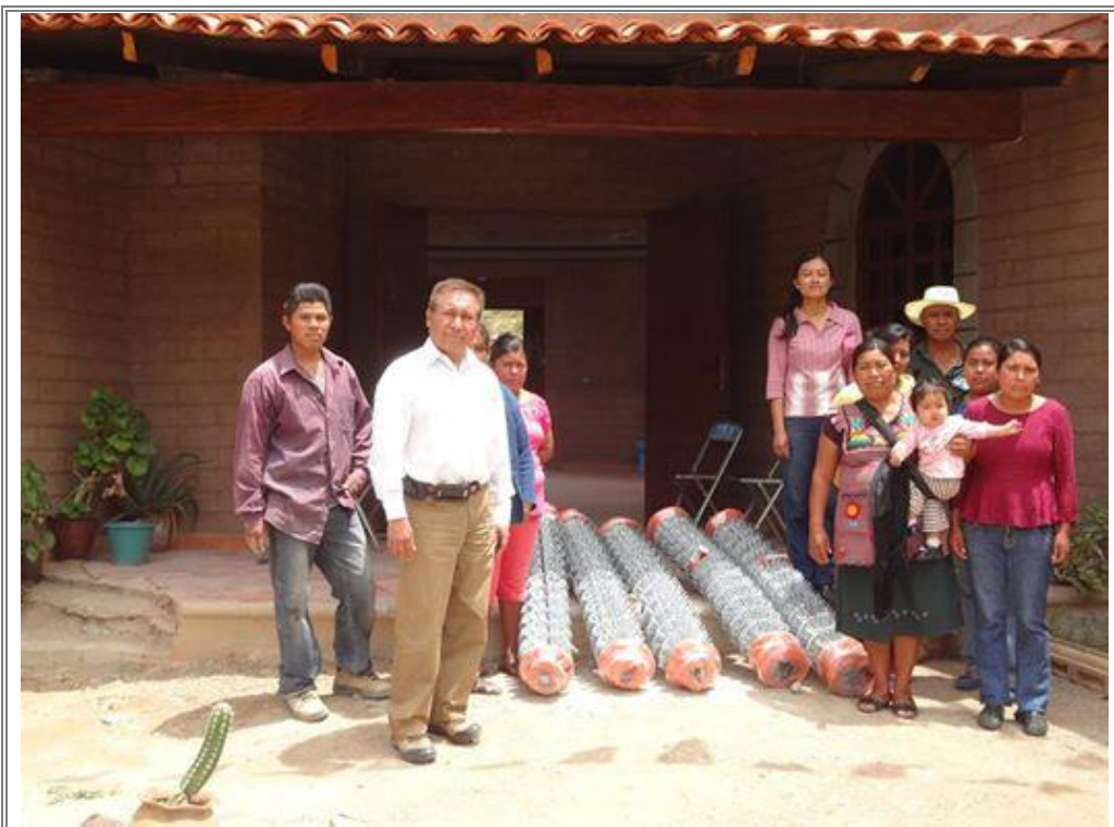
Diputado Lic. Sergio Gómez Olivier en compañía de artesanos realizando la entrega de los rollos de malla ciclónica para la Casa del Artesano.

Con la finalidad de apoyar a los artesanos, con material para el cercado de su lugar de trabajo, donde la mayoría de los artesanos trabajan el barro bruñido y fabrican con sus propias manos hermosas piezas de este material.