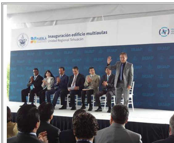
Honorable presidium que encabezó la inauguración del nuevo edificio.

“Tehuacán requiere fortalecer todas las opciones educativas, por lo que me da mucho gusto contribuir con recursos estatales para el desarrollo de esta entidad. Yo veo que tienen carreras muy importantes como derecho y ciencias políticas”, destacó el gobernador del estado.