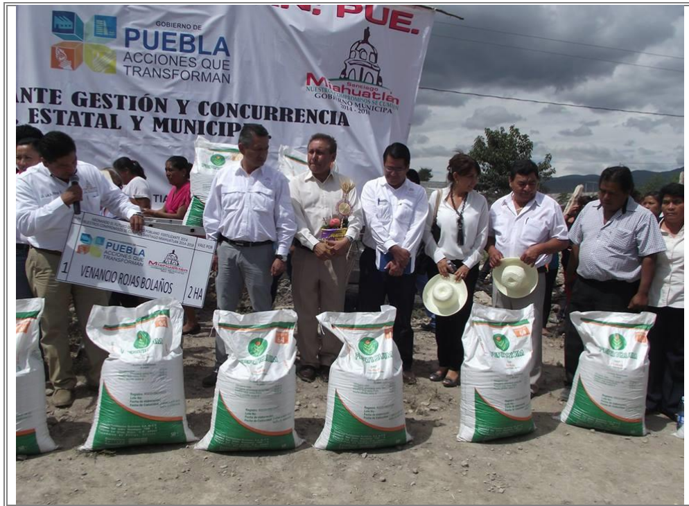
Entrega de incentivos para proyectos productivos en el municipio de Santiago Miahuatlán.