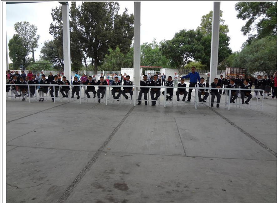
El diputado pasando un rato de convivencia con los alumnos de la institución durante la entrega de material.