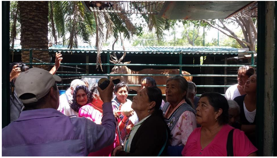
Abuelitos recibiendo una breve descripción de cada uno de los habitantes del zoológico.