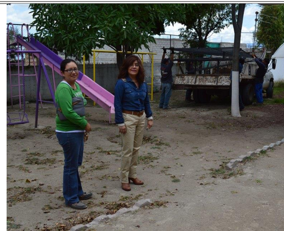
Entrega de protecciones para los salones de computo del Centro de Atención Múltiple Héctor Lezama Surroca.