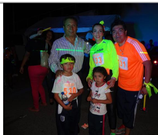
Gran asistencia de las familias para participar en la carrera, aquí una familia completa que termino la carrera.