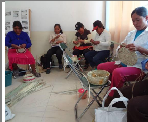
Asistentes al Curso de Capacitación de Tejido de Palma.