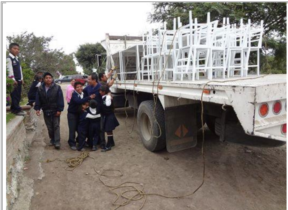
Entrega de mobiliario para los niños de la escuela primaria Rafael Ramírez.

Con el objetivo de reducir la marginación y carencias de la niñez que asiste a la escuela, se realizó la entrega de equipo como mamparas, juegos de baño, mingitorios, lámparas, mesas, lonas, sillas y pintura. Con los cuales se busca apoyar a la comunidad con instalaciones de calidad para el sano desarrollo de los niños que ahí asisten y con ello reducir las brechas de las comunidades marginadas.