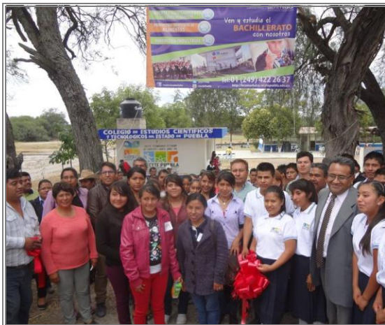
En la inauguración del plantel CECYTE de Santo Nombre en compañía de alumnos, profesores y padres de familia.

Con el fin de promover la educación de calidad y el desarrollo de los jóvenes de la región, con la promoción de instituciones educativas de calidad y la inversión en infraestructura para la creación de planteles educativos que satisfagan las necesidades y el desarrollo integral de la juventud de la localidad.