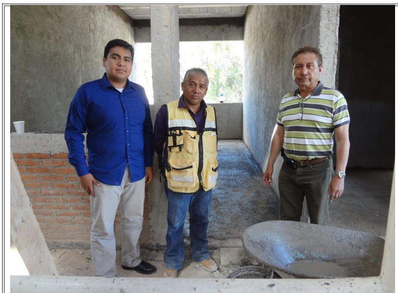
La obra lleva un avance de 80%.