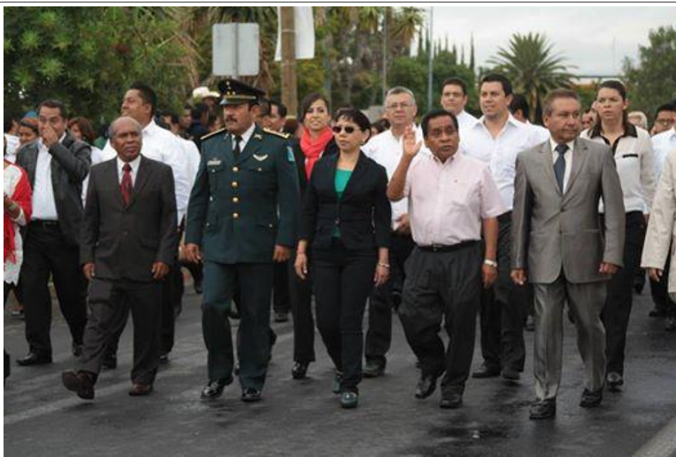
Desfile cívico con motivo del inicio de la Independencia de México realizado en la ciudad de Tehuacán.

En cumplimiento de los deberes cívicos y la conservación de las tradiciones nacionales, las autoridades de Tehuacán participaron en el tradicional desfile en que participan las diversas instituciones educativas de la ciudad de Tehuacán.