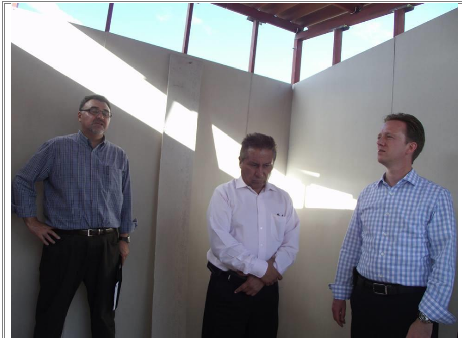
Entrega de apoyos como parte del programa “Colocación de Techos de Fibrocemento” en San Cristóbal Tepeteopan.