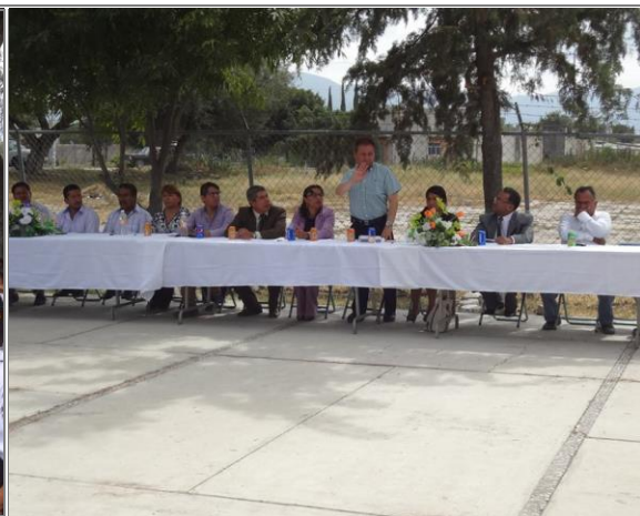
Apoyando la promoción educativa de calidad para la juventud en la región.