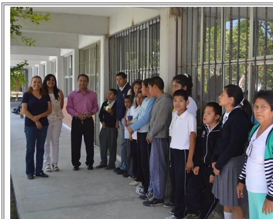
El Diputado Lic. Sergio Gómez Olivier durante la entrega de las protecciones para ventanas y puestas, así como su respectiva instalación en el Centro de Atención Múltiple Héctor Lezama Surroca.

Con el propósito de solidarizarse con la noble causa de atender a personas con capacidades diferentes que atiende esta institución y apoyar a las familias, se complementó la entrega de protecciones para ventanas y puertas de la institución, así como pintura y la instalación de las mismas. De esta manera se busca apoyar a las familias y docentes que atienden en esta institución a personas con capacidades diferentes y que, por tanto requieren de estas herramientas para su desarrollo integral.