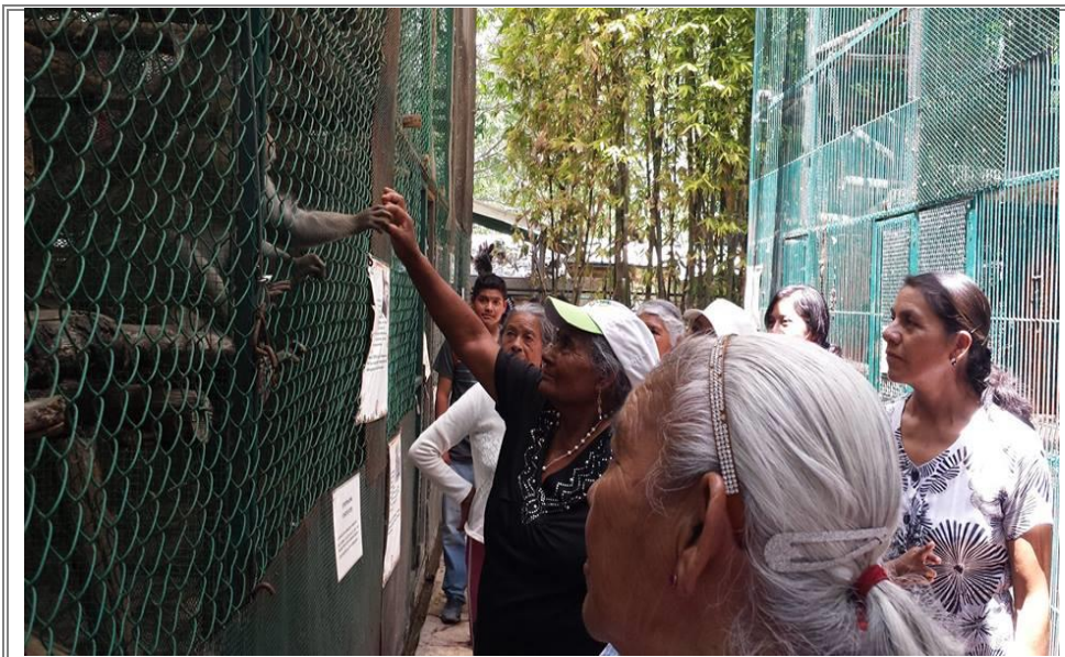
Abuelitos de Tepanco de López interactuando con los animales.

Con la asistencia de los abuelitos se buscó brindar un agradecimiento a nuestra gente de edad mayor y así pasar un momento de recreación con los animales del zoológico que generaron un gran asombro entre todos los asistentes.