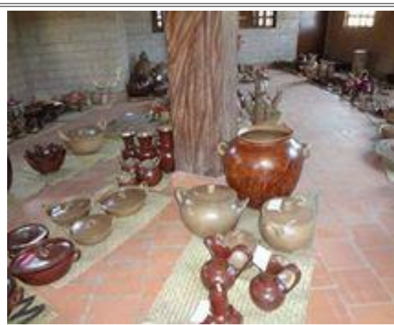
Artesanías de cerámica elaboradas por los participantes del concurso.