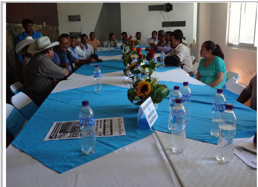
Integrantes de los diversos municipios, integrando el comité de gestión.