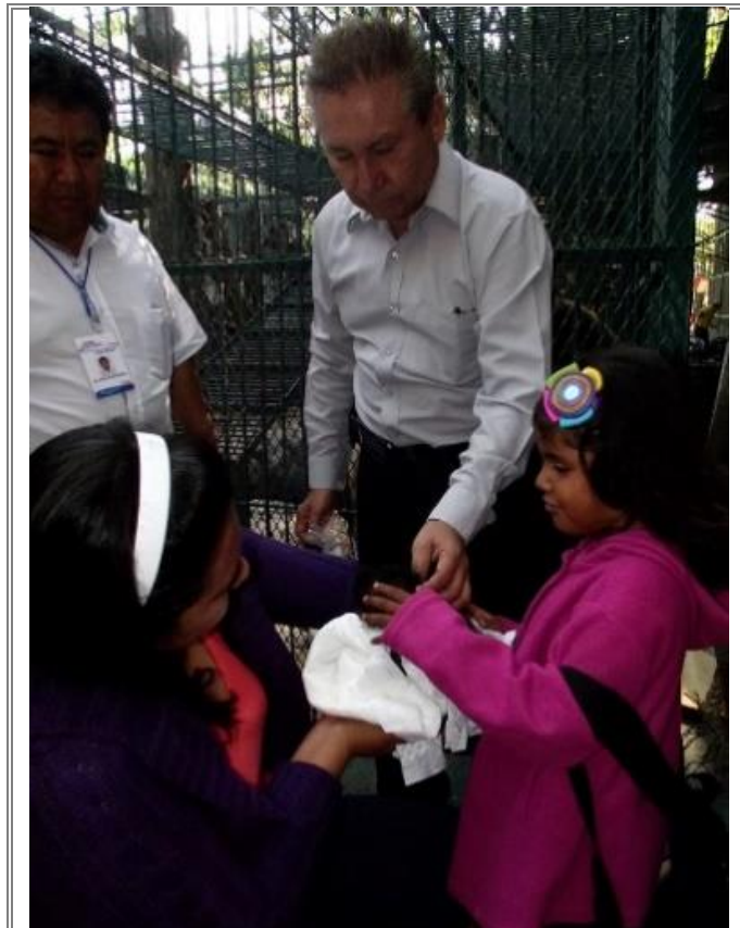
Diputado Lic. Sergio Gómez Olivier acompañando a niños con capacidades diferentes durante su visita a “El Club de los Animalitos”.

Con el objetivo de que la interacción con los animales les sirva como terapia, pues está comprobado que la interacción con algunos animales ayuda durante los tratamientos de rehabilitación de personas con capacidades diferentes, inclusive existen tratamientos específicos con determinadas especies de animales.