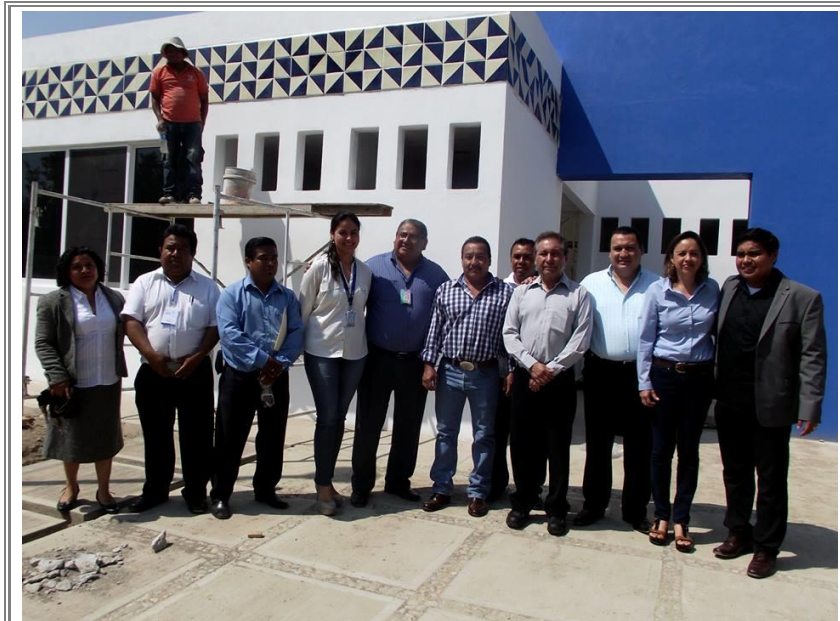
Visita de diversas autoridades para verificar los avances de lo que será la clínica de salud de San Pablo Tepetzingo.