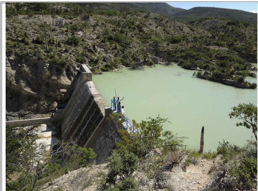
Represa de tierra compacta.