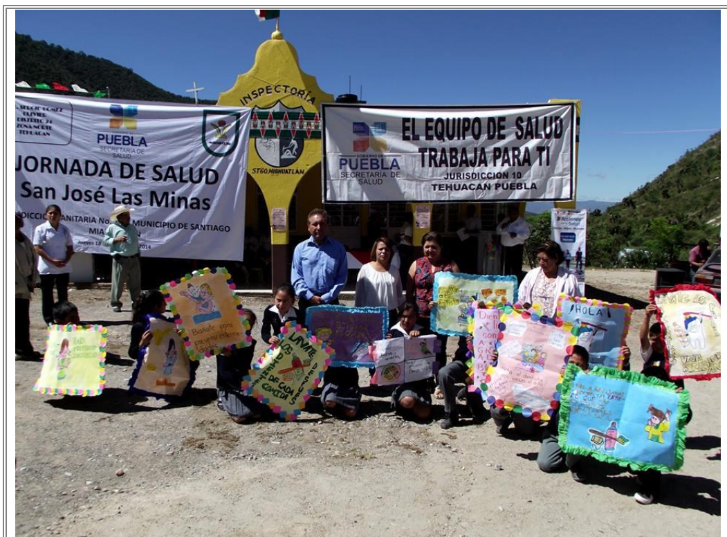
Diputado Lic. Sergio Gómez Olivier en compañía de niños y madres de familia durante la Jornada de Salud de San José las Minas.

Con la finalidad de proporcionar asistencia en materia de salud a la comunidad, donde se están proporcionando servicios dentales, de oficios por parte del ICATEP, unidades de control canino, pláticas sobre nutrición; obesidades; control de diabetes; salud reproductiva, pruebas de cáncer de próstata y asesoría jurídica.