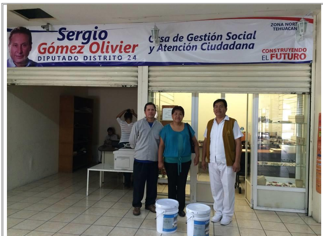
Entrega de dos cubetas de pintura para la Escuela Preparatoria Federal por Cooperación Otilio Montañó .

A fin de brindar apoyo a las instituciones educativas del distrito, se realizó entrega de un bote de pintura blanca y un bote de pintura azul al comité de pro-clausura para pintar la barda de la institución.