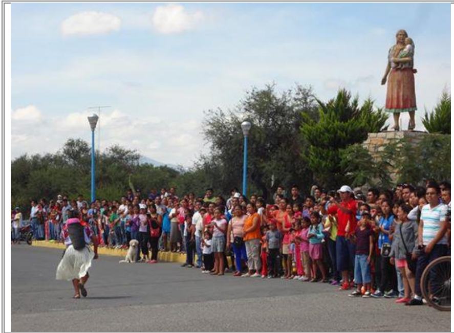
Asistencia de las familias para brindar apoyo a las participantes de la carrera.