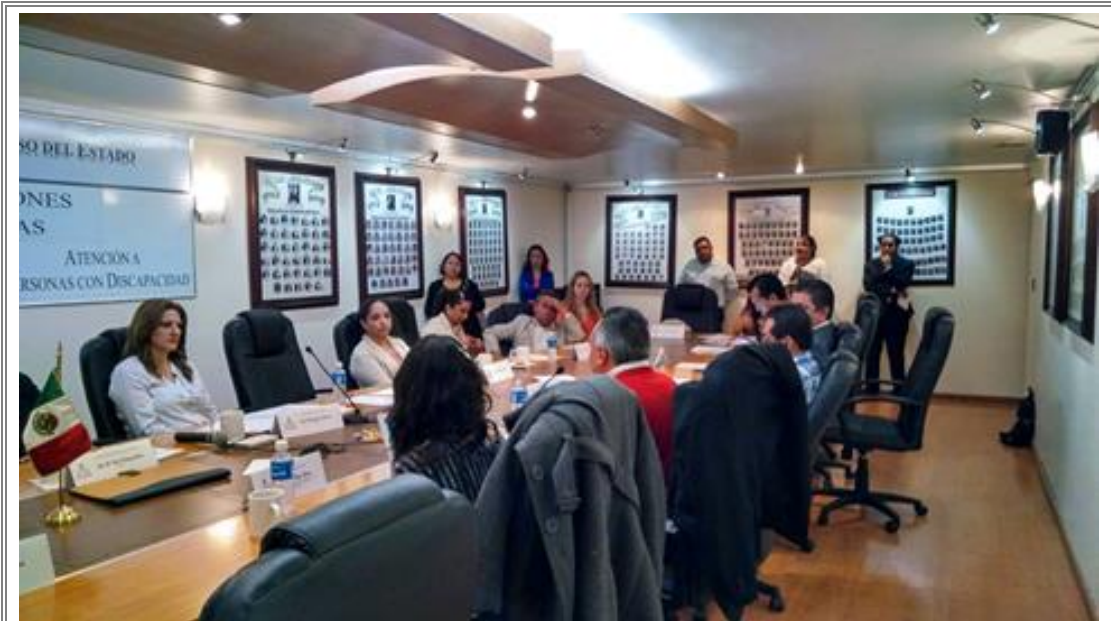
Comisiones unidas de Grupos Vulnerables y Atención a Personas con Discapacidad.