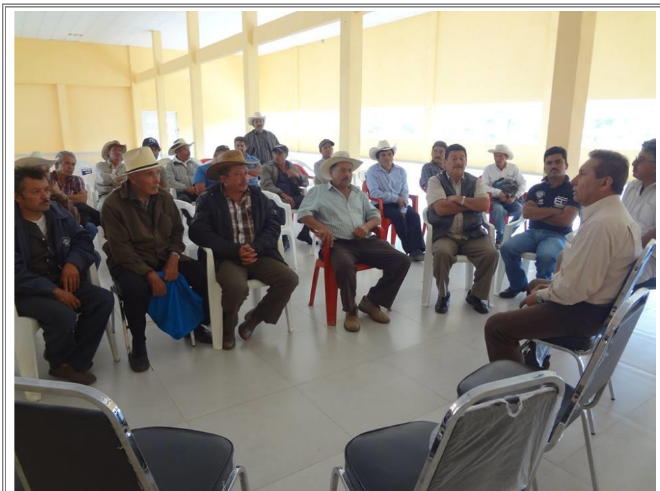
El Diputado Lic. Sergio Gómez Olivier exponiendo el proyecto a pobladores de la región.

Con el propósito de brindar una alternativa de desarrollo, se les expuso a los campesinos y productores forestales del Municipio de Nicolás Bravo, para que de forma voluntaria y respetando la voluntad y decisión de ellos, se comenzara a realizar la declaratoria del "Parque Nacional del Cerro Colorado-la Hierbabuena", con la finalidad única y exclusiva de tener más opciones productivas a través del ecoturismo para el desarrollo económico de estos pueblos.