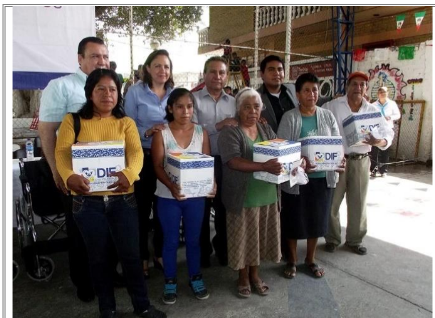
Entrega de despensas a adultos mayores.