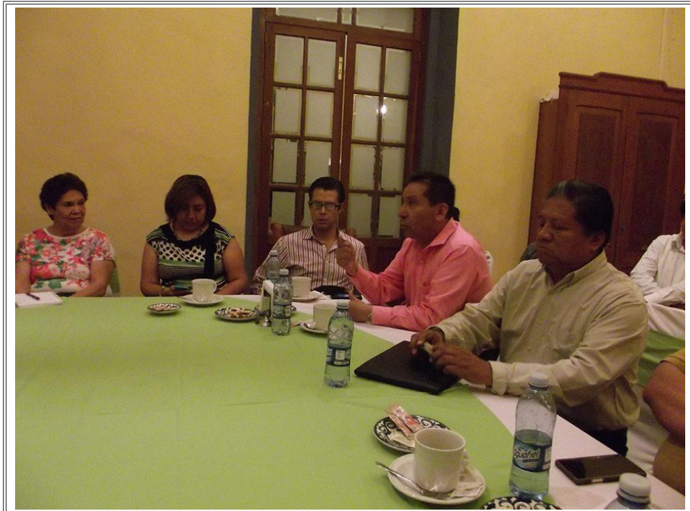
Reunión de trabajo con empresarios hoteleros de la región de Tehuacán.