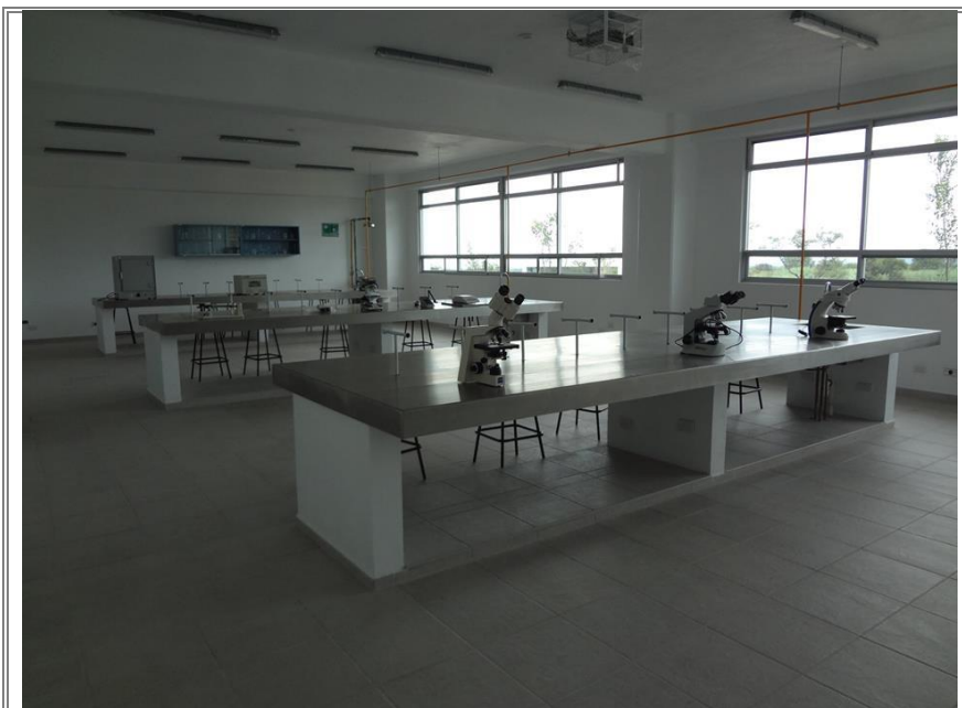
Laboratorio equipado con microscopios de gran potencia.