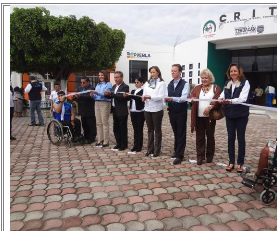
Gira de trabajo por parte del voluntariado del SEDIF en Inauguración del CRIT Tehuacán.

Con el propósito de brindar atención a los habitantes de la ciudad y su región, mediante la inauguración de instalaciones equipadas del CRIT de Tehuacán, reequipamiento de la Estancia de Día del INFONAVIT el Riego, Inauguración del Desayunador Escolar de la "Escuela Primaria Fuertes del Loreto", inauguración del CECADE en San Lorenzo Teotipilco, entrega de equipos a CECADES y aparatos ortopédicos en el polideportivo La Huizachera y finalizando en la Escuela primaria Albergue Porfirio Cordero con la entrega de apoyos del "Programa Beca a un Niño Indígena 2014".