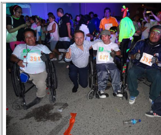
Impresionante muestra de superación de todos los deportistas, en especial de quienes sufren algún tipo de discapacidad.