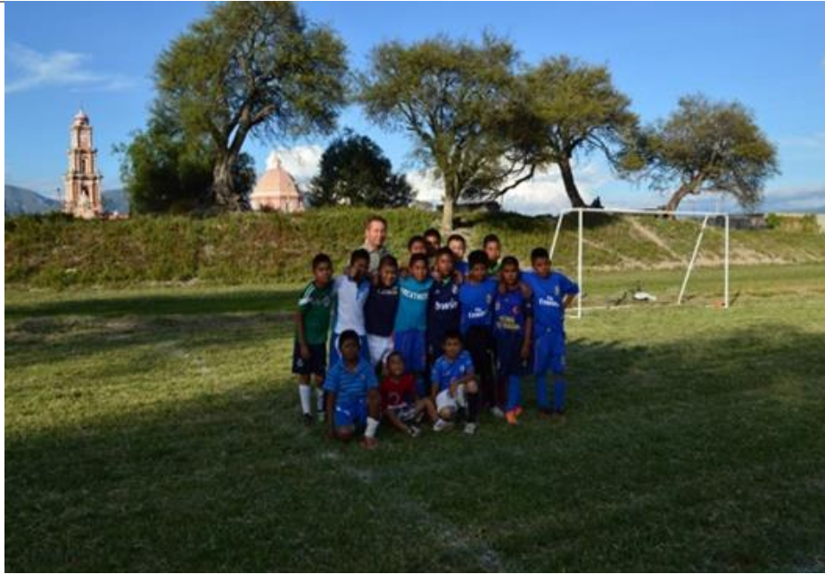
El Diputado Lic. Sergio Gómez Olivier acompañado del equipo de futbol de San Bartolo Teontepec.