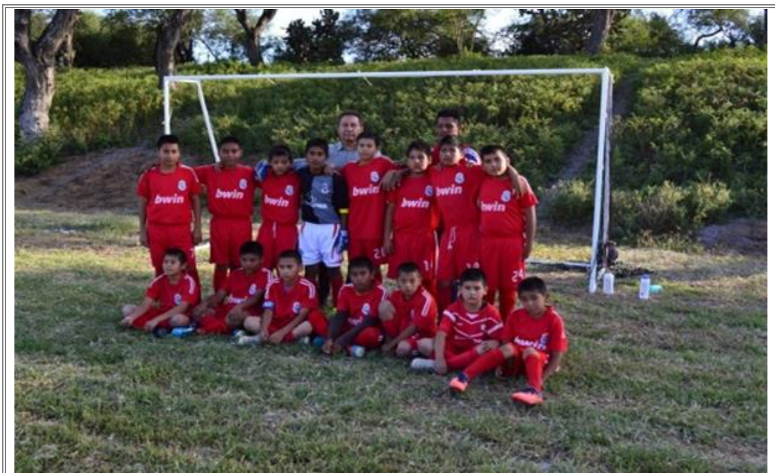
El Diputado Lic. Sergio Gómez Olivier acompañado del equipo de futbol de Tepanco de López.

Con la finalidad promover en la niñez el hábito por el deporte, el diputado estuvo presente con los pobladores del Municipio de Tapanco de López y San Bartolo Teontepec, apoyando a los niños que juegan en la liga infantil regional de futbol con la donación de porterías para fomentar el deporte en estos Municipios.