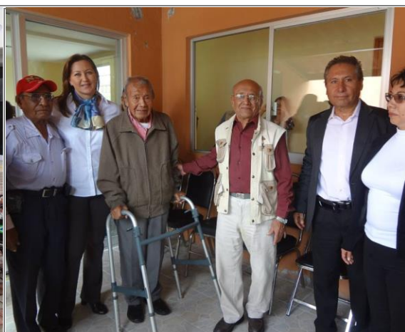
Entrega de aparatos ortopédicos.