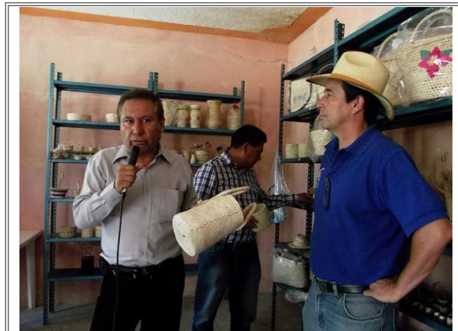
Diputado Lic. Sergio Gómez Olivier durante la promoción de las artesanías de palma de Zapotitlán Salinas.

Con la finalidad de promocionar las artesanías que ahí se producen, apoyados de una videograbadora se realizó un breve documental con la intención de que sea presentado en Estados Unidos de América con la ayuda del Lic. Pedro Ramos mediante el festival anual “La Feria de los Moles” que se celebrara en Los Ángeles California.