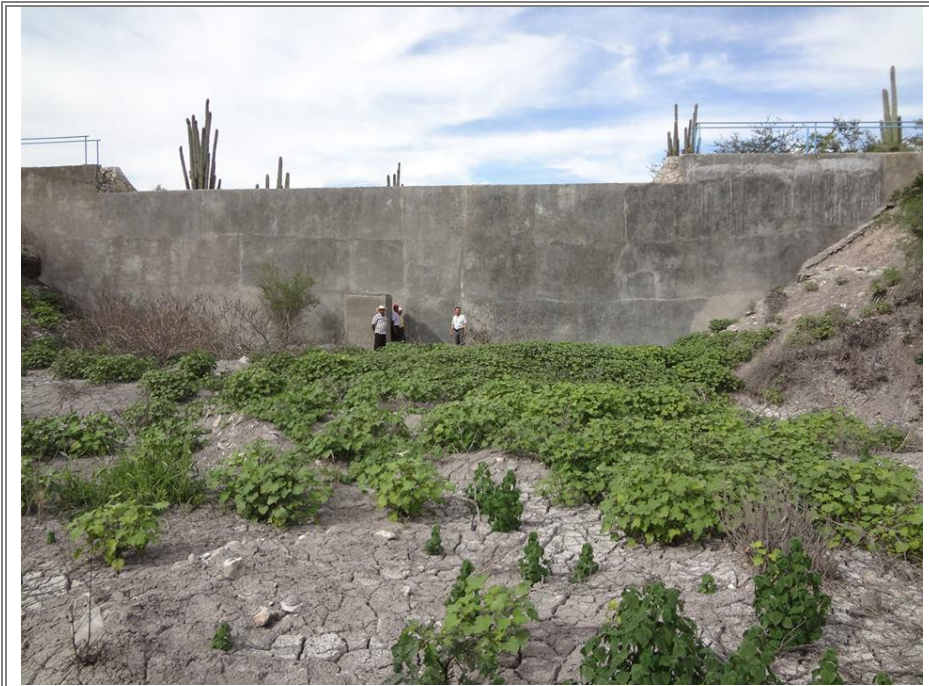
Represa de San Bartolo Teontepec.