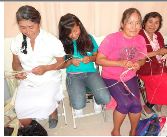
Mujeres durante la elaboración de material mediante el tejido de palma.