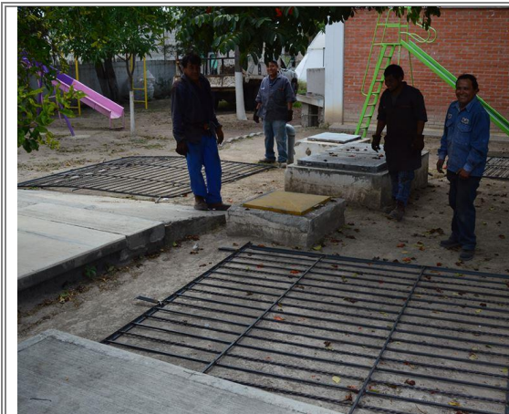
Entrega de protecciones para los salones de computo del Centro de Atención Múltiple Héctor Lezama Surroca.

Con el propósito de solidarizarse con la noble causa de atender a personas con capacidades diferentes que atiende esta institución, se hizo entrega de protecciones para resguardar el equipo del salón de computo de la institución que atiende a personas con capacidades diferentes y que, por tanto requieren de estas herramientas para su desarrollo integral.