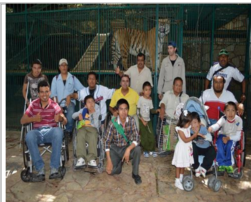
Los integrantes de la asociación civil “Unidos Derribando Barreras” en su visita al “Club de los Animalitos”.