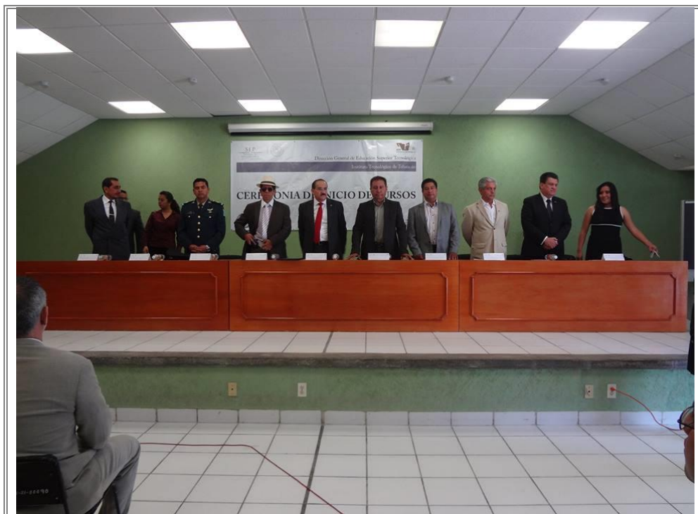
Presidium que encabezó la ceremonia de entrega de reconocimientos.

El diputado participo en la entrega de reconocimientos a docentes con 10, 20 y 30 años de servicio en la institución y por su compromiso con la educación de la juventud de la región.