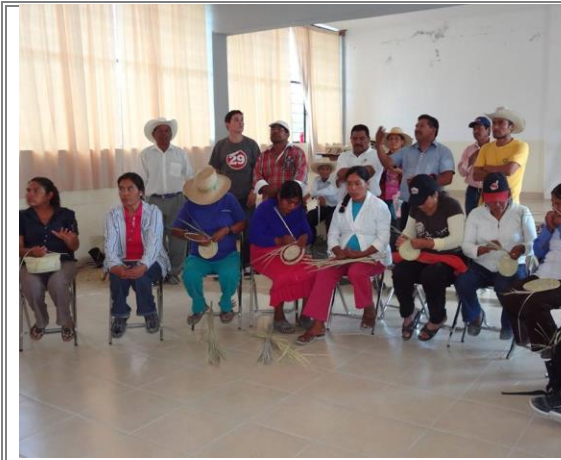
Gran asistencia por parte de la comunidad tanto de mujeres como de hombres para el curso de capacitación.