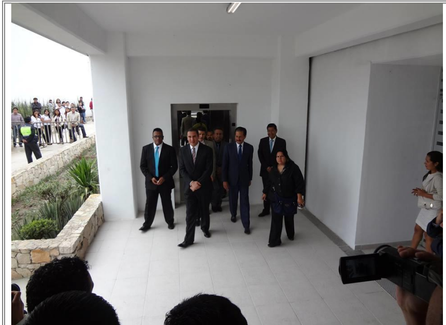
Recorrido de las autoridades por las instalaciones del nuevo edificio.