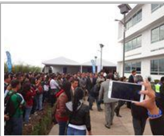
Recorrido de las nuevas instalaciones.