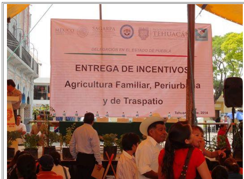
Entrega de incentivos por parte de SAGARPA como parte del programa “Cruzada Nacional Contra el Hambre” para la Agricultura Familiar, Periurbana y de Traspatio.

Con el objetivo de promover la agricultura y el bienestar social, se realizó la entrega de incentivos para promover la agricultura y el bienestar social que impulsa el programa “Cruzada Nacional Contra el Hambre” a todos aquellos agricultores que estén realizando proyectos, de esta manera se busca beneficiar a las familias de la región.