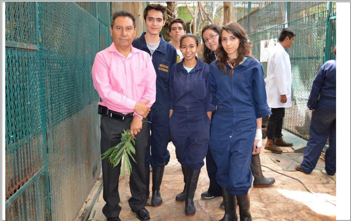
Visita de estudiantes de la UNAM a las instalaciones del zoológico "Club de los Animalitos".