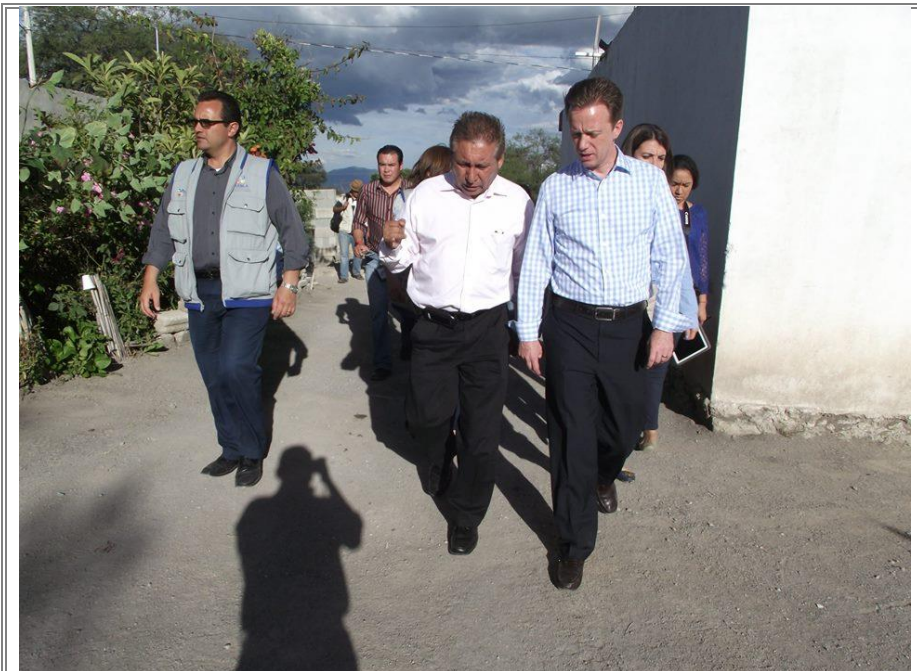
Entrega de apoyos como parte del programa “Colocación de Techos de Fibrocemento” en San Cristóbal Tepeteopan.