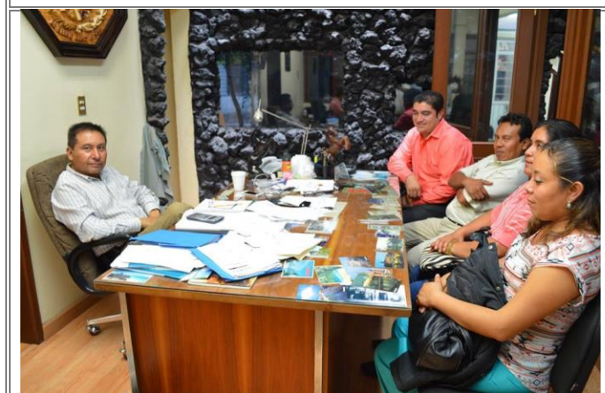
Reunión de trabajo con autoridades de Tlacotepec de Porfirio Díaz.