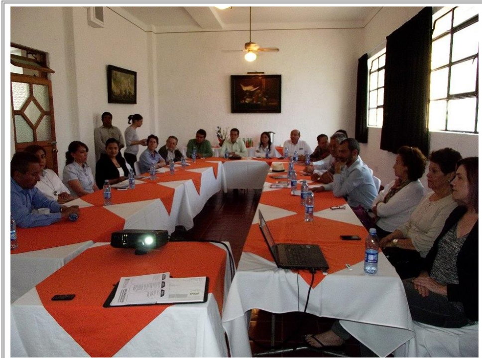
Reunión de trabajo con empresarios hoteleros de la región de Tehuacán.