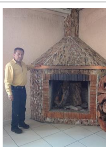
Diputado Lic. Sergio Gómez Olivier recorriendo el sitio ecoturístico “El Mirador”.

Con el propósito de promover el turismo de la región, “El Mirador” es un centro ecoturístico y de campismo ubicado en una zona de conservación y reforestación que cuenta con servicios de restaurant y hospedaje, además de encontrarse en una excelente ubicación y gozar con una magnifica vista de la laguna. Con la promoción de proyectos como este se busca potenciar la imagen turística a la vez que se beneficia a las familias y reservas ecológicas de la región.