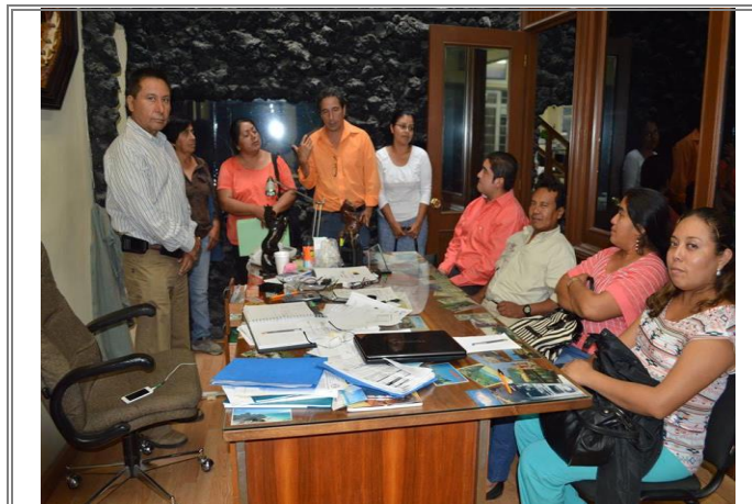
Reunión de trabajo con autoridades de Tlacotepec de Porfirio Díaz.

Con el propósito de generar proyectos y coordinar trabajo conjunto para el desarrollo de la comunidad y la región.