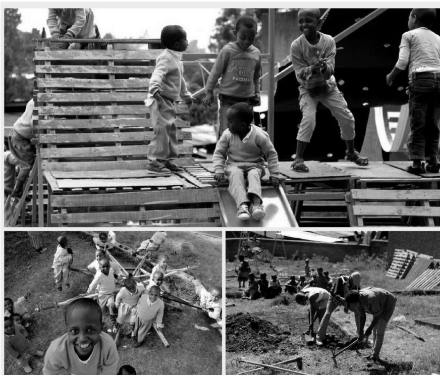
Rysunek 3. Plac zabaw zaprojektowany na terenie sierocińca w Etiopii.